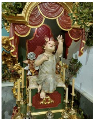
Archivo de Hermandad