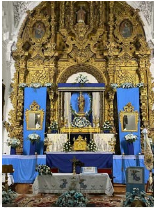
Miguel Ángel Jiménez