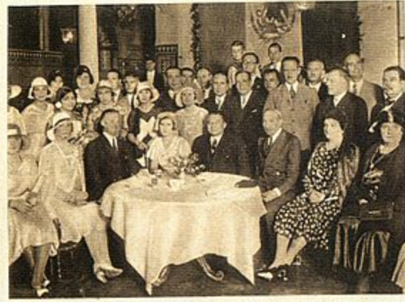
Autoresidades, Cuerpo Consular americano y colonia mejicana, durante la fiesta que se celebró con motivo del aniversario de la proclamación de la independencia de Méjico