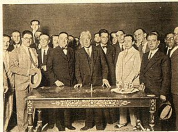
El ex ministro y elocuente orador don Niceto Alcalá Zamora, con la junta directiva del Casino Republicano, después de la conferencia que dió en el frontón Betis