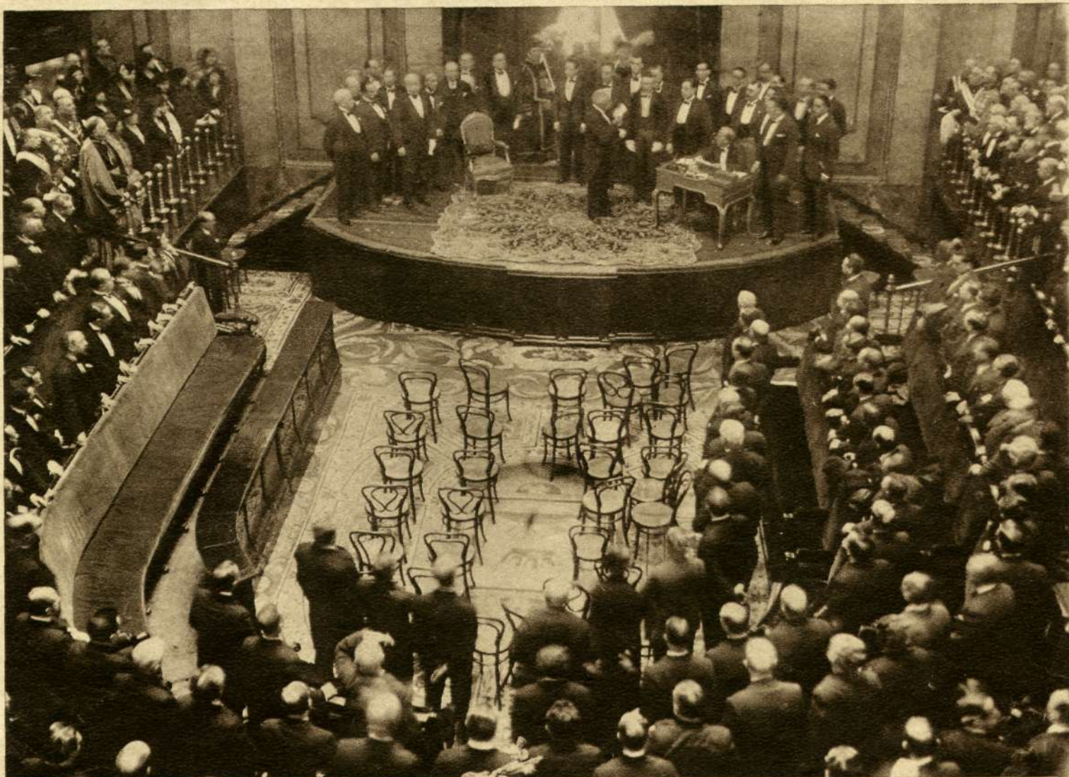
Primera hora de la tarde de ayer. En el salón de sesiones del Congreso, con la máxima solemnidad, el Presidente de la República promete respetar y defender la Constitución, que abre hoy un nuevo capítulo de vida española. En el centro del estrado, don Niceto Alcalá Zamora; a la derecha, la mesa presidencial, y a la izquierda, el Gobierno. En la tribuna de la izquierda, el Cuerpo Diplomático