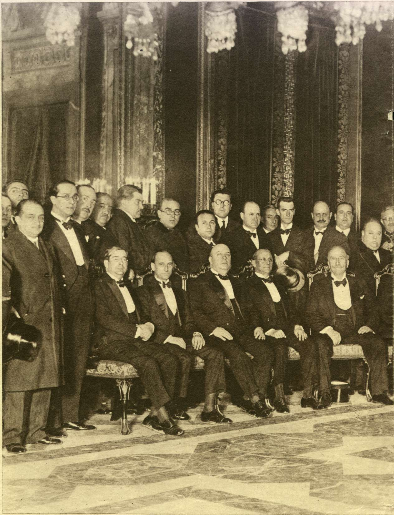
El Presidente de la República, el Gobierno y las autoridades, después del desfile