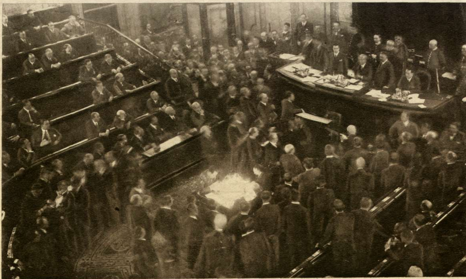
Terminada la votación para la elección de Presidente, en la sesión de anteayer jueves, el presidente de las Cortes, señor Besteiro, lee, ante el silencio expectante de la Cámara, el escrutinio, que arroja una absoluta mayoría a favor de don Niceto Alcalá Zamora