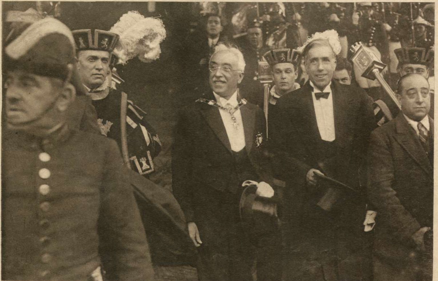
Terminada la ceremonia de la promesa, el jefe del Estado, acompañado del presidente de las Cortes, señor Besteiro, sale del edificio para ocupar el coche en que se trasladarán al Alcázar. Don Niceto Alcalá Zamora, ya con el collar de Isabel la Católica, que le ha sido impuesto en la misma ceremonia, sonríe a las aclamaciones populares...