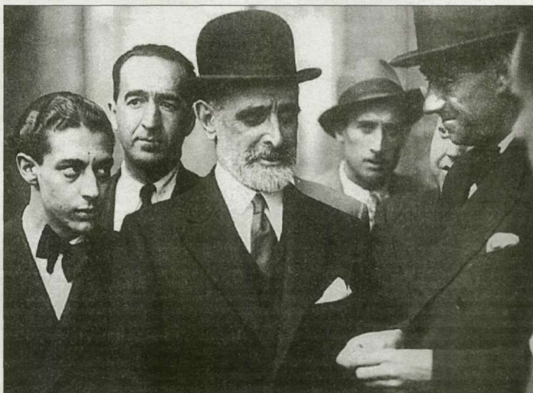
Cambó conversa con un grupo de periodistas en Madrid en abril de 1935.

La pluralidad de los miembros del consejo asesor y la variedad de tendencias de estudios que la fundación se ha propuesto promover son un reflejo del tercer objetivo, menos explícito, que se han propuesto los impulsores del instituto: contribuir a que la figura de Francesc Cambó sea cada vez más objeto