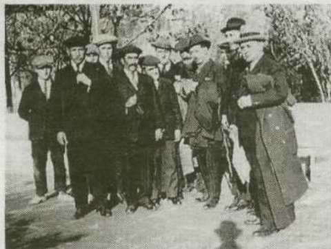
Un grupo de "rabassaires" con Companys en el centro (1922)

■ Companys se fijó en la problemática agraria y favoreció que el republicanismo de izquierda penetrará en el campo catalán con fuerza al asumir, desde su posición de agitador, de abogado al servicio de los aparceros y similares un compromiso de ayuda. Forjó, con Aragay y otros, un sindicato moderno en su concepción (locales, prensa y servicios) contando la Unió de Rabassaires de Catalunya (URC), con la revista "La Terra", de la que fue director. La publicación, pese a limitaciones redaccionales y de medios, fue un potente instrumento propagandístico muy eficaz. La creación de centros fue una labor lenta que tuvo lugar tras los míticos