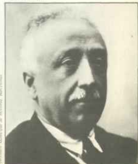
NICETO ALCALÁ ZAMORA