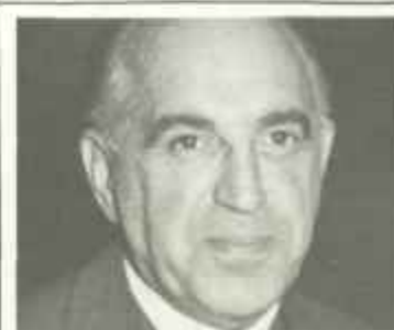
El doctor Marañón, en cuyo domicilio tuvo lugar la negociación que dio paso a la transferencia de poderes, ha dejado esta impresión del histórico momento.

En la mañana del 14 de abril, muy temprano, tuvimos informes concretos de que la situación agudísima creada por el éxito republicano en las urnas dos días antes, podía resolverse, a poco que las circunstancias ayudasen a ello, en una fase de violencia. El pueblo, con la conciencia exultante de lo que representaba su victoria electoral, exigía soluciones radicales e inmediatas que no era posible eludir con recursos normales, como una nueva crisis ministerial, como en efecto se intentó, ni con el programa constitucionalista, que ya había perdido su eficacia. Se temía en la calle, caldeada del fervor del éxito, una nueva dictadura como arbitrio supremo para salvar el régimen; y la multitud se aprestaba a impedirlo. Por otra parte, de los cuarteles, hasta entonces a la expectativa, llegaban noticias de inmediatas sediciones, unas, tal vez para apoyar al rey vencido en las urnas; otras para sumarse en las calles al triunfante movimiento republicano. Era preciso evitar estos acontecimientos, que se cernían ya, como nubes cargadas, en el horizonte de la mañana; y, sin duda, muchas voces sensatas hablaron con apremio a los consejeros del rey; quién sabe si a éste mismo. Nosotros cumplimos nuestro deber advirtiendo desde primera hora lo que iba a suceder al conde de Romanones, que representaba en realidad la cabeza y el alma del gobierno entero; por su inteligente experiencia (ahora desorientada) y por la venilla liberal que nunca se extinguió por debajo de su fe cortesana.