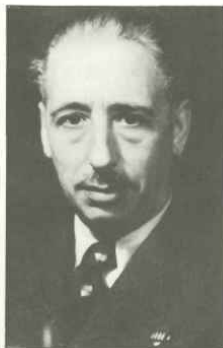
Lluís Companys, gobernador designado por Macià.