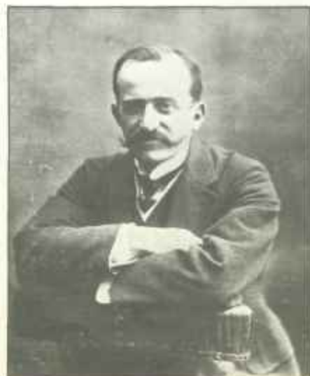
CONDE DE ROMANONES