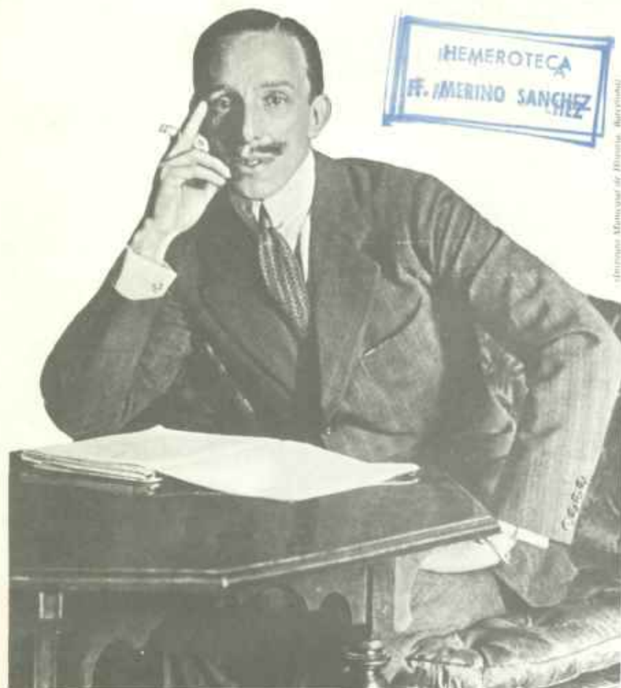
EL PERSONAJE ALFONSO XIII