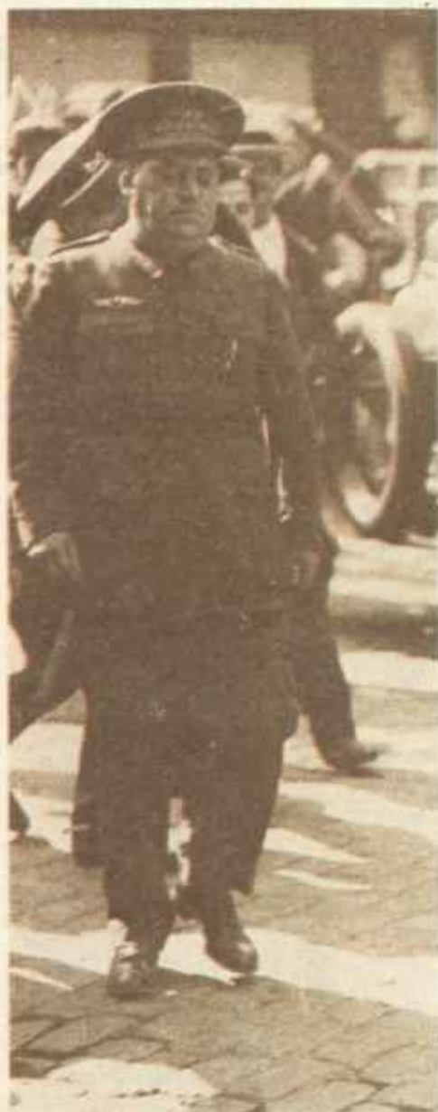
Esta foto fue captada en Sevilla poco después de producirse el levantamiento. En ella Sanjurjo pasea por una de las calles céntricas de la ciudad, que abandonó el mismo día.