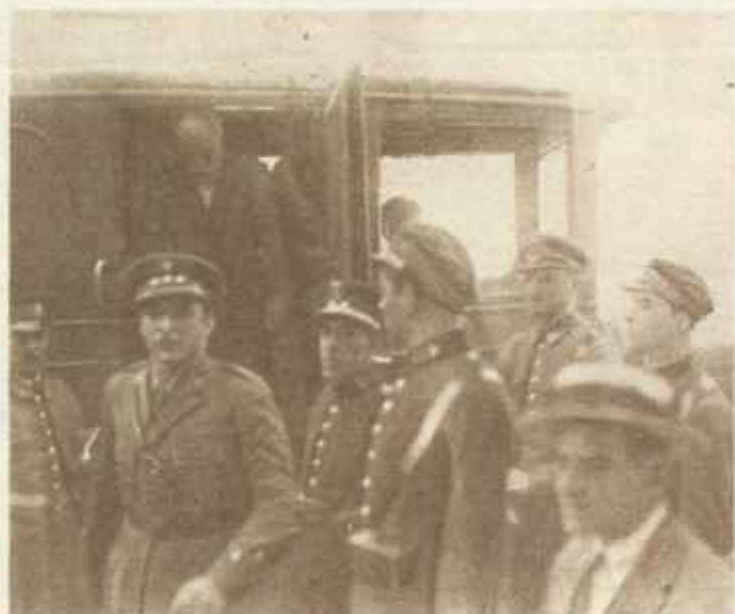
En la madrugada del 10 de agosto, varios grupos de confabulados intentaron apoderarse de los centros neurálgicos de Madrid. A la misma hora estalla la sublevación en dos cuarteles de caballería de la capital. Abortada la intentona comenzaban las detenciones.