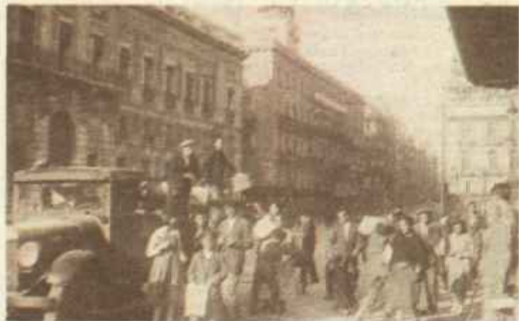
Distribución del periódico a los vendedores a primera hora de la mañana. Por espacio de tres meses y medio esta operación llena de típico castizo no pudo realizarse en el transcurso del turbulento 1932.

Este mismo día ABC valoraba en 2.391.438 pesetas, sus pérdidas durante la suspensión. ●