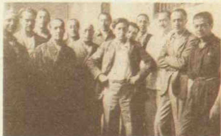
En una galería de la Cárcel Modelo el marqués de Luca de Tena —quinto por la izquierda— junto a otras personalidades ilustres: Miguel Primo de Rivera, Joaquín Calvo Sotelo... Era en septiembre del 32.