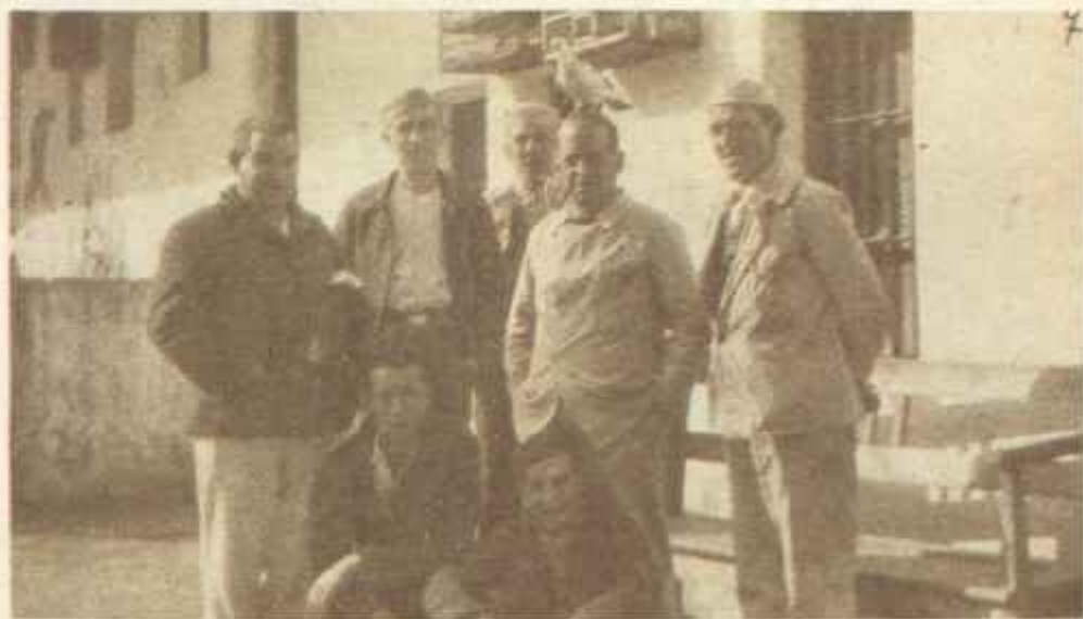
En el consejo sumarísimo que se siguió en Madrid contra los implicados en los sucesos del 10 de agosto, Sanjurjo fue condenado a muerte, posteriormente indultado y encarcelado en el penal del Dueso, primero, y más tarde, en el castillo de Santa Catalina, en Cádiz, hasta que una amnistía le permitió trasladarse a Portugal, donde fijó su residencia.