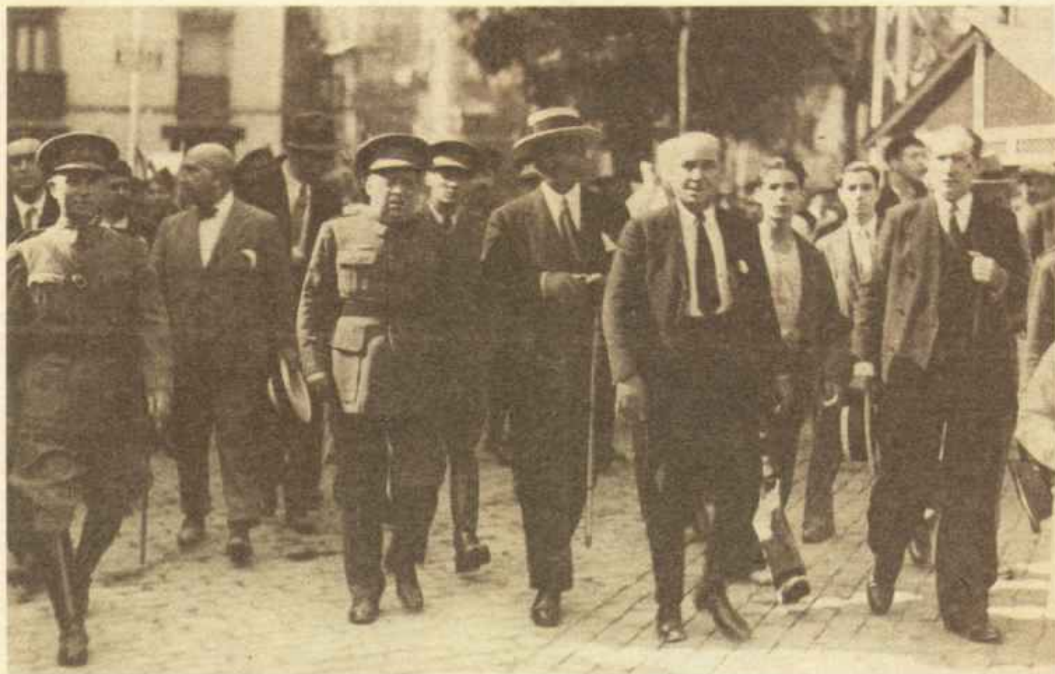
El 10 de agosto de 1932, a la misma hora en que se iniciaba la sublevación en Madrid, el general Sanjurjo declara el estado de guerra en Sevilla. En la fotografía aparece atravesando las calles sevillanas horas después de apoderarse de la ciudad sin disparar un solo tiro.