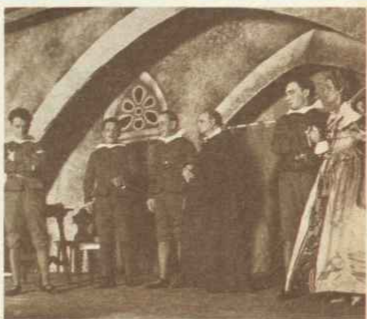
Una escena de «El Divino Impaciente», de Pemán; el día del estreno.

1932 había sido, también, un buen año para las tablas españolas. Durante esta temporada, Unamuno estrena «El otro» en el teatro Español, y Eduardo Marquina —iniciando así la corriente de teatro religioso que culminaría después la obra de Pemán— presenta «Teresa de Jesús» en el Beatriz. ●