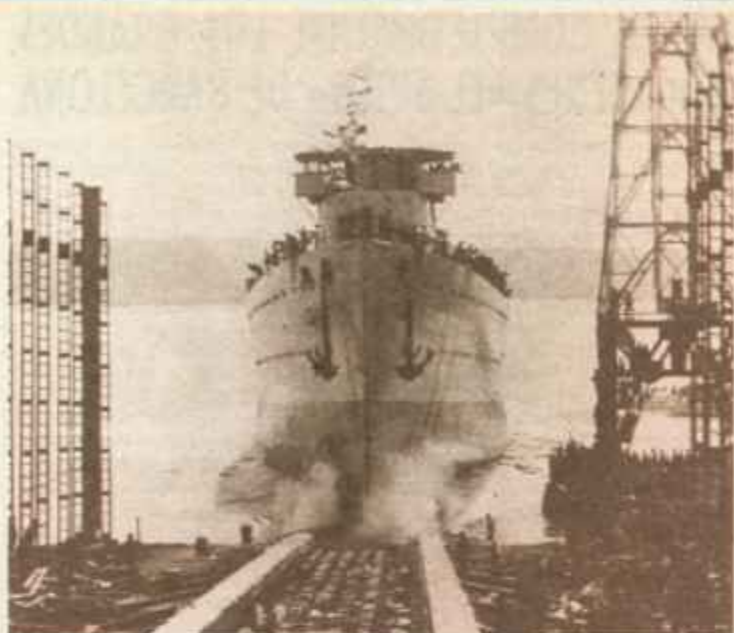
21 de abril de 1932: el «Baleares» acababa de entrar en el mar.

banda de música entonó el himno republicano, y el nuevo barco entró majestuosamente en el mar». Por las mismas fechas que se construían estas nuevas unidades, el Gobierno emprende la venta de gran parte de los dispositivos de la Armada. Así, en cuestión de pocos meses, la República se desprende de seis torpederos, cuatro cruceros, dos submarinos, dos remolcadoras, un destructor y un cañonero. Mientras, prosiguen a buen ritmo las obras de lo que será la Ciudad Universitaria de la capital. En enero de 1932 se inaugura oficialmente el nuevo edificio de la Facultad de Filosofía y Letras de la Universidad de Madrid, en cuyas aulas se impartirán las clases del próximo curso académico. También en agosto de este año se inaugura la Cárcel de Mujeres de Madrid. ●