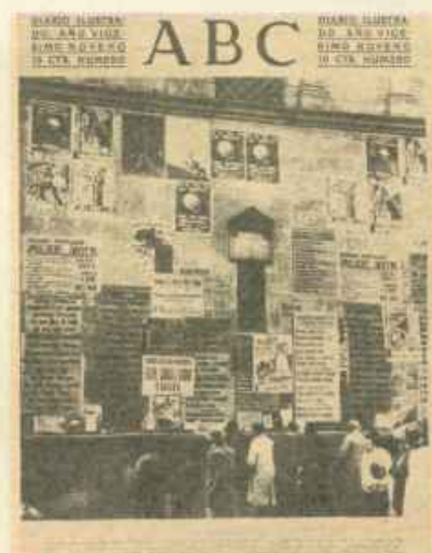
En noviembre de 1933, las elecciones para diputados a Cortes llenan las fachadas con los más contradictorios carteles de propaganda.