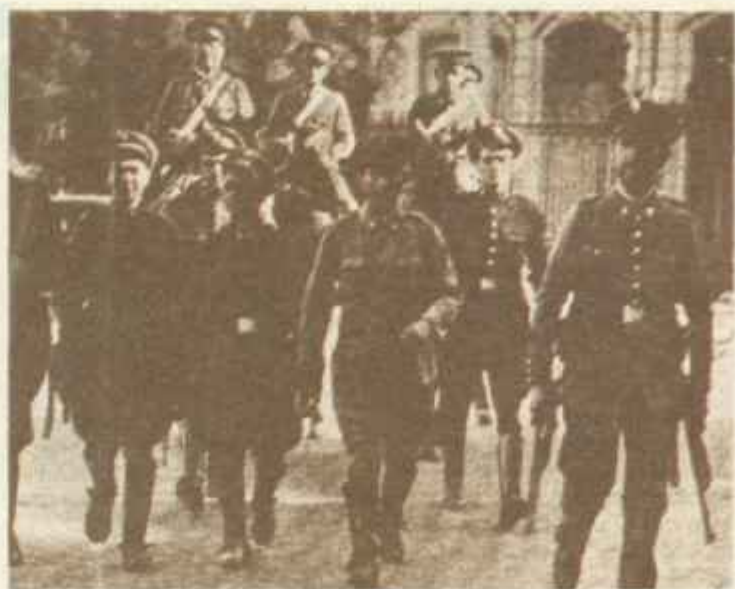
Mientras alboreaba un día caluroso y deslumbrador, los últimos combates se libraban en las calles de Madrid. Cuando despertó el vecindario madrileño la intentona había sido liquidada. Sobre estas líneas, soldados de la remonta detenidos en La Cibeles el día 10.