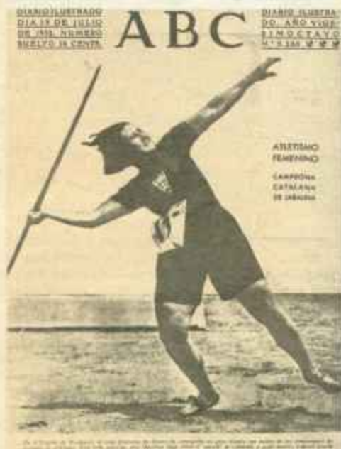
El deporte femenino empieza a triunfar.