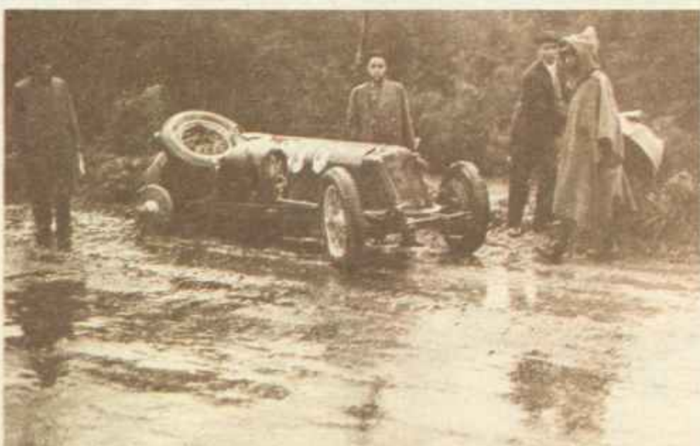
1933. Un accidente impide a Nuvolari ganar el Gran Premio Automovilístico de San Sebastián.