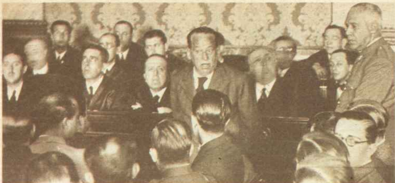
Fracasada la sublevación en Madrid, la resistencia en Sevilla no tenía objeto. Sanjurjo intentó huir a Portugal, pero al fin se entregó a la autoridad gubernamental en Huelva. Sobre estas líneas, el general aparece prestando declaración en el juicio que se siguió a los encartados.