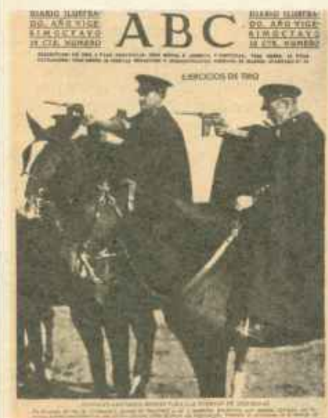
En 1932 se dota de pistolas ametralladoras a las fuerzas de seguridad. Ante la violencia, el Gobierno actuaba con gran dureza.

Cinco Gobiernos había necesitado la República en 1933. Uno, de Azaña, hasta el 8 de junio. Otro gabinete azafista, hasta el 12 de septiembre. Uno, de Lerroux, hasta el 8 de octubre. Uno, de Martínez Barrio, hasta el 16 de diciembre. Y concluía el año con un nuevo Gobierno lerrouxista, con la entrega del proyecto del Estatuto Vasco a las Cortes y con el inesperado fallecimiento, el 25 de diciembre, de don Francisco Maciá, presidente de la Generalidad de Cataluña, que fue sucedido por don Luis Companys. Al trazar un balance del año que se extinguía, Manuel Bueno escribió en ABC: «Yo vislumbro en el horizonte anuncios de guerra civil»... ●