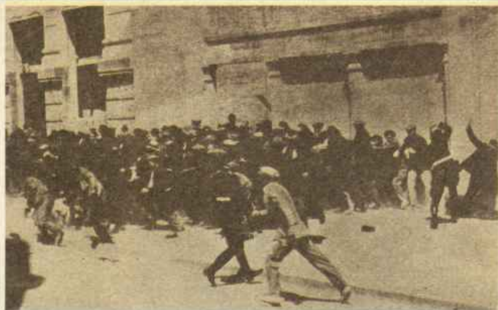
Durante el llamado «bienio negro» de 1932-33, la agitación social alcanzó cotas inimaginables. Esta fotografía está tomada en Valencia el 26 de abril de 1932: los guardias de asalto disuelven una manifestación provocada por la suspensión de un acto político.