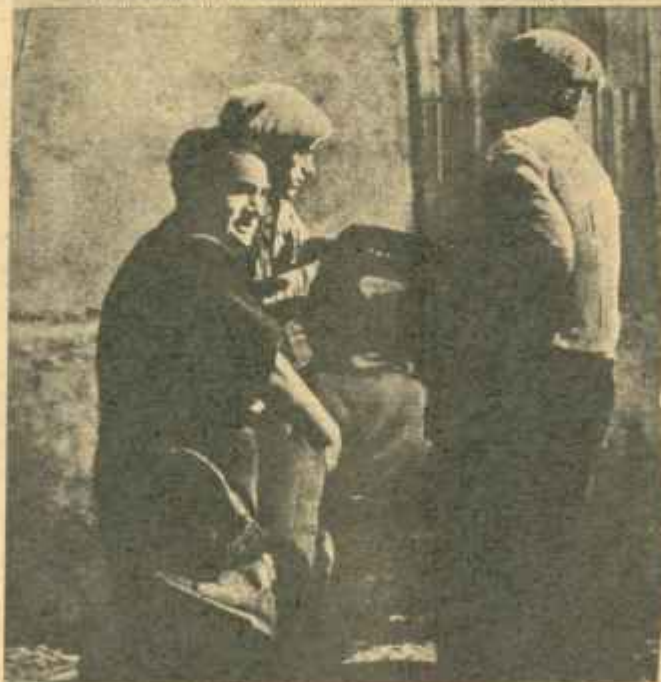
LOS TAMPICOS SUICIDAS DE CASTILBLANCO. El año y las tres guardias civiles que constituyen el puesto de Castilblanco (Badajoz) son bárbaramente asesinados. Esta portada de ABC recoge el momento en que, algunos días más tarde, son retirados los cadáveres de las víctimas.

Del movimiento de rebelión en la provincia de Badajoz.