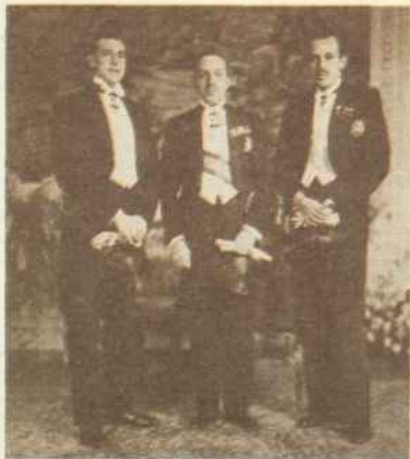
Don Alfonso XIII con sus hijos Don Juan y Don Jaime.

La explícita renuncia del Infante Don Jaime, por sí y por los descendientes que pudiera llegar a tener, a la sucesión al Trono de España, convirtió automáticamente a Don Juan, tercer hijo varón de Don Alfonso XIII, en heredero del legado histórico-dinástico de la Casa Real española. ●