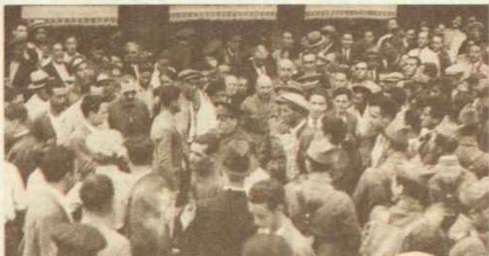
A su paso por las calles de Sevilla, el general Sanjurjo es rodeado por la multitud después de su sublevación en la mañana del día 10. La intentona militar, a pesar de su fracaso, fue el primer toque de atención de un sector importante de la sociedad española que no estaba dispuesta a soportar por más tiempo la ola de violencia de la nueva República.