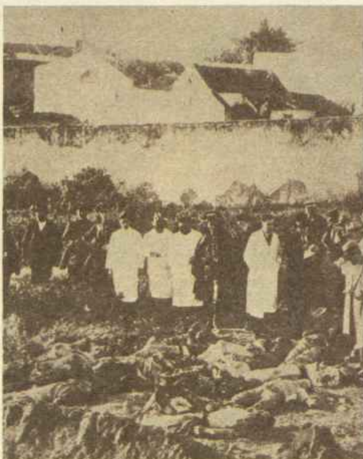
«Ni heridos ni prisioneros, tiros a la barriga». Casas Viejas fue el macabro epílogo a la tristemente famosa frase de Azaña. En la foto los cadáveres de las 16 personas que perecieron en la tragedia.

Mil novecientos treinta y tres alboró con un ambiente de violencia en toda España. El suceso más lamentable de aquella larga letanía se llamó Casas Viejas. Iniciada en la cuenca del Llobregat, con extraordinario ímpetu, estalla una sedición anarcosindicalista en Madrid y provincias. En el pueblo