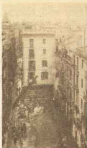
Durante toda la mañana del día de Navidad, el fuego consumió los populares almacenes «El Siglo», de Barcelona.

centado el incendio. La falta de presión del agua a dificultado el servicio de extinción. Se ha derrumbado el edificio de la parte, o sea, la de la calle de Xucía, y se han hundido los cuatro pisos de los almacenes, quedando sólo la fachada de la Rambla. Aunque sigue el incendio, parece localizado, procurando aislarlo de los edificios contiguos, o sea, el Banco Hispano Colonial y Compañía de Tabacos de Filipinas, la Academia de Ciencias y el teatro Poliorama». A las dos y media de la tarde fue sofocado el incendio: de los almacenes «El Siglo» sólo quedaban las paredes maestras. Horas después, pudo hacerse el primer balance provisional de pérdidas: varios bomberos heridos; casi cuarenta millones de pesetas convertidas en humo y alrededor de 8.000 personas quedaron sin trabajo aquella desgraciada Navidad. ●