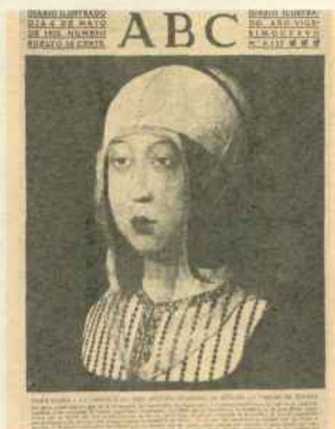
Por medio de esta portada llena de intención, ABC expresaba su repulsa acerca de todo lo que atentase contra la unidad de la Patria.