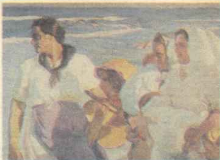
Típica escena de playa pintada por el pincel luminoso de Sorolla. En junio del 32 se inauguró el museo dedicado al artista valenciano y enclavado en la casa que ocupó en Madrid, en Martínez Campos.