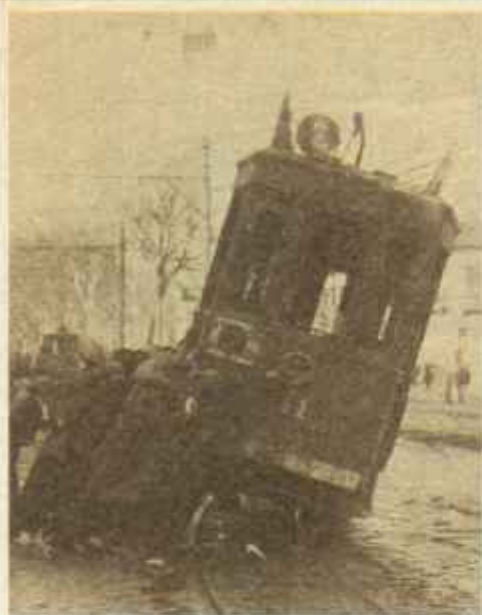
Valencia. Un grupo de manifestantes vuelca un tranvía a la entrada del puerto, en el curso de una huelga general iniciada en 1932.