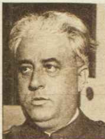
La llegada del teniente coronel Yagüe en un autogiro al cuartel de Pelayo de Oviedo, cuando éste aún era atacado por fuerzas revolucionarias, marca el principio del fin de los sucesos de Asturias. Posteriormente Yagüe marchó a Gijón, estableciendo allí su base de operaciones para reprimir los últimos focos.