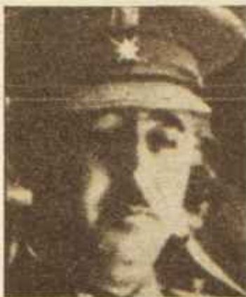
Muchos historiadores consideran especialmente decisiva la intervención de Franco. Desde su despacho del Ministerio de la Guerra organizó la reacción gubernamental contra las insurrecciones de Cataluña y Asturias. Suya fue la decisión de trasladar fuerzas africanas por mar hasta el puerto de Gijón.