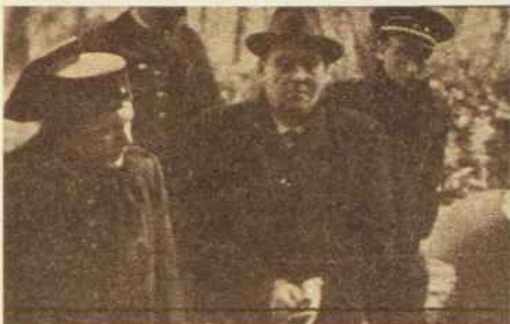
El líder de la U.G.T. Ramón González Peña fue el dirigente supremo de la acción revolucionaria en Asturias. Haciéndose llamar «Generalísimo», tuvo una destacada intervención militar y a punto estuvo de entrar vencedor en Oviedo. La voladura de una caja del Banco de España —episodio de una serie de acciones similares—, apropiándose de quince millones de pesetas, le desacreditó incluso entre algunos sectores de la izquierda. Una vez restablecido el orden fue apresado, juzgado y condenado a muerte. La extrema derecha presionó para que se cumpliera la sentencia, pero el gobierno Lerroux, tras largas deliberaciones, le conmutó la pena.