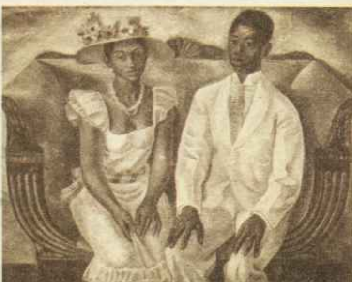
«Elvira y Tiberio», cuadro de Hipólito Hidalgo de Caviedes, que obtuvo el gran premio internacional de pintura del Instituto Carnegie.

Para el crítico de arte de ABC, Antonio Méndez Casal, los balances del bienio 1934 y 1935 son más bien negativos. Su resumen de 1934 comienza con estas palabras: «Mal año para el arte español». En el de 1935 dice: «El año que termina cierra con gran déficit». En ese déficit debe incluirse la muerte del escultor Pablo Gargallo, de quien hizo una exposición póstuma el Museo de Arte Moderno. ●