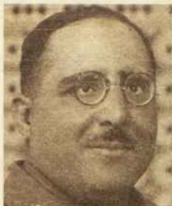
Según el plan de Franco, al coronel Antonio Aranda Mata le correspondió la misión de bloquear con sus destacamentos los puertos asturianos. Dos años más tarde Aranda se convertiría en uno de los héroes del Atzamiento, defendiendo con gran heroísmo y ciencia militar precisamente la ciudad de Oviedo.