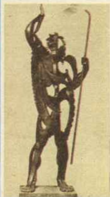
«Gran Profeta», de P. Gargallo.