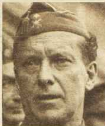
La columna llegada desde Lugo al mando del general Eduardo López Ochoa salvó en los primeros momentos a la ciudad de Oviedo. La guarnición local resistía frente a los revolucionarios, pero nada habría podido hacer sin el apoyo del general republicano quien atravesó media Asturias en un dramático avance.