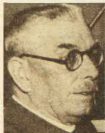
El general republicano y catalán Domingo Batet Mestres, jefe de la división orgánica de Barcelona, animado telefónicamente por Franco, conmina a la rendición a quienes han proclamado el «Estat Catalá», cercando la Generalidad. A las seis y cuarto de la mañana del 7 de octubre la aventura ha terminado.