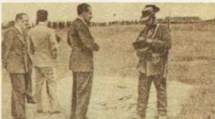
Ante la violencia de la lucha, la Falange organiza sus escuadras. El 3 de junio de 1934 se realiza la primera concentración en Estremera.

pañolista» del 29 de octubre), va extendiéndose entre la juventud de Madrid y de algunas provincias. El 9 de febrero de 1934 es asesinado el estudiante Matías Montero y pocos días después —el 13— se realiza la fusión de la Falange con las Juntas de Ofensiva Nacional Sindicalistas —JONS— de Ramiro Ledesma Ramos. El 4 de marzo la nueva organización celebra un mitin en Valladolid. El 10 de abril José Antonio sufre un atentado y el 3 de junio se realiza la primera concentración de escuadras falangistas en el aeropuerto de Estremera (Madrid): la lucha callejera, con puños, porras y pistolas, causa víctimas entre las juventudes de los diversos partidos. A raíz de esta concentración, se pide el procesamiento de Primo de Rivera, pero la Cámara aprueba la suspensión de toda actividad judicial contra los diputados hasta el término de su mandato electoral.