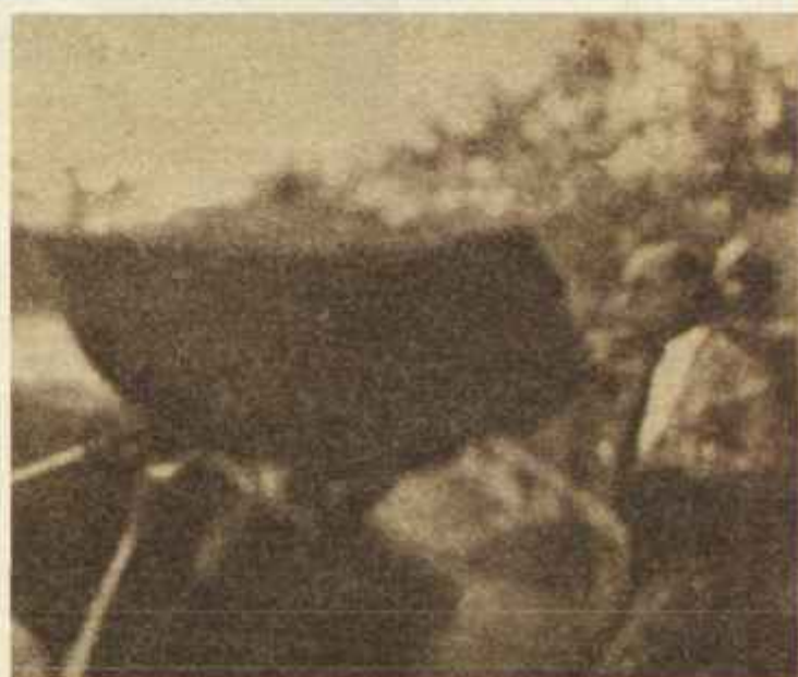
Un documento gráfico de valor excepcional: Ignacio Sánchez Mejías en el pase inmediatamente anterior al de la cogida.

lectual y fuerza creadora. «Su misma inquietud, que no le dejó metodizar su labor, llevándole de una actividad a otra, le trajo nuevamente al toreo... El toreo parecía otro por aquellos días, muy pocos, de Sánchez Mejías, tan pocos que el día 15 de julio asomó por Cádiz con aquella magnífica corrida de Domecq, y el 15 de agosto le dejábamos en el cementerio de Sevilla. ¡Si no parece que ha vuelto al toreo, sino a morir por el toreo! Otra importante efemérides es la inauguración oficial ese 21 de octubre de la Plaza de toros de las Ventas con un cartel de gala: Lalanda, Cagancho y Belmonte. Entre lo ocurrido el año siguiente destaca, a título de curiosidad, el indulto en La Línea, a petición del público, de un toro criado con biberón por Maruja Mora, hija de su propietario. Era el toro «Matador». ●