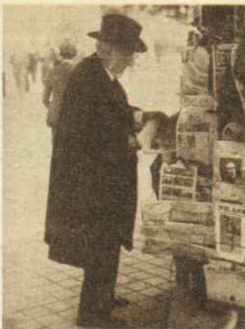
Don Santiago Ramón y Cajal, antes de morir.

neó lo más mínimo. Cuando su nombre se orló con los laureos del Premio Nobel, acogió el galardón huyendo de homenajes y glorificaciones. Para él el mejor premio era un nuevo triunfo en las tenebrosidades del misterio vital.» En su testamento Ramón y Cajal establecía cuatro legados de 25.000 pesetas cada uno, con cuyas rentas deberían premiarse a investigadores y estudiantes que destacaran en el campo de la Medicina. La muerte le sobrevino en su casa de Cuatro Caminos como resultado de una afección intestinal que había arrastrado desde el verano. Pocos días antes de su fallecimiento había terminado de escribir un libro. «España acaba de perder la más alta figura que acrecentó su gloria desde el siglo XIX en la esfera de la ciencia médica», terminaba ABC. ●