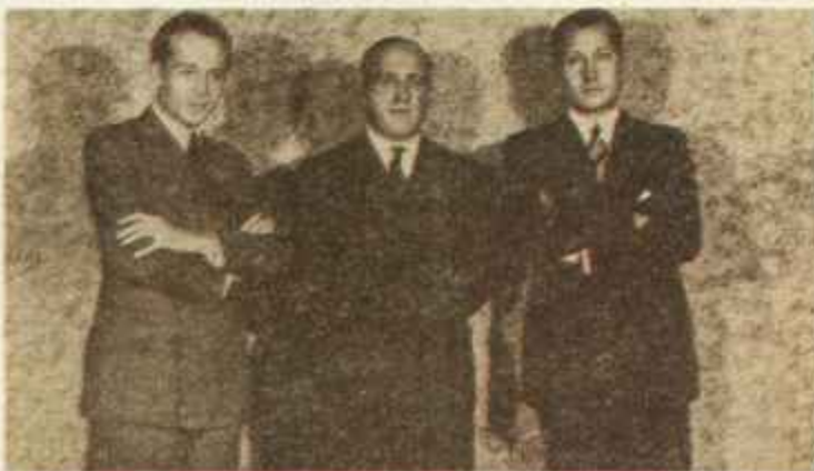
García Valdecasas, Ruiz de Alda y Primo de Rivera, los tres oradores (con camisa blanca y corbata) del mitin del 29 de octubre de 1933.

Este es el punto de partida. Poco a poco, Falange Española (nombre que propuso Ruiz de Alda, a la salida del «mitin de afirmación es-