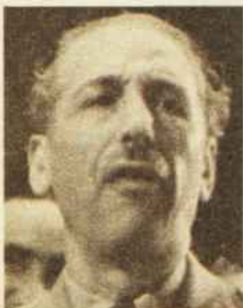
El sábado 6 de octubre, a las ocho de la noche, Luis Companys, presidente de la Generalidad de Cataluña, proclamó el «Estado Catalán dentro de la República Federal Española». Antes de llegar a esta decisión Companys estuvo sometido a múltiples presiones; sin embargo, su criatura política apenas tendrá una noche de vida.