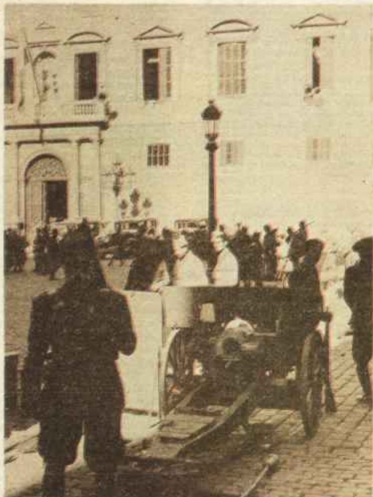
Octubre de 1934: proclamación del «Estado Catalán». La artillería dispara contra el edificio de la Generalidad y sofoca la revuelta.