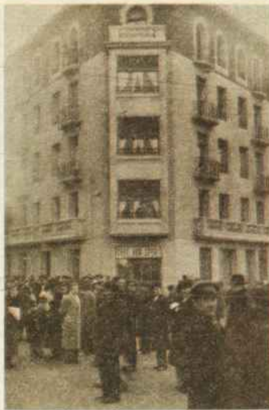
Esta era la casa desde la que el duende dejaba oír su voz. Junto a ella el público espera las noticias.