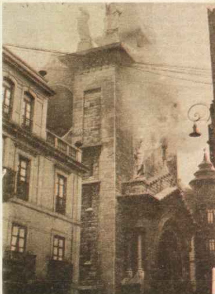
Por esas mismas fechas, todo el país sufre una ola de huelgas, principalmente el Norte. En Asturias estalla una sangrienta revolución.