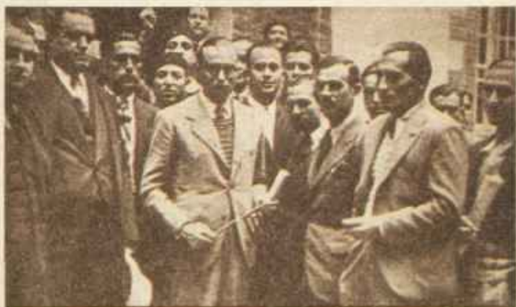
El doctor Dencás —en el centro de la foto— y Badía —a la derecha—, ministro del Interior y jefe de la Policía de la Generalidad, están considerados como los dos principales instigadores de la rebelión. Dencás, definido por Ricardo de la Cierva como «precursor de los pequeños fascismos separatistas europeos», había accedido a su cargo de la mano de Companys tras la muerte de Maciá. Desde entonces su influencia en las decisiones del presidente fue enorme. Ya rendida la Generalidad, mientras su gobierno pasa a la cárcel y se busca intensamente a Manuel Azaña, Dencás y Badía logran huir a través de los alcantarillados de la ciudad.