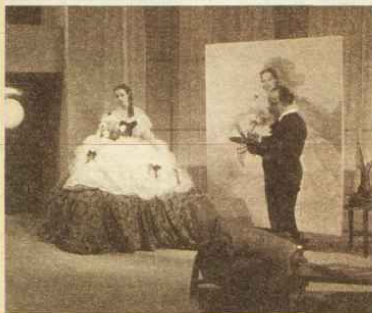
Maruchi Fresno, «primera estrella del cine español en 1934», según escribía ABC, en una escena de «El agua en el suelo», de Ardavin.