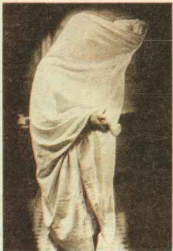
Un fotógrafo de Zaragoza hizo este divertido «retrato» del duende, recogido por ABC el 28 de noviembre de 1934.