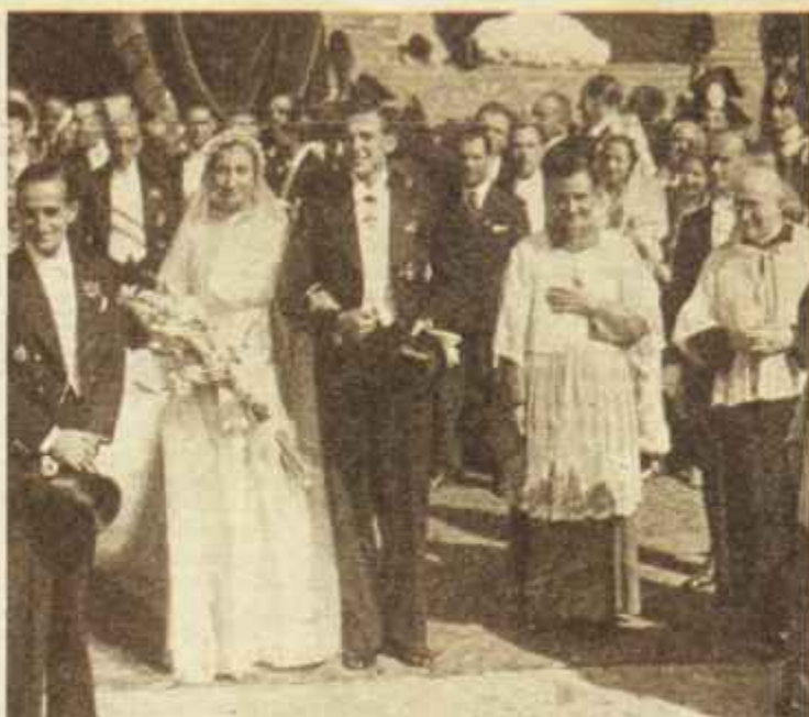
Roma: boda del Príncipe Don Juan y Doña María de las Mercedes.

Eterna fue, asimismo, escenario solemne del enlace contraído el 12 de octubre por el Príncipe Don Juan, heredero de Alfonso XIII, con Su Alteza Real la Princesa Doña María de las Mercedes de Borbón-Dos Sicilias y Orleáns. A pesar de las dificultades y la inestabilidad política, más de seis millares de españoles se desplazaron a la capital italiana para asistir al acontecimiento y vitorear a los contrayentes, expresando su incondicional adhesión al Rey en el destierro. Terminada la ceremonia nupcial, que se celebró en la basílica de Santa María de los Angeles, los Príncipes de Asturias fueron recibidos en audiencia privada por Su Santidad el Papa. Sometido a censura rigurosa, ABC no pudo más que dedicar una portada a los novios y publicar una información, exenta de comentarios. ●