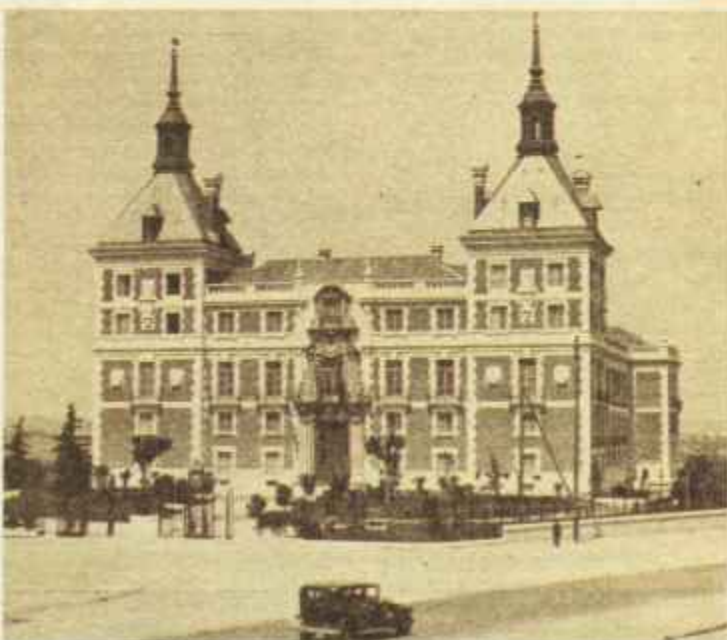
Vista de la Casa de Velázquez, el año en que terminó su construcción.

A lo largo de el bienio 1934-35, los poetas de la llamada «Generación del 27» escriben algunas de sus obras más fundamentales: en 1934, Pedro Salinas publica «La voz a ti debida», y, al año siguiente, Federico García Lorca, el «Llanto por la muerte de Ignacio Sánchez Mejías»; Rafael Alberti, «Verte y no verte», y Luis Rosales, «Abril». ●