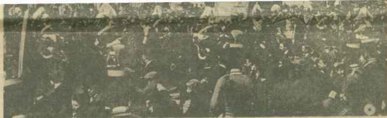
Alfonso XIII visita Barcelona acompañado de don Antonio Maura, en abril de 1904

El gest d'alguns regidors regionalistes i el meu discurs al Rei a què donà lloc, tingueren immensa resonancia i rebren un aplaudiment gairebé unànim. Els catalans sentiren la satisfacció i l'orgull de veure que ni en aquells moments