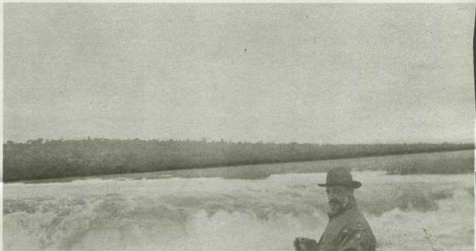
Cambó davant les catarates d'Iguazú, l'any 1924.

Enric Ucelay-Da Cal és catedràtic d'Història Contemporània de la Universitat Autònoma de Barcelona.