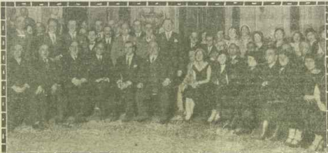
Recepción celebrada en el Ayuntamiento de Madrid en honor de los delegados del II Congreso Nacional de la Madera.

A continuación el presidente electo, que lo habla sido elegido por unanimidad, dió las gracias, en nombre de la nueva Junta, por su nombramiento, haciendo un resumen de la labor a realizar.