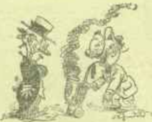
Convierte en pipa un boch de cerveza. (Lustige Satir, Leipzig)