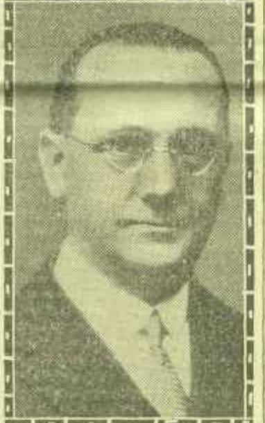
El Sr. Giralt, nuevo ministro de Marina.