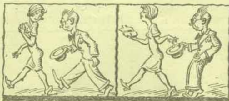
Manera de deshacerse de un perseguidor enamorado. (Lustige Satir, Leipzig)