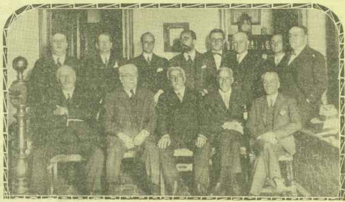
El nuevo Gobierno y el presidente de la Cámara, Sr. Besteiro, reunidos en el domicilio del Sr. Alcalá Zamora.

tituyen...", mientras con una sonrisa parecía expresar: "No; ahora, no. Ahora la cosa iba demasiado en serio para que yo dimitiera." Es grande.