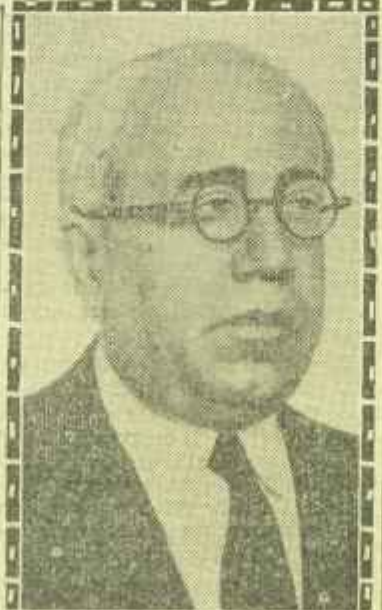
El Sr. Azaña, nuevo jefe del Gobierno.