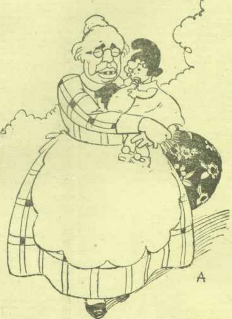
—Cuidemos a la niña con esmero, no sea que también a mí me despidan..., muy afectuosamente, los nuevos amos.