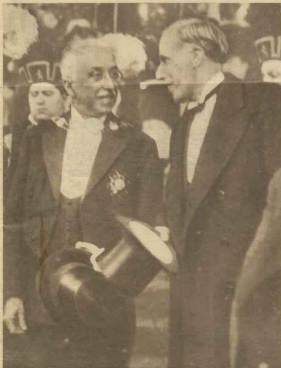
Terminada la solemne ceremonia de la promesa a la Constitución, el Jefe del Estado, que ostenta el gran collar de Isabel la Católica, se dirige, con el presidente del Congreso, señor Besteiro, hacia la carretela que les conducirá a Palacio.