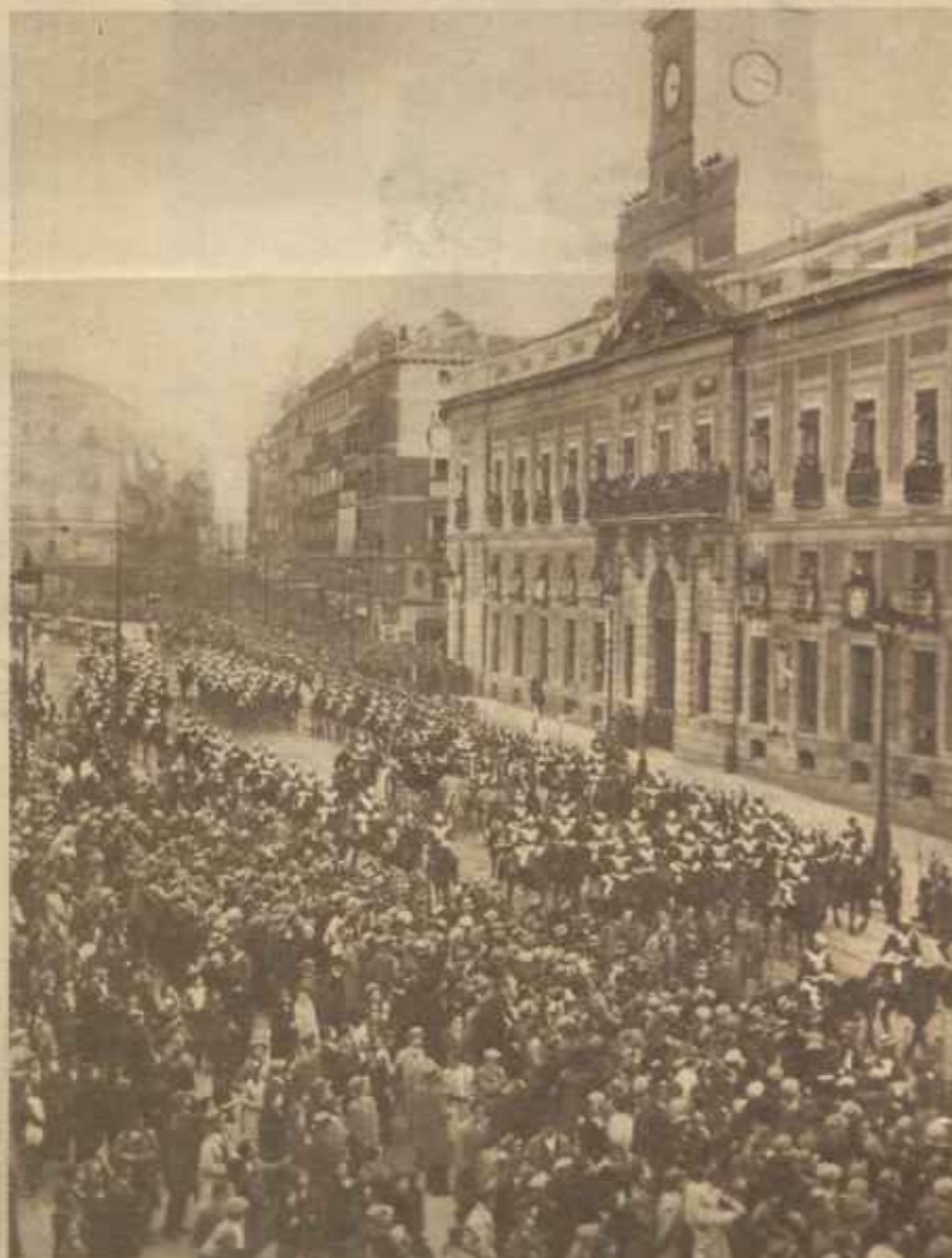
El cortejo presidencial a su paso por la Puerta del Sol. En el centro de la cordova se ve el coche ocupado por el Presidente de la República y por el de las Cortes constituyentes. Rodean a la carretela las fuerzas de la escolta del Jefe del Estado.