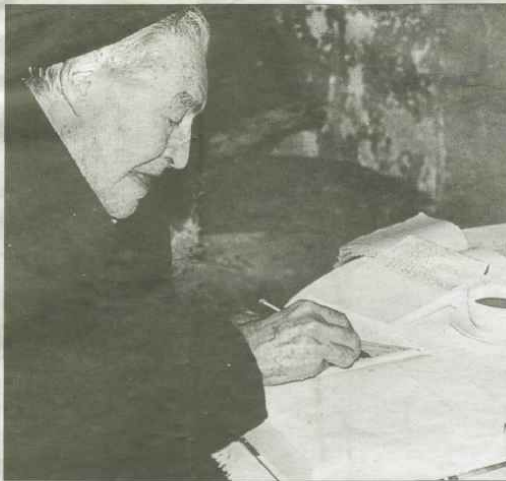
L'escriptor Josep Pla.

tre món una mica difonent al que passen i expliquen els llibres d'història.