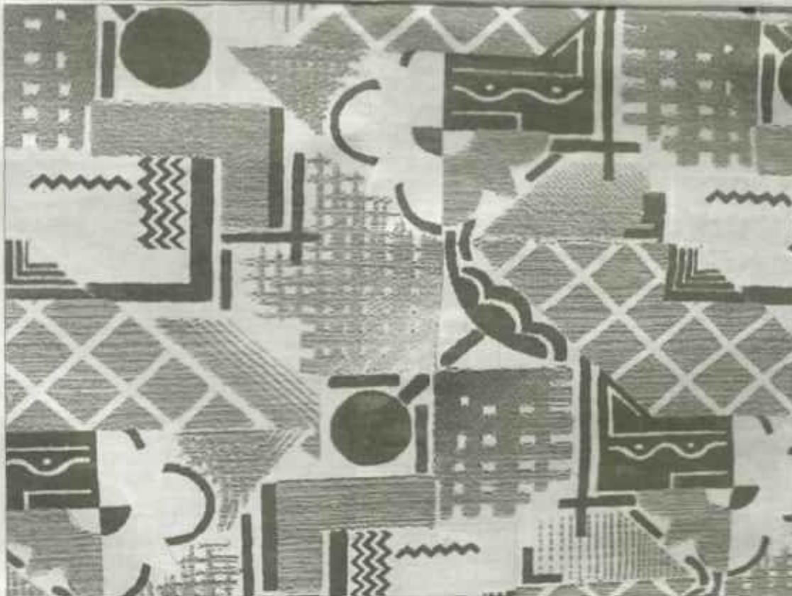
Vellut de fabricació catalana, ca. 1931.