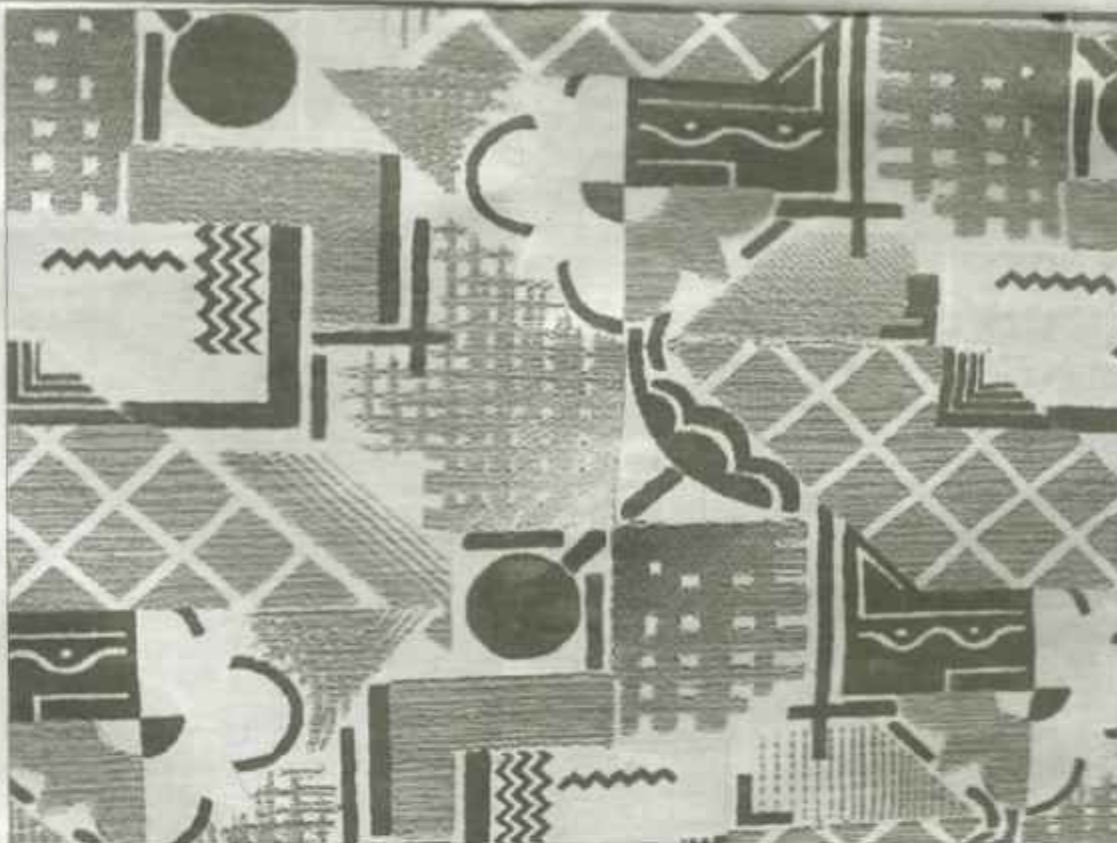
Vellut de fabricació catalana, ca. 1931.