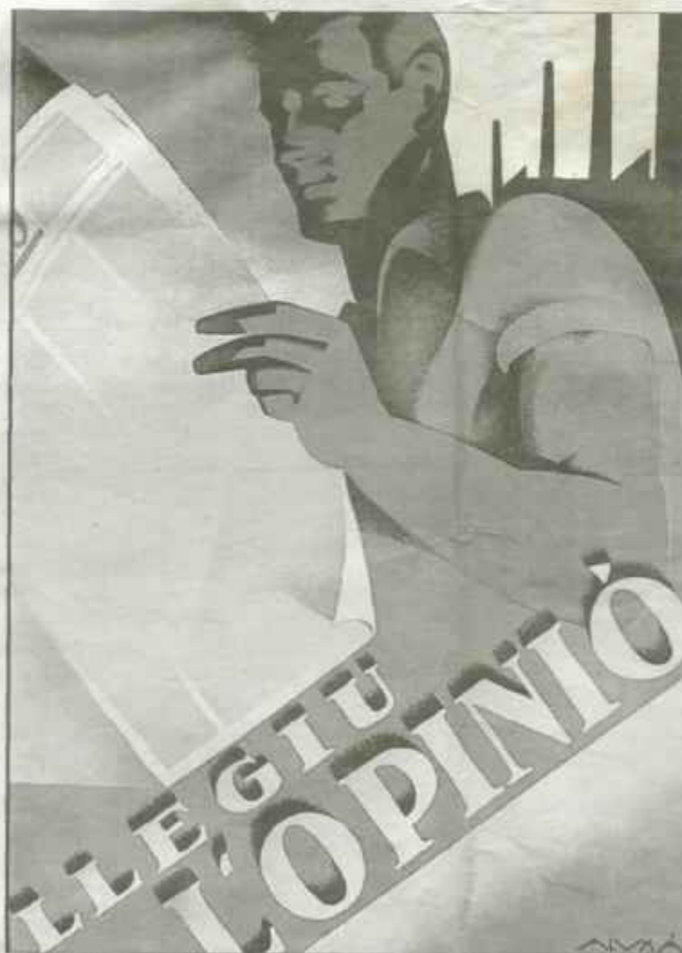
Cartel publicitari fet per Josep Alomà entre 1932 i 1936.

salva. El mobiliari espanyol —i tan català!— de les cases bones, amb talles, cuirs i quixots, va donar pas als confortables entapissats amb velluts cubistes , les estores llistades, i el mobiliari de dentista, tal com Luis Cernuda anomenava les cadires i butaques de tub cromat estil Bauhaus que van envair menjadors, salons i galeries a l'època republicana. Fins i tot Cambó va encarregar un projecte de xalet funcional al seu arquitecte de capçalera, Adolf Florensa. La platja i la piscina es van posar definitivament de moda, i una ullada de sol revifava el país. El GATPAC col·laborava amb el govern de la Generalitat i es propagava arreu amb la revista AC : l'arquitectura dels noucentistes també es renovava seguint l'eufòria. La revista D'Ací i d'Allà canviava de pell per convertir-se en la més rabiosament moderna de la història, amb format quadrat i espiral de bloc, gràcies a Josep Sala, pintor de toreros i manóles, professor de ball i un dels millors grafistes i fotògrafs publicitaris del segle XX català, tal com encertadament reivindicava Enric Satué. Però aquesta mateixa plataforma de flamant paper couché , enmig dels anuncis de