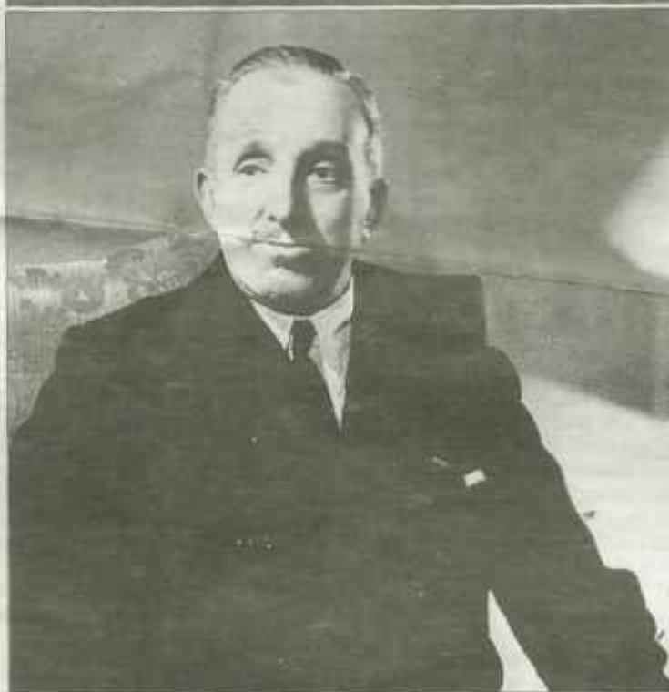
Adalt, Francesc Cambó. A sota, el rei Alfons XIII.

seva actuació durant la Dictadura, i que ell li va retreure el seu comportament polític, el va advertir de la seva gran impopularitat, es va descartar com a possible president del govern, a causa de la seva salut, i va defensar la candidatura de Santiago Alba com la millor. A més, Cambó va plantejar al rei que la solució del plet català, amb la recuperació del projecte d'Estatut de 1918, era una condició prèvia perquè ell entrés en un govern algun dia. Igualment comenta que va renyar el monarca pel seu menyspreu a l'ús del català, la seva provocadora reivindicació de la figura de Felip V i "el otorgamiento real de títulos y mercedes a catalanes que no tenían más méritos que ser traïdores a su tierra". En aquest document també s'informa d'un episodi que tampoc surt a les seves memòries, ni a les seves biografies: en el curs d'una altra entrevista amb el rei, celebrada l'11 de febrer de 1931, Cambó explica que va trobar el monarca "amargado y decepcio-