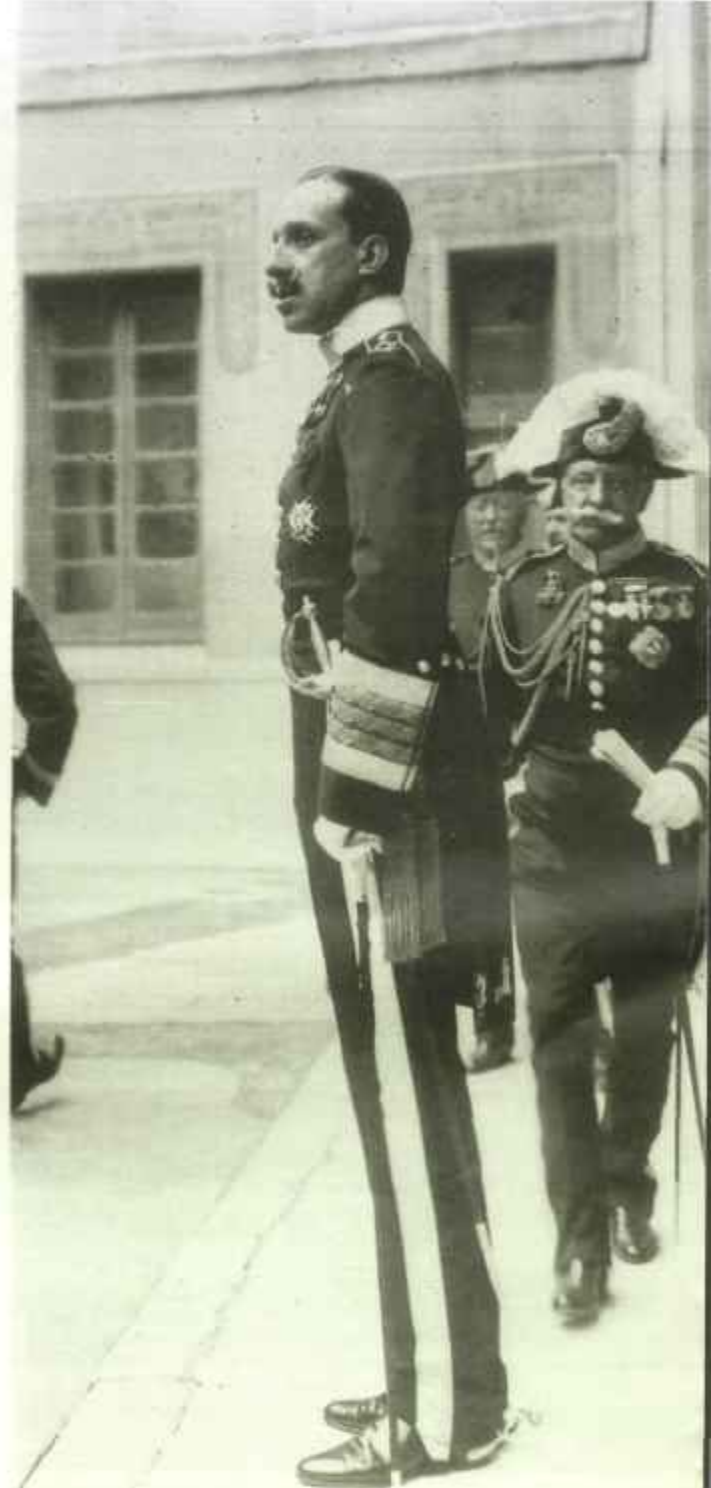
Alfonso XIII con el uniforme de Comandante general del Cuerpo de Alabarderos, durante un acto en el cuartel de esta unidad militar, encargada de la custodia de la Familia Real en el interior de Palacio.

Termina la guerra de Marruecos, pesadilla de las madres españolas a lo largo de muchos años. Y un día la muerte entra en Palacio. Es el 6 de febrero de 1929. Doña María Cristina, la Reina Madre, tras de la cena familiar y una sesión de cine, se ha retirado a sus habitaciones. Siente de pronto un dolor en el costado, mas no le da excesiva importancia y no quiere que se avise a nadie.