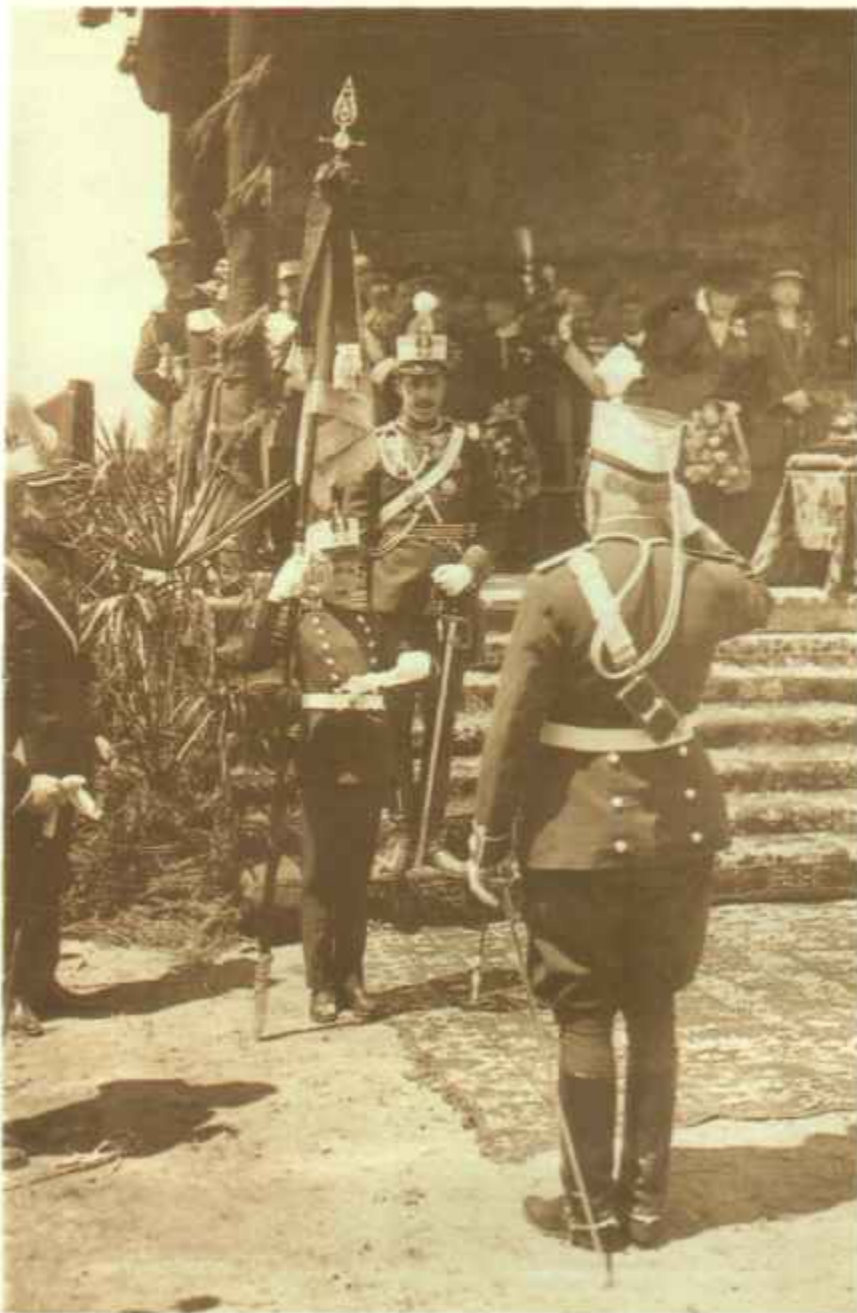
En un acto militar celebrado en Guadalajara es entregado un estandarte al regimiento de Aerostación. Y es el Infante don Juan de Borbón quien lee ante su padre y los mandos del regimiento la fórmula de ofrecimiento de la enseña a la citada unidad militar.