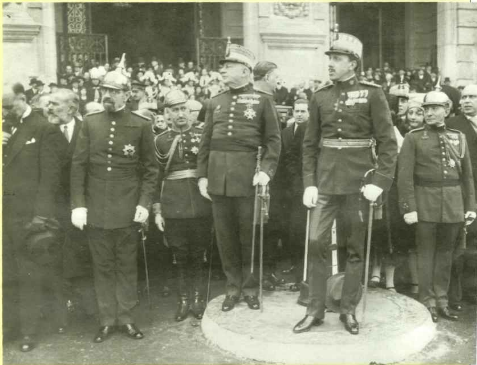
El general Primo de Rivera ha resuelto definitivamente el problema de Marruecos. Ha terminado la guerra que durante muchos años fue trágica pesadilla de España. El Rey se retrata junto al Jefe de su Gobierno durante uno de los frecuentes desplazamientos del monarca a Barcelona.

José Antonio Primo de Rivera, que es abogado y cuenta ahora veintiséis años.