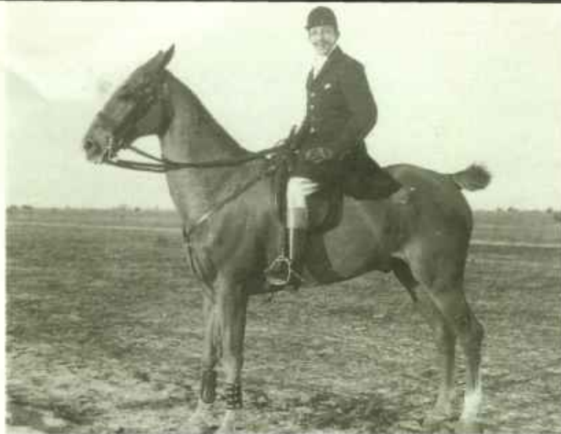
Fue un gran deportista. No se limitó a ejercer algunos deportes, sino que impulsó y alentó actividades diversas de ese carácter. Tuvo algunos caballos de carreras, de los que el más popular fue «Rubán», que ganó algunos importantes trofeos hípicos.