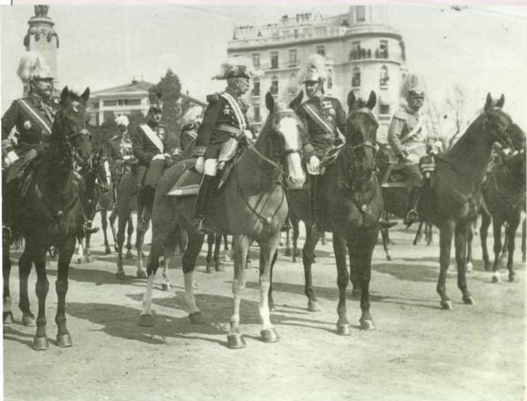
El Rey preside la solemne ceremonia militar de una Jura de Banderas en Madrid. A su lado está el mariscal Liautey, una de las más destacadas figuras de la historia castrense de Francia.

regalado al duque de Aliaga, padre político del duque de Alba.