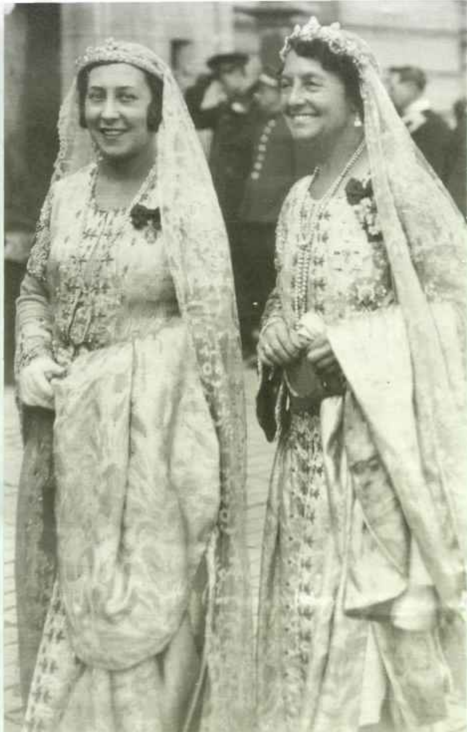
Se celebra en la Semana Santa de 1931 la última capilla pública en el Palacio real. Uniformes, trajes de gala, mantillas, diademas. He aquí dos de las damas que asistieron a esa última ceremonia religiosa en el palacio de Oriente.

La discusión es cortada por el Rey. Alega que no quiere que por él se vierta una sola gota de sangre. Y lee el mensaje de despedida a España que unas horas antes había encargado al duque de Maura. Hace en él alguna rectificación.