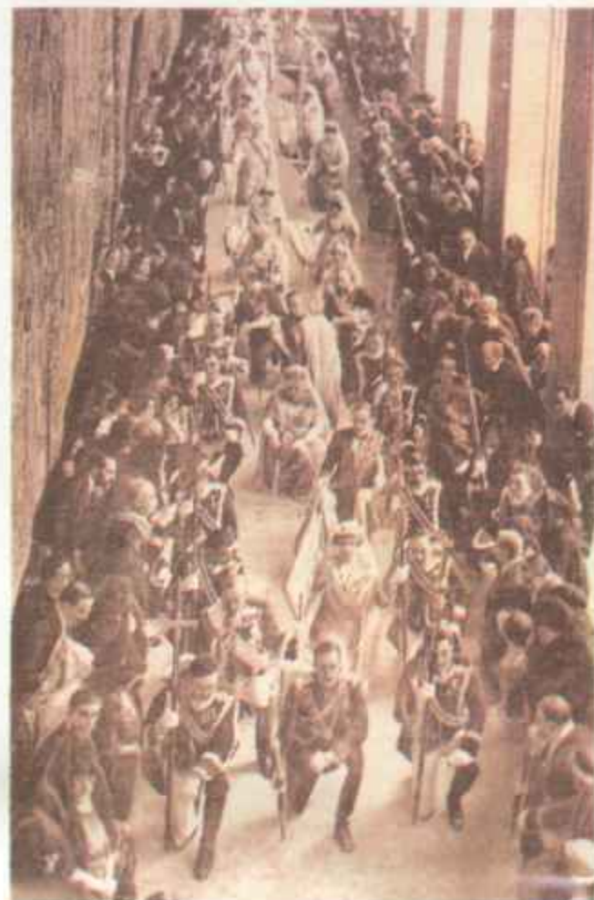
Las fiestas religiosas se celebraban solemnemente en el Palacio real. He aquí una galería del regio alcázar durante una de esas festividades. En primer término, arrodillado, el Rey, y tras de él, la Reina doña Victoria Eugenia.