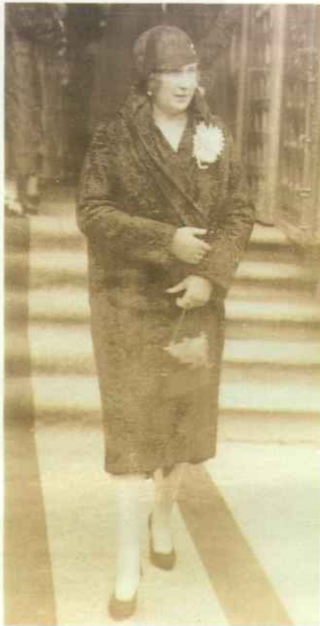
Doña Victoria Eugenia, al salir de la madrileña iglesia de las Calatravas, tras una misa celebrada en sufragio de las damas fallecidas del Ropero, que llevaba el nombre de la Reina de España.