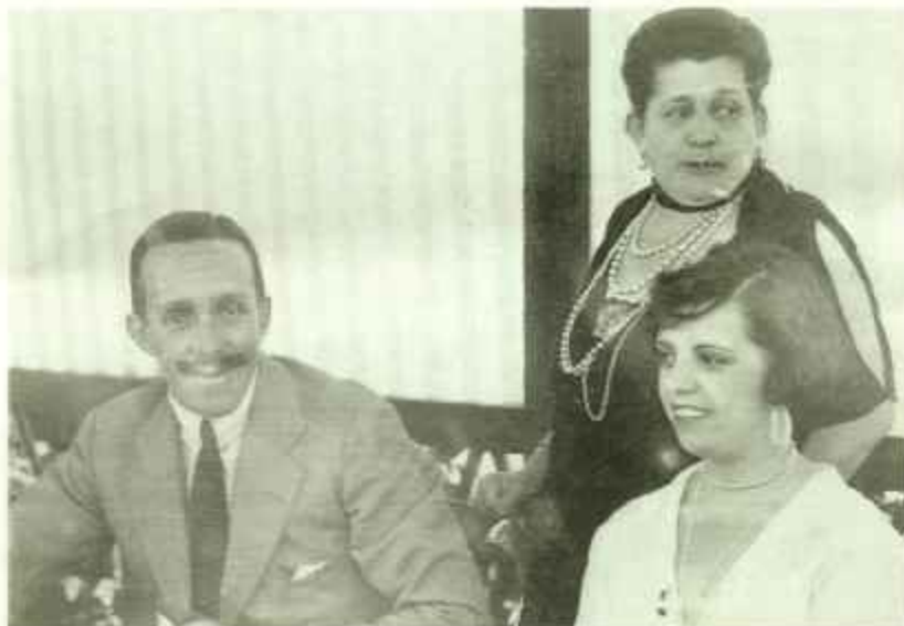
Contaba el monarca -aparte de las lógicas relaciones de carácter oficial y político- con personas unidas a él por entrañable y auténtica devoción personal. Entre ellas figuraron los marqueses de Argüelles, leales siempre a don Alfonso. Se ve a éste, en la fotografía, con la marquesa de aquel título y su hija.

ciudad el envío de este telegrama a Londres y a París: «Día 6 de enero en Sevilla; veinticinco grados, cielo intensamente azul. Aparecen las golondrinas.»