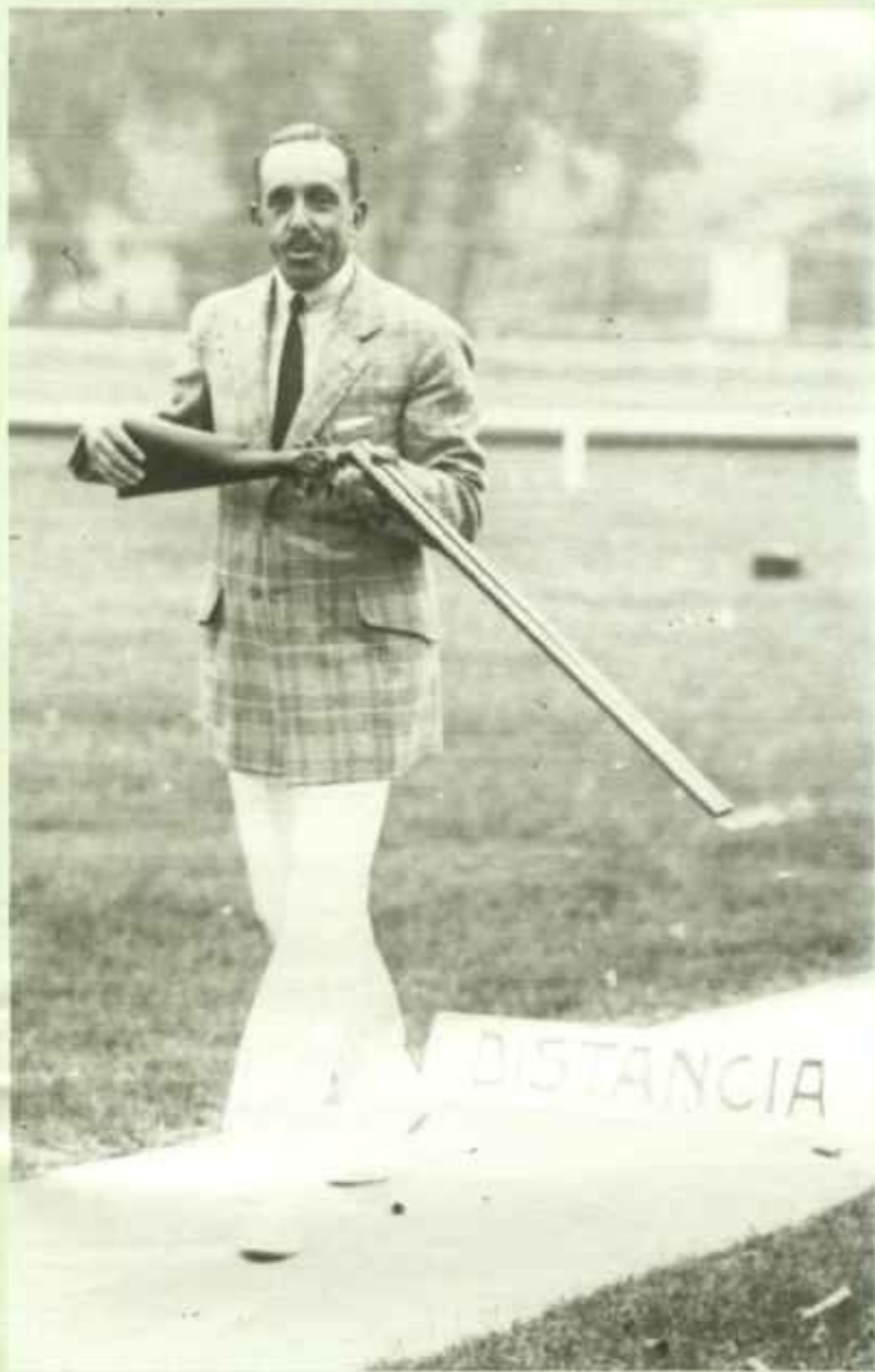
Fue Alfonso XIII un extraordinario cazador. («Era una escopeta fuera de series», dirá su hijo don Juan de Borbón). Otras actividades deportivas fueron también cultivadas por él, como el polo, el automóvil, la navegación a vela.