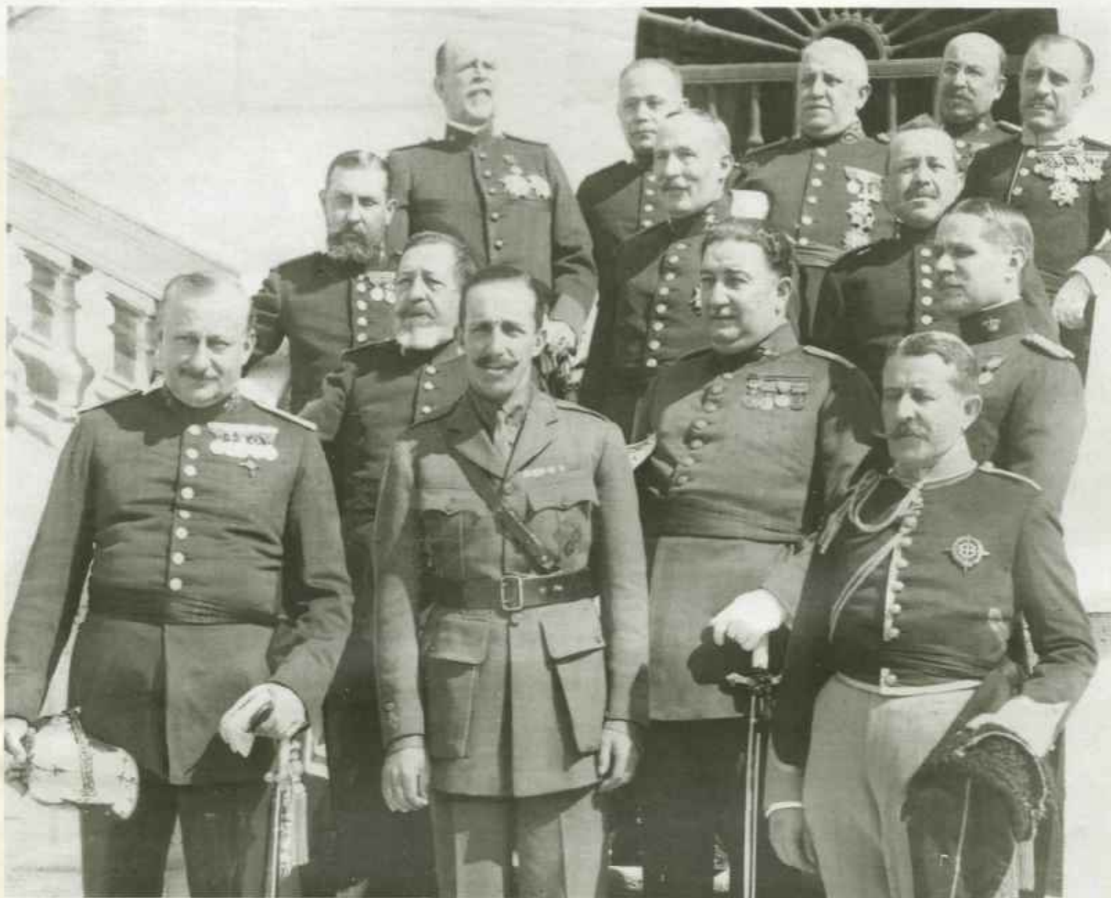
El Rey y don Miguel Primo de Rivera con los generales que formaron el Directorio militar, constituido tras la jornada del 13 de septiembre. «Era inevitable —comenta don Antonio Maura—, es el natural desemboque de una política suicida que se debió enmendar.»