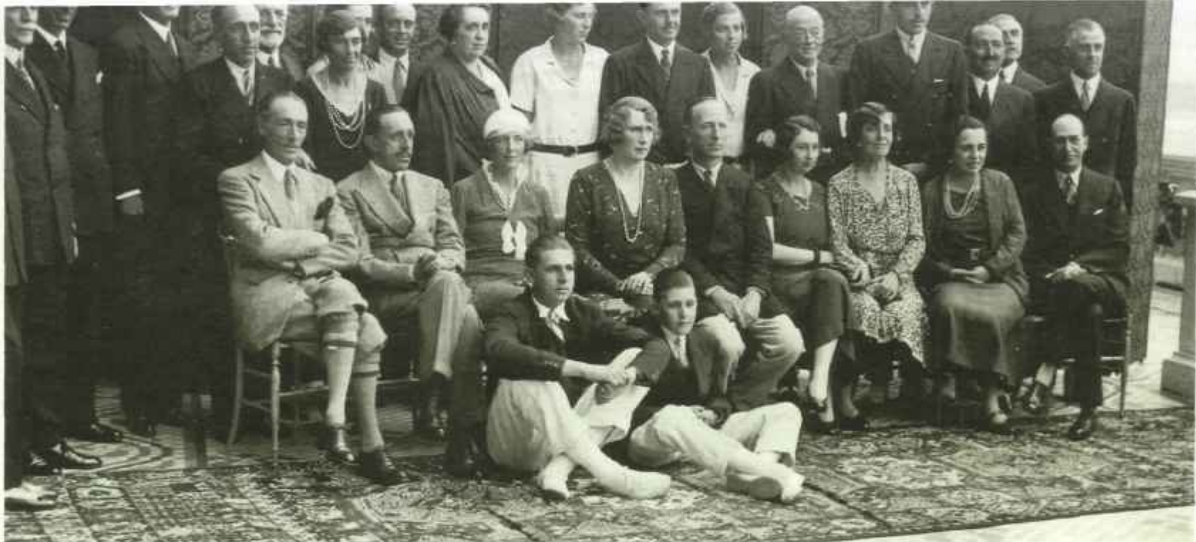
Los Reyes, al acabar la temporada de estío en Santander, se han retratado con el alto personal palatino en la Magdalena. Sentado junto a don Alfonso XIII, el duque de Alba, tan ligado siempre a la institución monárquica. Sentados en el suelo, los hijos menores de los Reyes, los Infantes don Juan y don Gonzalo de Borbón.