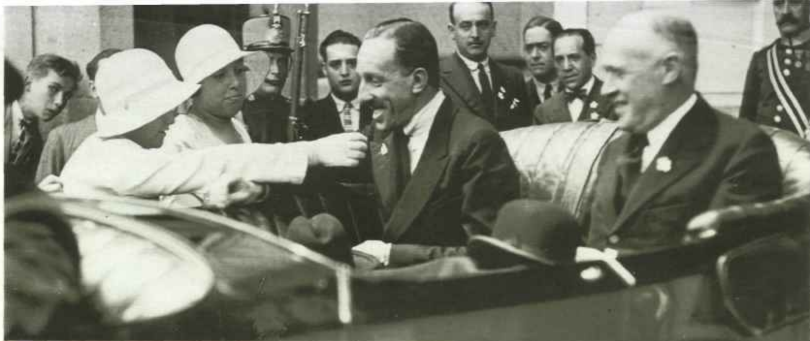
La Fiesta de la Flor. Y, como siempre, la sonrisa del Rey. Una sonrisa bajo la cual, muchas veces, se disimulan y esconden inquietudes y preocupaciones por los problemas de la vida política española.