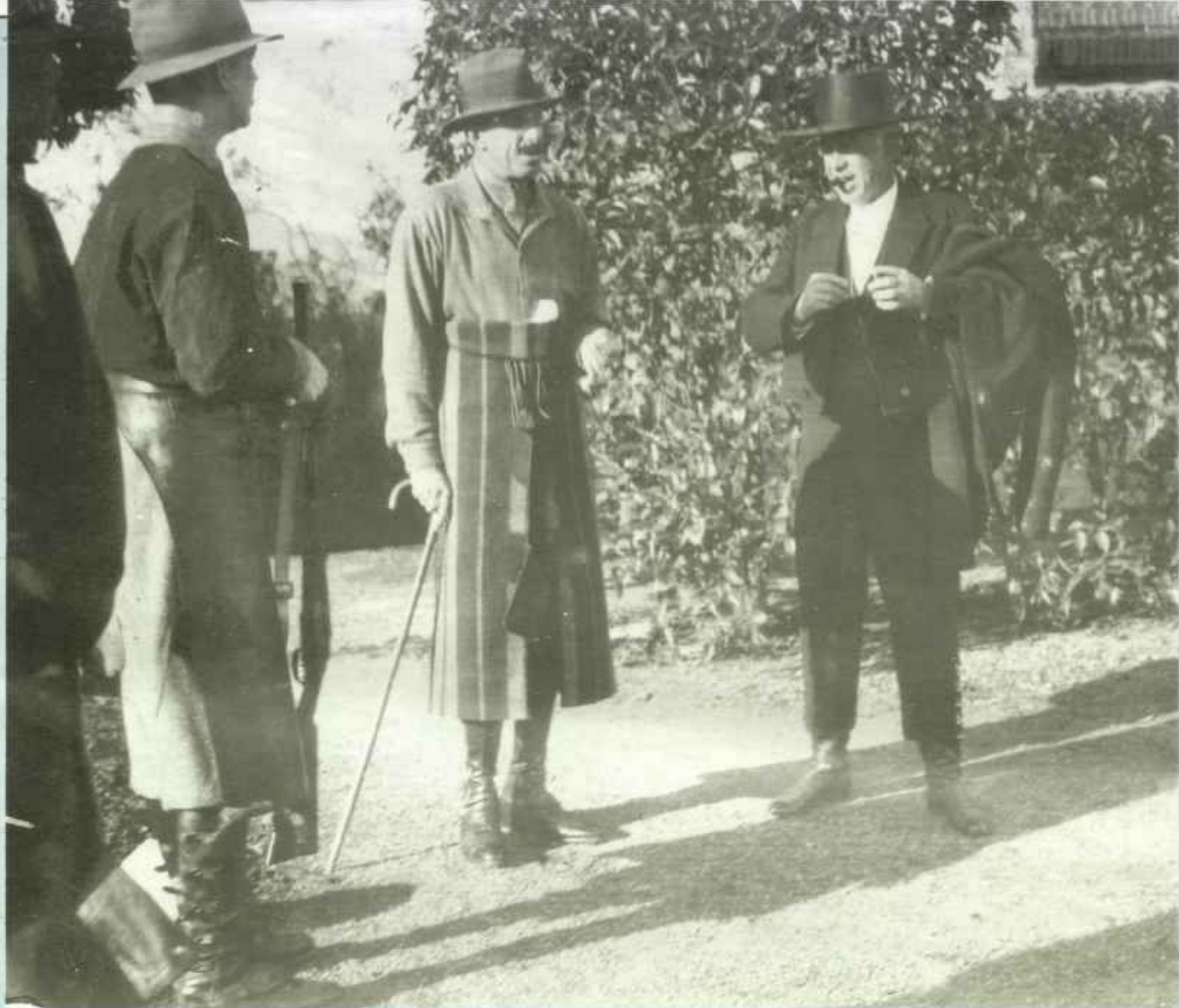
Don Alfonso XIII con Rafael Guerra «Guerritas», en una finca de Córdoba. Gustaba el monarca de la conversación pintoresca del veterano torero, esmaltada de recuerdos curiosos de una larga vida rica en anécdotas y episodios.

útil alguna vez en algo, le daré mi tarjeta.