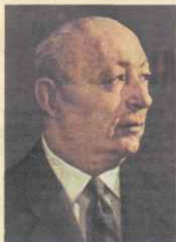
Juan Ignacio Luca de Tena.

E L ambiente de un hotel londinense, ni tan modesto que pueda desentonar con la categoría del huésped egregio que lo habita, ni tan excesivamente lujoso que lo asemeje a esos grandes palacios cosmopolitas llenos de ruidos, en los que bañan de madrugada todos los rastacueros de Europa y donde se hospedan los americanos del Norte. Es un hotel señorial, silencioso, sin orquestas de jazz, y en cuyo hall, de una noble sencillez británica, las conversaciones se deslizan a media voz. En este hall, desde las diez de la noche, espero treinta minutos con impaciencia no exenta de emoción. Subo poco antes de la hora que el Señor se ha dignado fijar para recibirme. Al final del tramo de escalera correspondiente al segundo piso hay un largo pasillo blanco y estrecho, con puertas numeradas. Me parece desierto. Voy a una audiencia en la que ya no hay que pasar por guardias alabarderos, gentiles-hombres ni ayudantes de servicio. Junto a una de las puertas numeradas, ante la que me detengo indeciso, surge un pequeño botones del hotel, que, después de enterarse de mi nombre, me dice con la misma sonrisa amable que hubiera usado hace algunas semanas un grande de España: