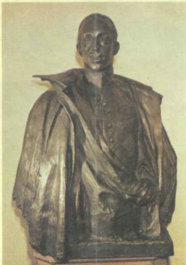
Alfonso XIII, por Mariano Benlliure.

—¡Es triste...! —dice, al fin—. Yo he salido de España, después de redactar ese documento, pensando precisamente en evitar una guerra civil. Las elecciones municipales, jurídicamente consideradas, tienen un simple alcance administrativo; pero yo me di cuenta de que, tanto los republicanos como los monárquicos, les habían concedido importancia plebiscitaria, y por eso tomé la resolución de irme, en prueba de mi respeto a la voluntad nacional, inclinándome ante ella y rechazando los ofrecimientos que se me hacían para constituir un Gobierno de fuerza que mantuviese el orden público hasta que se celebrasen las elecciones de Cortes. Considero que contra el sufragio del pueblo no podía defenderse a tiros la Monarquía, como se reprime un foco de rebelión militar. Salí de España respetando su voluntad, pero por la mía, ya que nadie tiene derecho a exigirme descender de mi trono mientras las Cortes no proclaman la República. Las elecciones municipales podrán haber expresado la voluntad de la nación, pero su soberanía corresponde al Parlamento. Ya sabes por qué me marché: para evitar la sangre en las calles. Y ya sabes, también, por qué no abdiqué: mis derechos a la Corona de España pertenecen a mis antepasados y a mis descen-