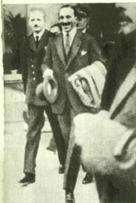
Don Alfonso a su llegada a Marsella, primera tierra extranjera que pisó en su exilio