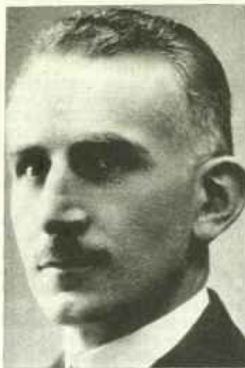
Angel Herrera Oria en la década de los treinta

lo más importante, interesante y bien planteado que desde mi salida de España ha llegado hasta mí. Contad con mi apoyo decidido desde luego y esperad mi llamada, para que, después de reflexionar y asesorarme, concretemos más sobre la materia.»