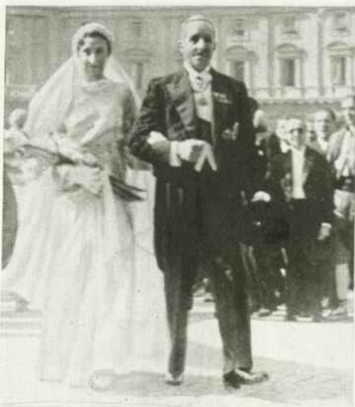
Roma, 12 de octubre de 1935. Boda del conde de Barcelona. la novia, del brazo de Alfonso XIII. Fue la gran fiesta de la monarquía exiliada