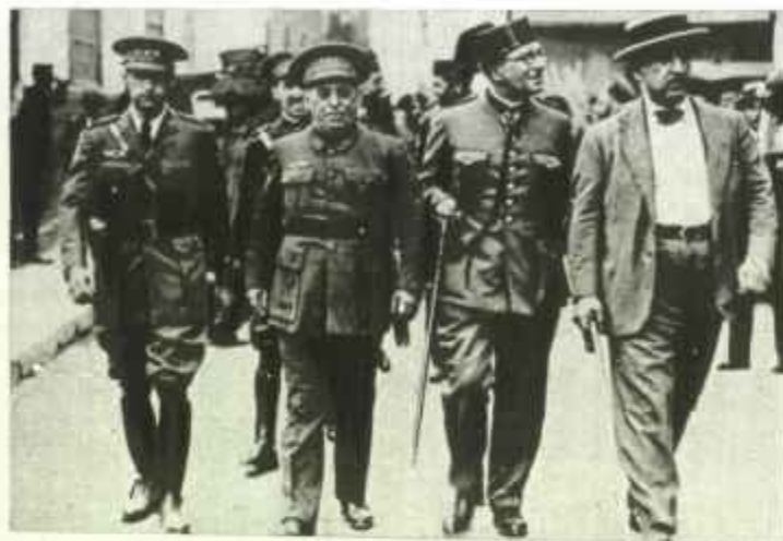
Sanjurjo en Sevilla, el 10 de agosto de 1932. Su sublevación fue una manifestación del descontento militar por las reformas de Azaña.

Dos líderes de las derechas españolas durante la República: arriba, José María Gil Robles, jefe de la CEDA, hablando en el Teatro Pereda de Santander (agosto 1935); abajo, Antonio Golcochea, destacada figura de Renovación Española, durante un mitin (septiembre de 1934).