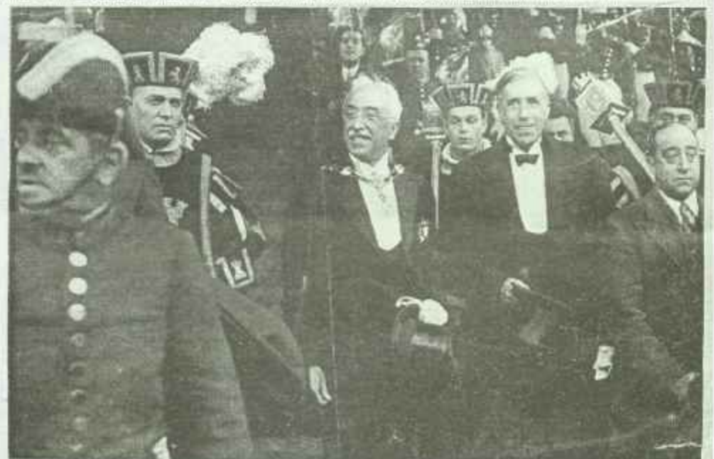
Terminada la ceremonia de la promesa, el jefe del Estado, acompañado del presidente de las Cortes, señor Besteiro, sale del edificio para escapar al coche en que se trasladará al Alcazar. Don Niceto Alcalá-Zamora, ya con el collar de Isabel la Católica, que le ha sido impuesto.