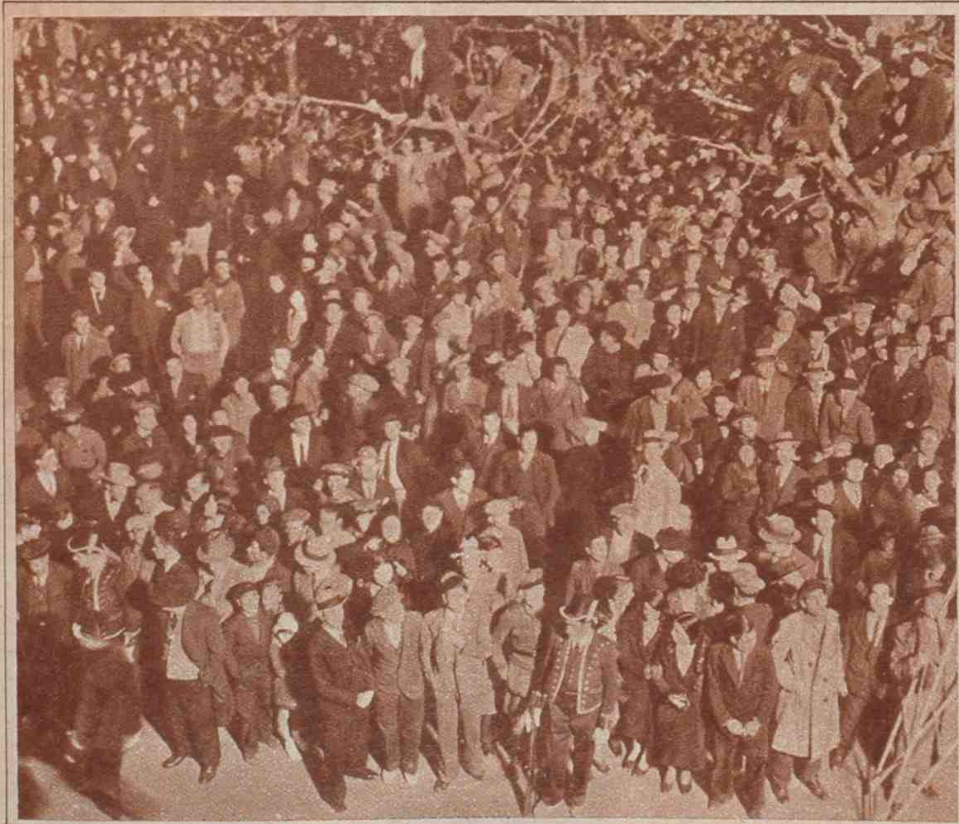
El público, estacionado frente al Parlamento, esperando la salida de los representantes de Cataluña de la sesión preparatoria.