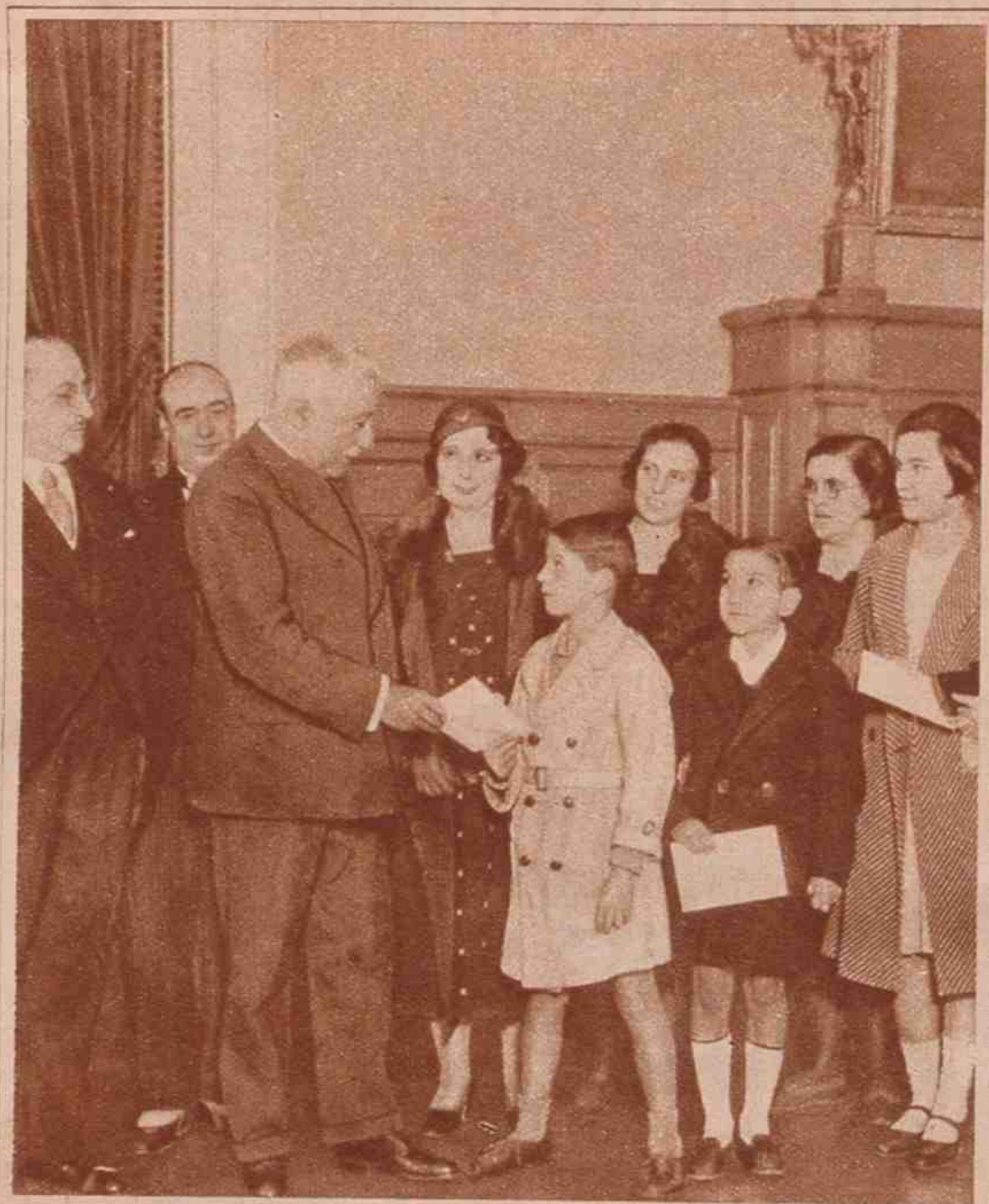
En el Palacio Nacional se celebró días pasados el simpático acto de entregar a cuatro huérfanos de artistas las cartillas de ahorro instituidas por el Circulo de Bellas Artes para conmemorar el aniversario de la proclamación de la República. El Jefe del Estado entregando a los niños los respectivos resguardos.