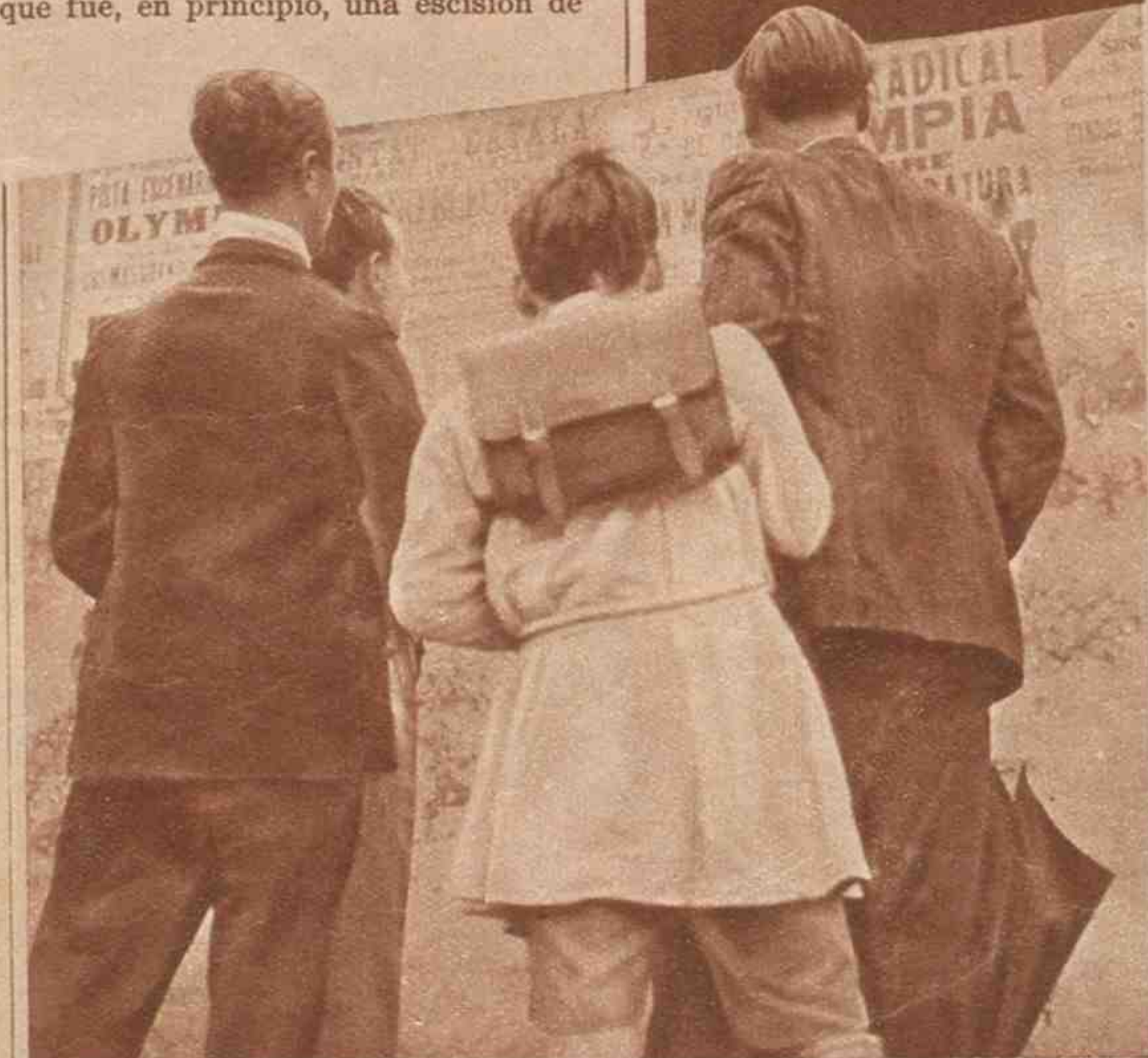
¿A quién votarían?

la Lliga y que tiene por líder a Nicolau d'Olwer. Y la del Bloque Obrero y Campesino, disidencia catalanista del Comunismo, que dirige Joaquín Maurín.