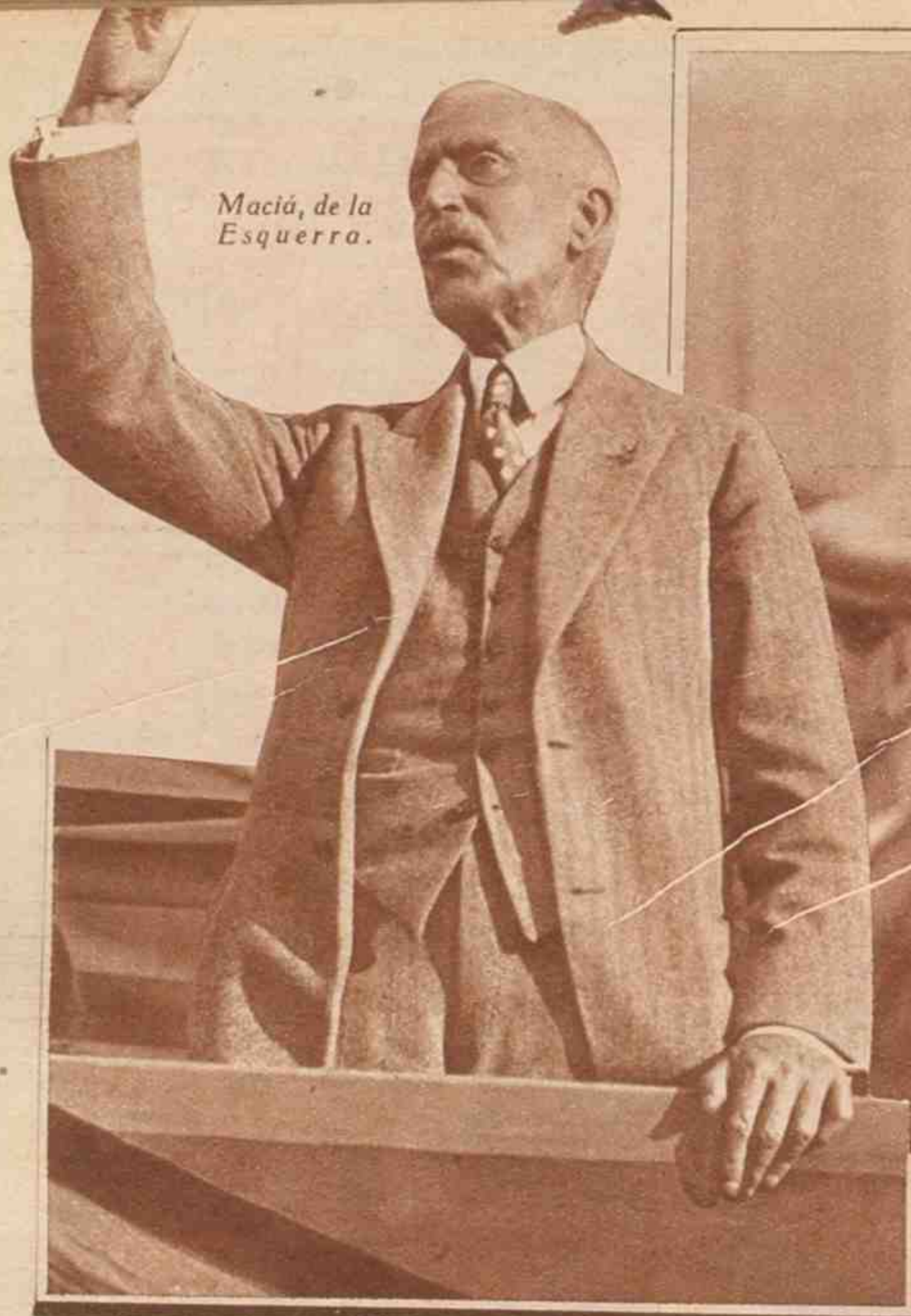
Macià, de la Esquerra.