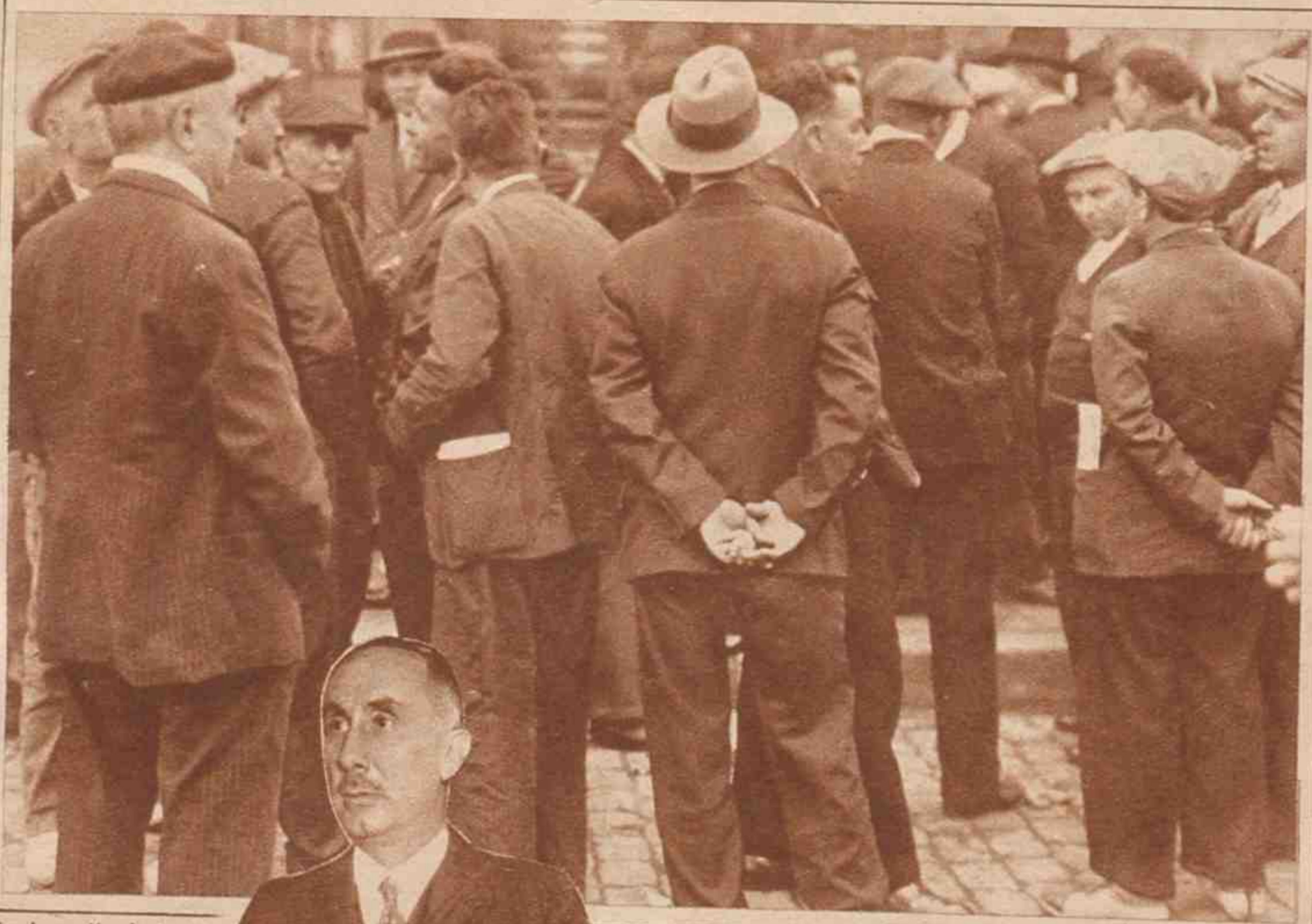
En la calle, bajo un altavoz, escuchando a Cambó.