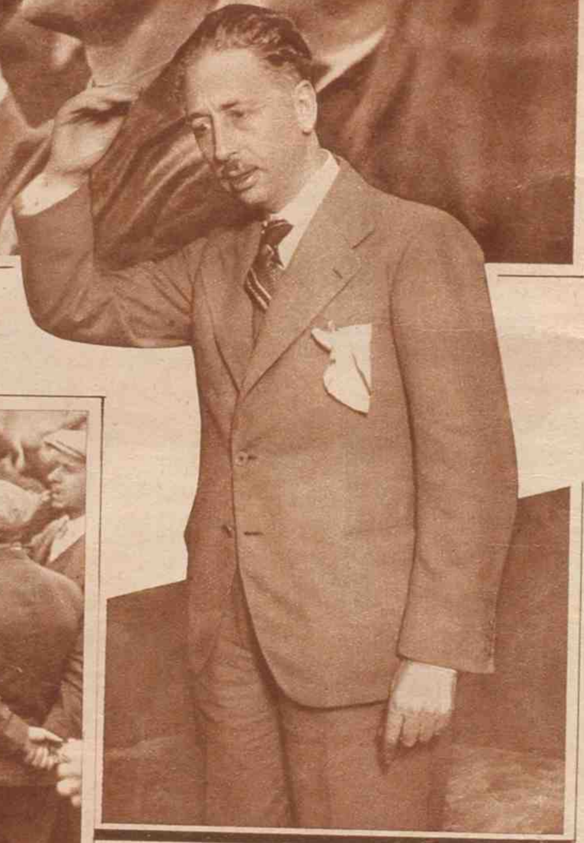
Companys, el lider de la Esquerra.