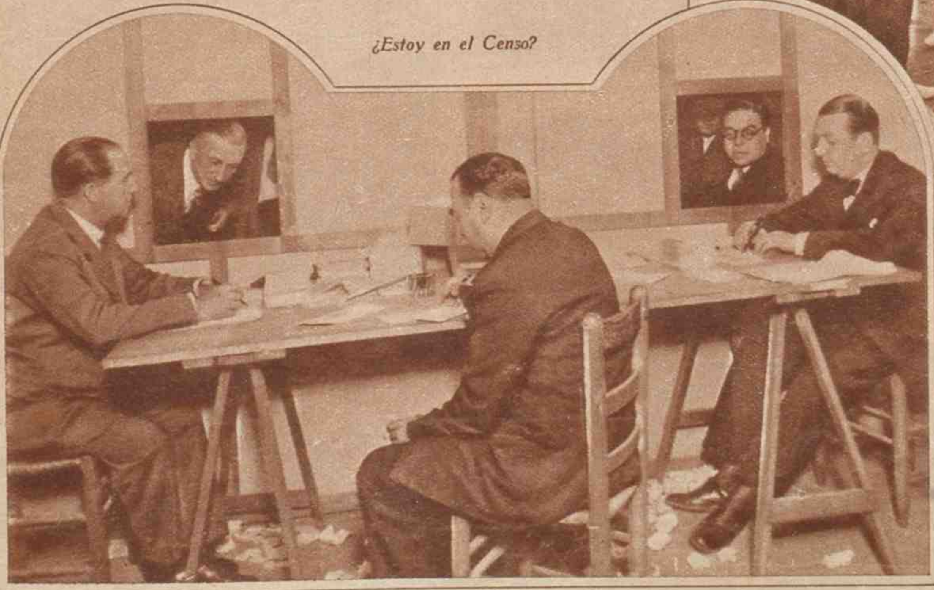
¿Estoy en el Censo?