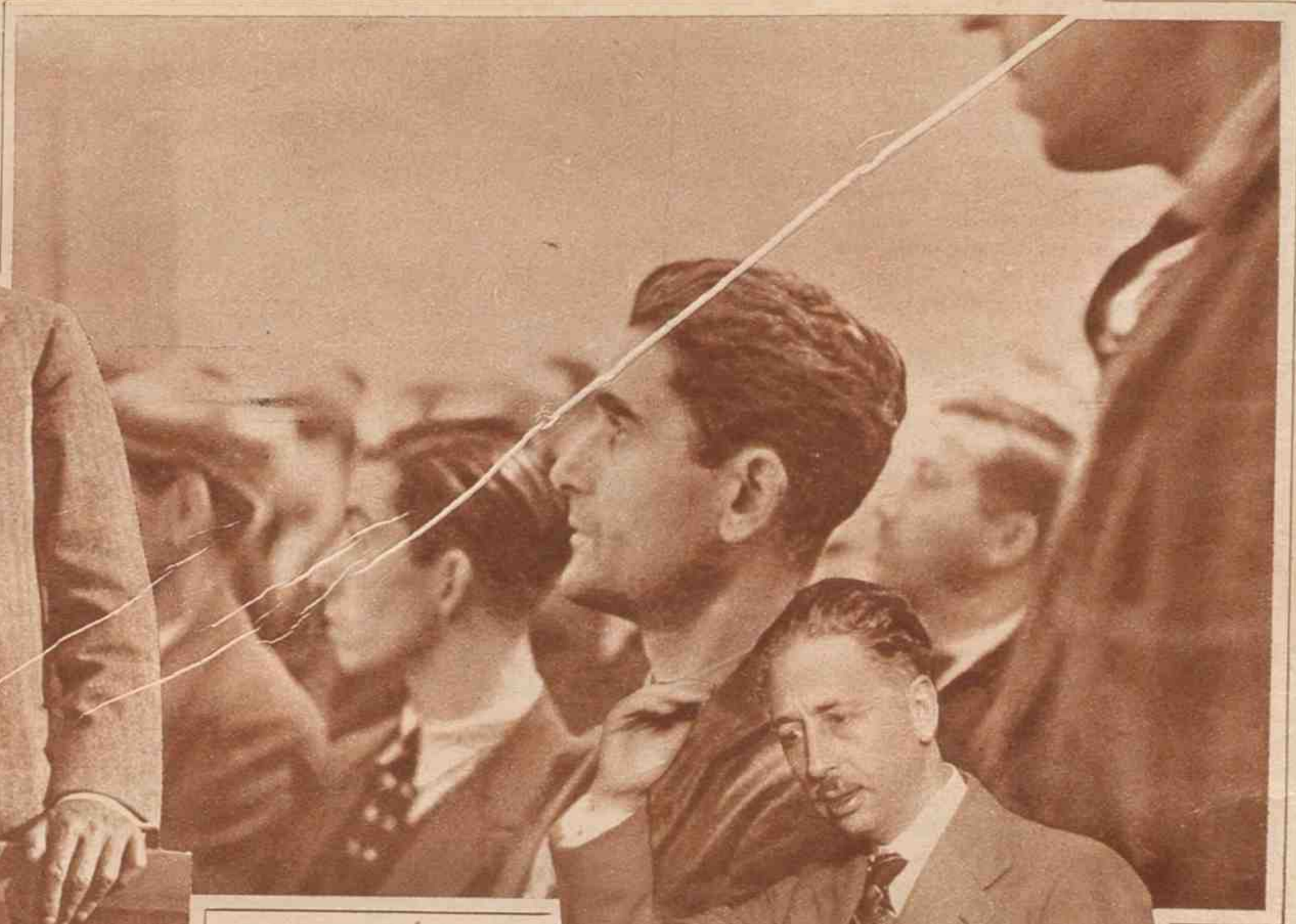
Escuchando a un orador de la Esquerra.