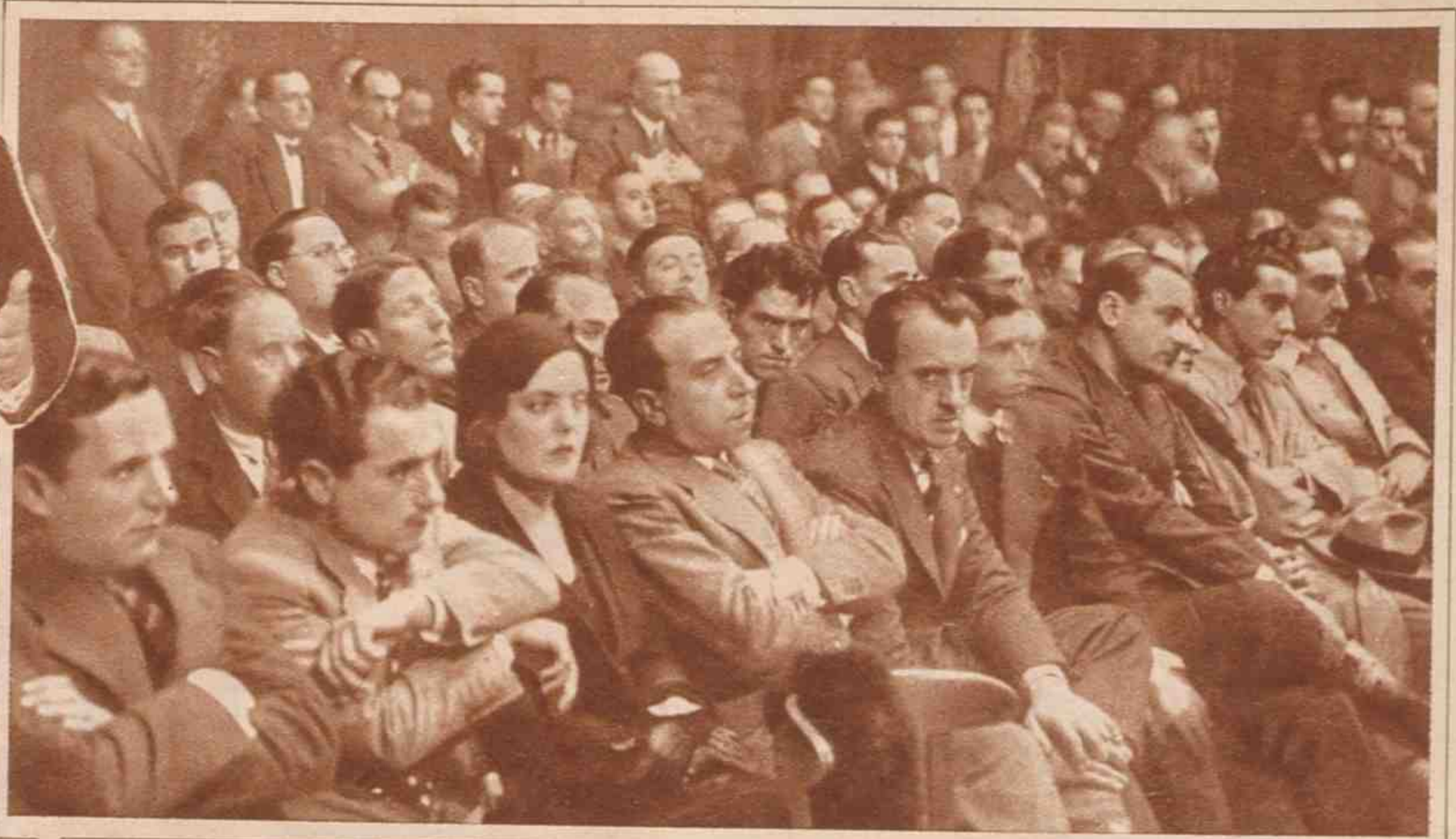
Escuchando a un orador del Partido Catalánista Republicano.