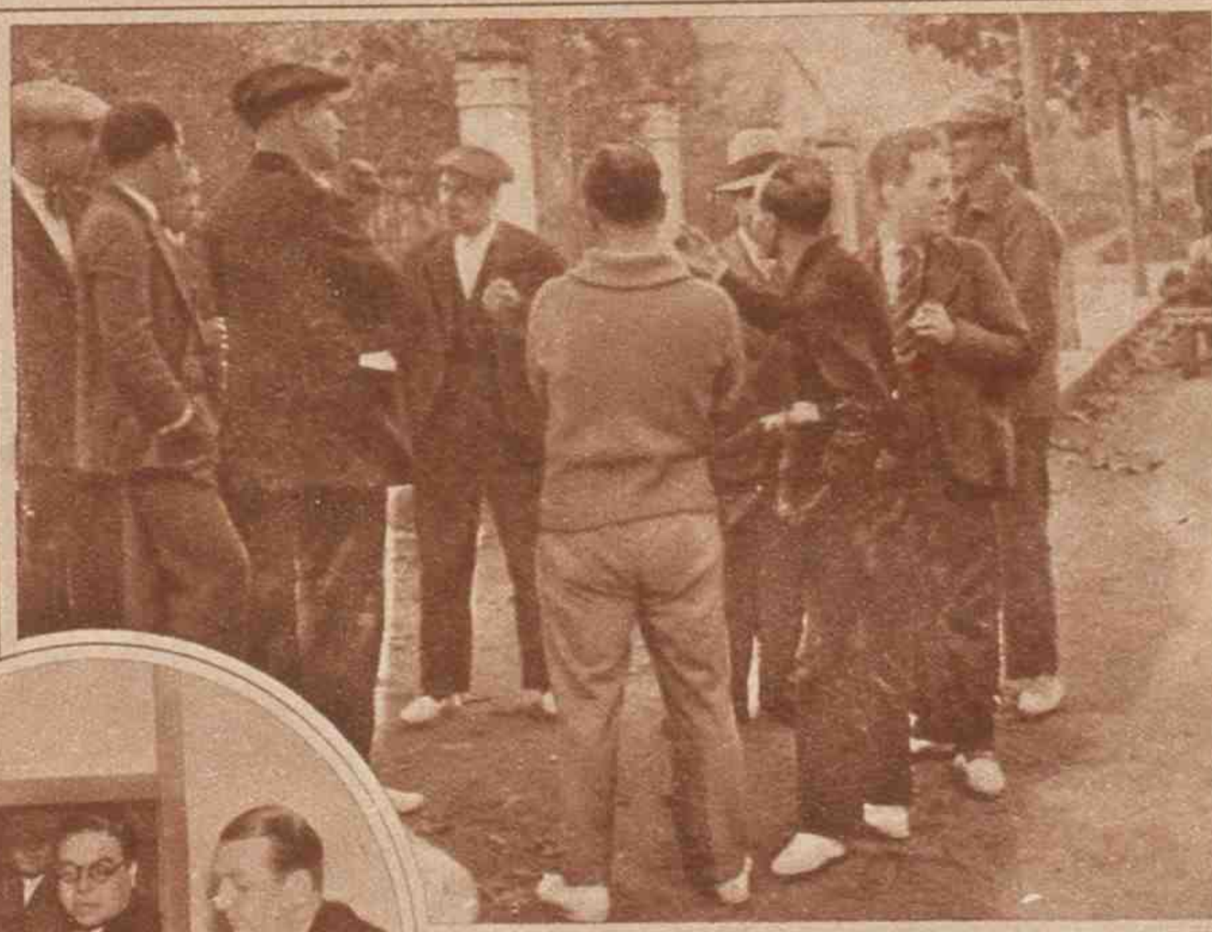
Una discusión política en un pueblo.

Aunque la Esquerra y Maciá mismo hayan perdido en el Gobierno popularidad, en general se cree que conservan todavía bastante fuerza para ganar las mayorías en Barcelona, Lérida y Gerona. En Tarragona