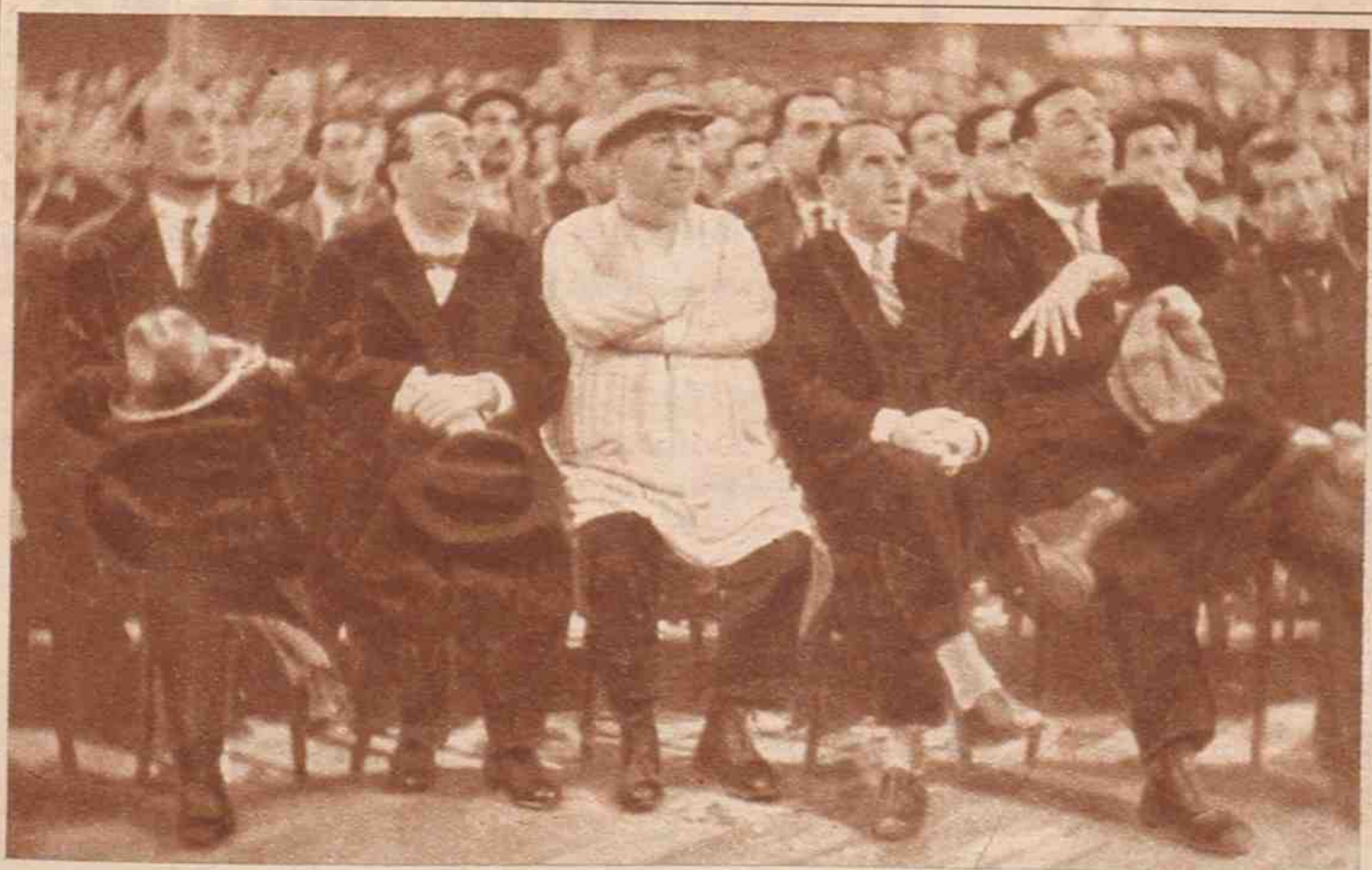
Escuchando a un orador radical.