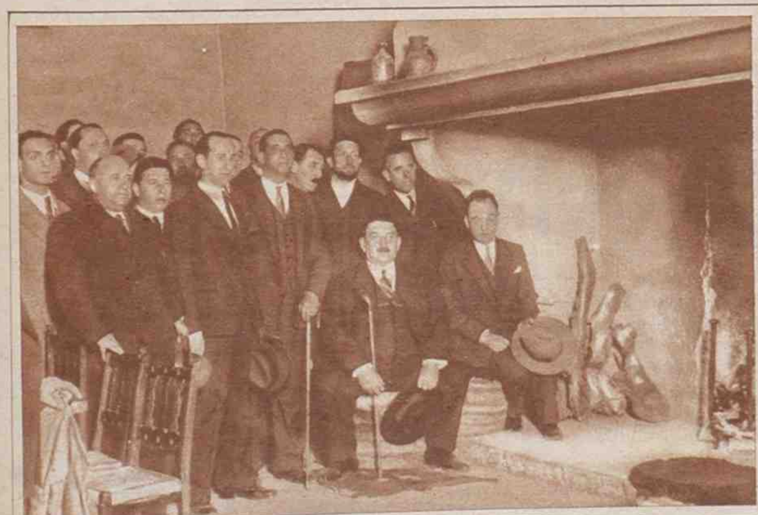
Herriot literato, autor de «Laporte Océane», de «Beethoven», se ha hecho llevar a Alcalá de Henares, donde, después de visitar la Universidad, merendó en la hostería.