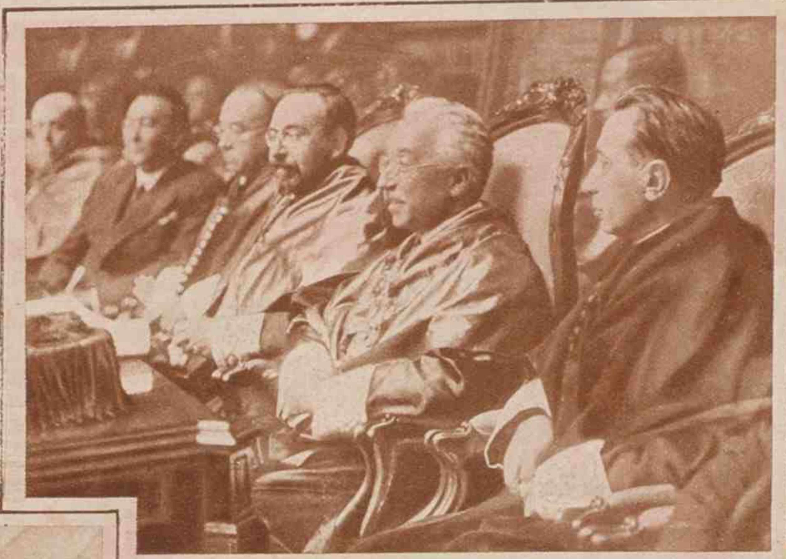
El Presidente de la República en la inauguración del curso académico del Instituto de Cabra (Córdoba), donde el señor Alcalá Zamora hizo los estudios del bachillerato.