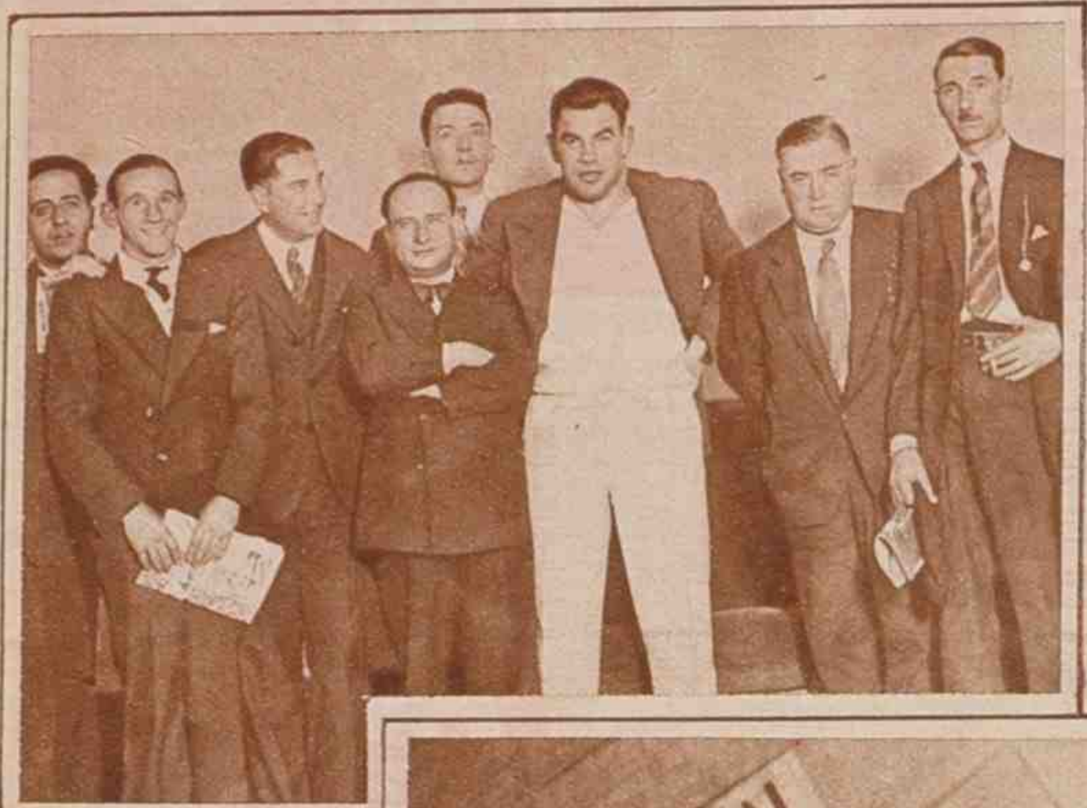
El boxeador Paulino Uzcudun con nuestro compañero Díez de las Heras y los íntimos que le acompañaron en su visita a nuestra casa.