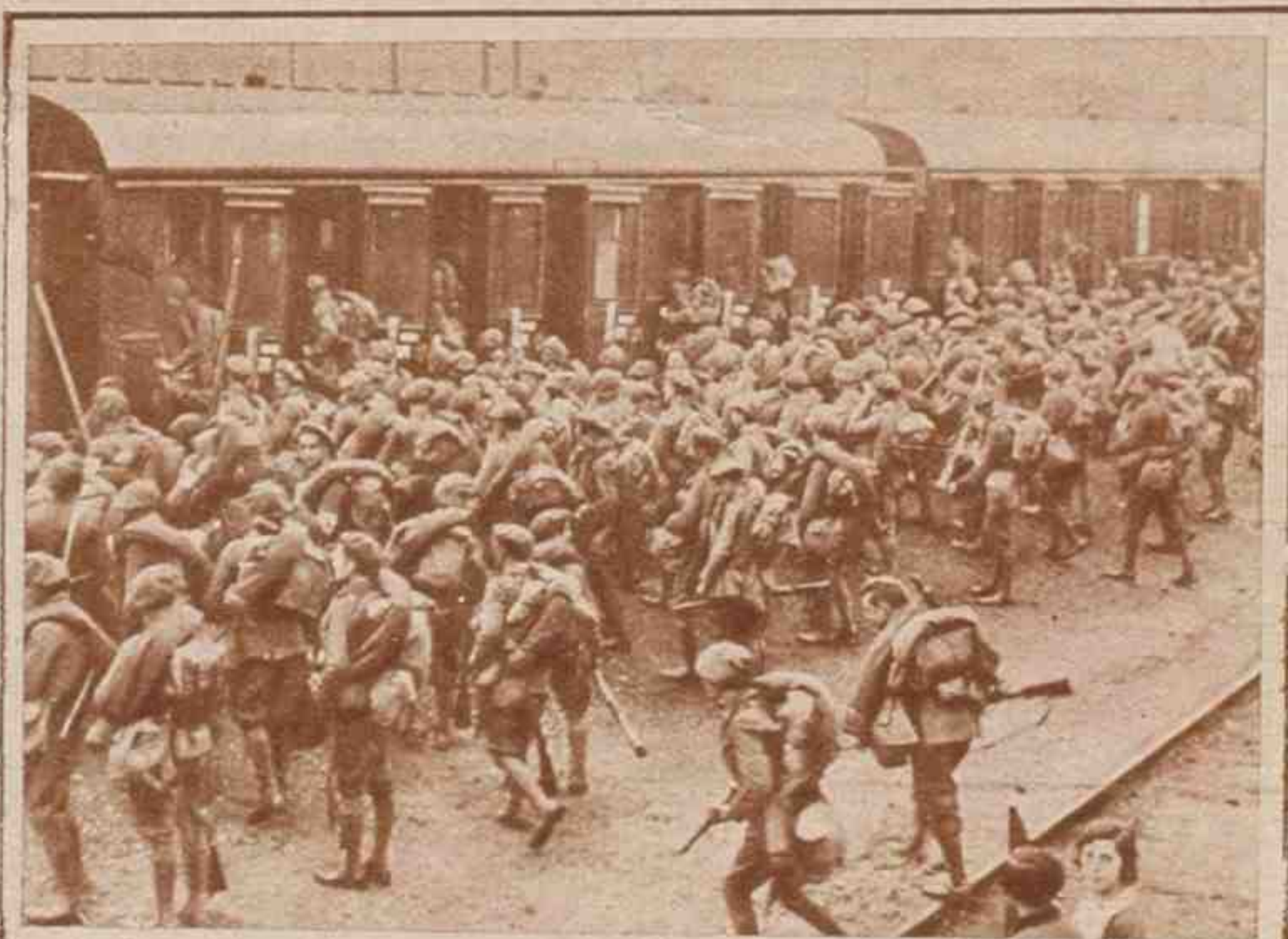
De todas las ciudades españolas se están destacando importantes núcleos de tropas para tomar parte en las maniobras militares del Pisuerga. En la foto, soldados de la guarnición de Bilbao tomando el tren para dirigirse a la base de las operaciones.