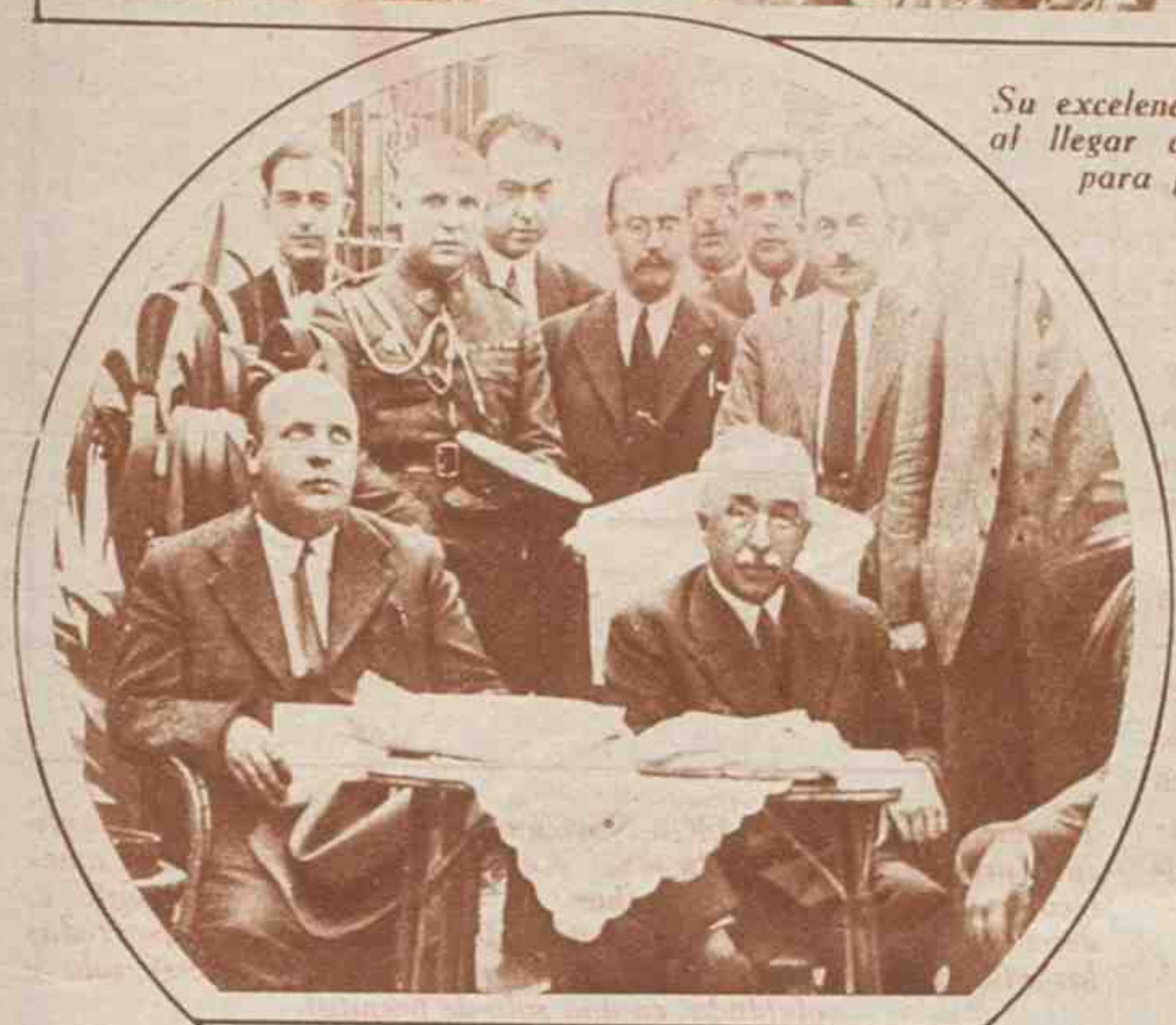
Su excelencia el Presidente de la República al llegar a la Exposición de Muestras para presidir su inauguración.