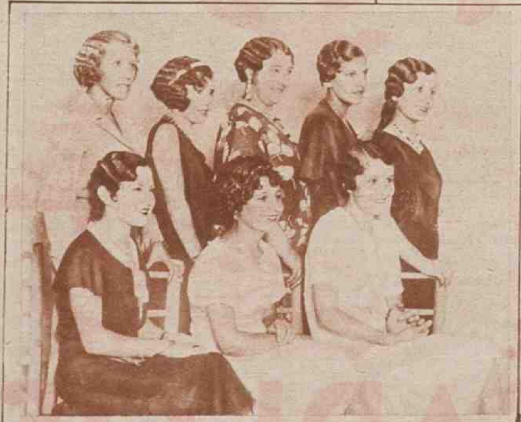
Grupo de señoritas que se presentaron al concurso de peinados que tuvo lugar en la verbena de Goya.