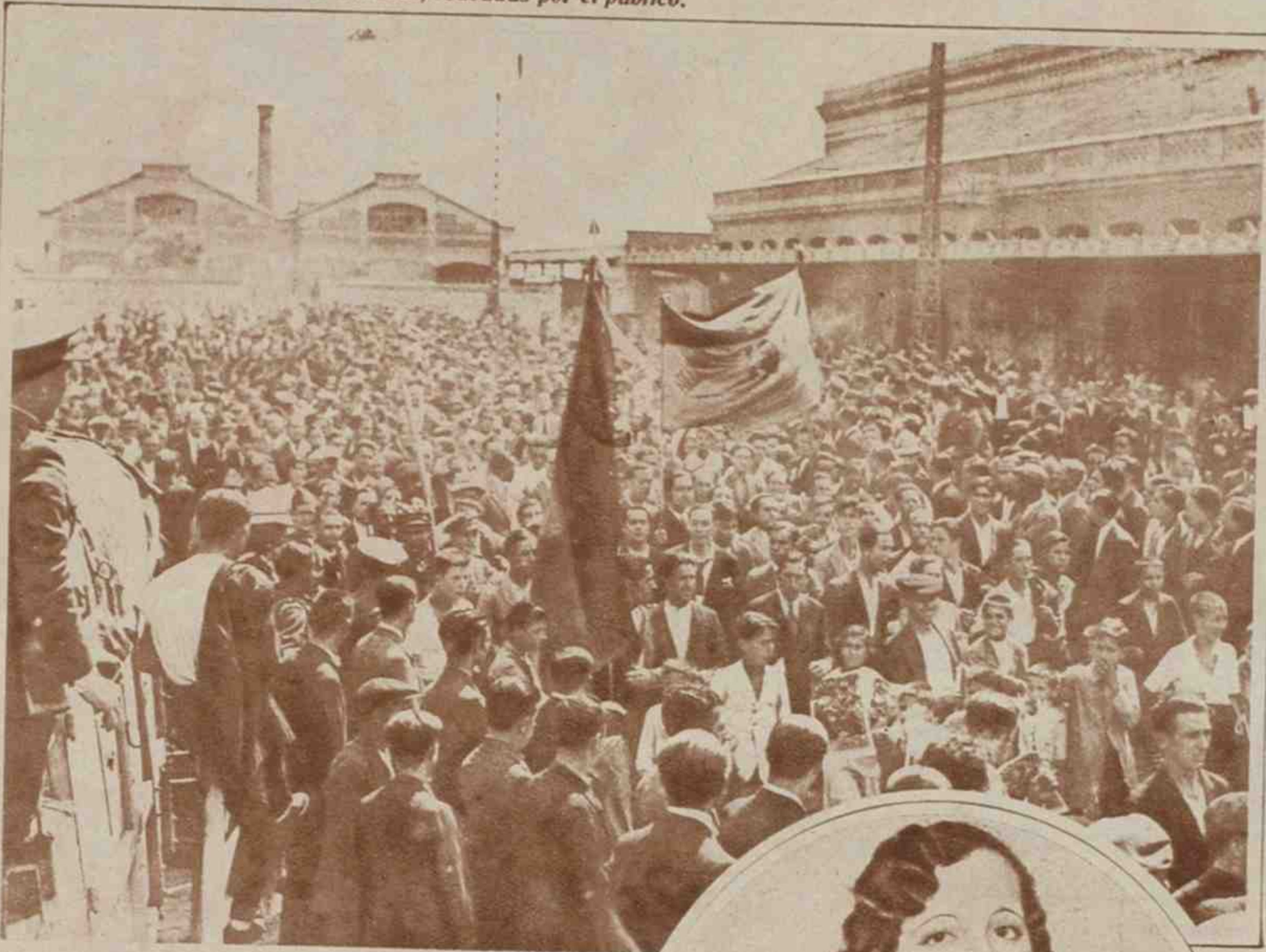
Una imponente manifestación cívica, desbordante de entusiasmo republicano, acompañó hasta su cuartel a las tropas procedentes de Sevilla, en medio de continuos vivas y ovaciones delirantes.