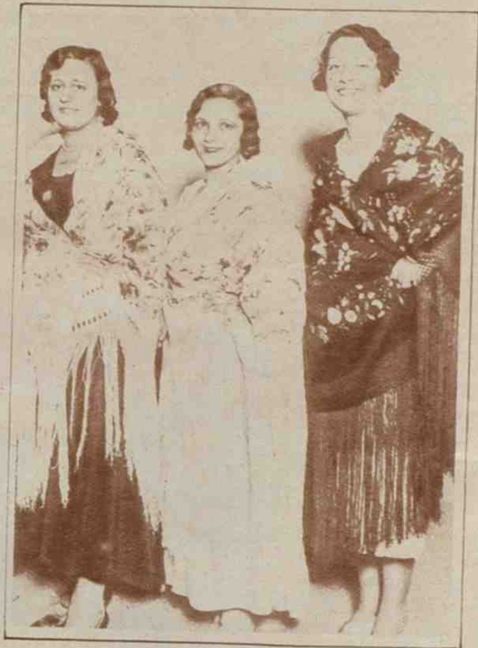
Los tres mantones premiados en el concurso organizado por el Centro Segoviano.