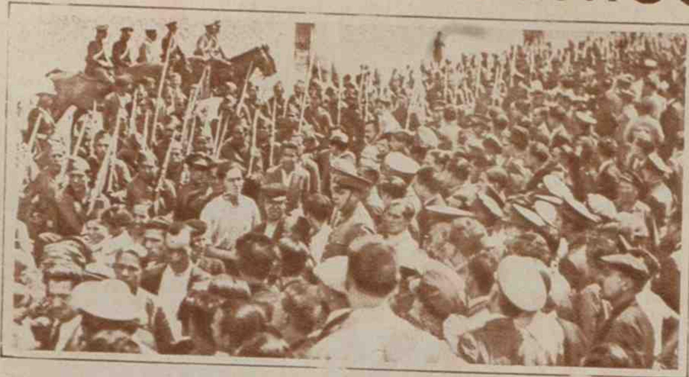
El pasado miércoles llegó a Madrid el batallón del regimiento de Infantería número 1, que regresaba de Sevilla, donde fue enviado para reprimir el fracasado movimiento sedicioso. En la estación de Atocha era esperado por una inmensa muchedumbre que tributó a los soldados un recibimiento entusiasta. En la foto, el momento de salir las tropas de la estación, rodeadas por el público.