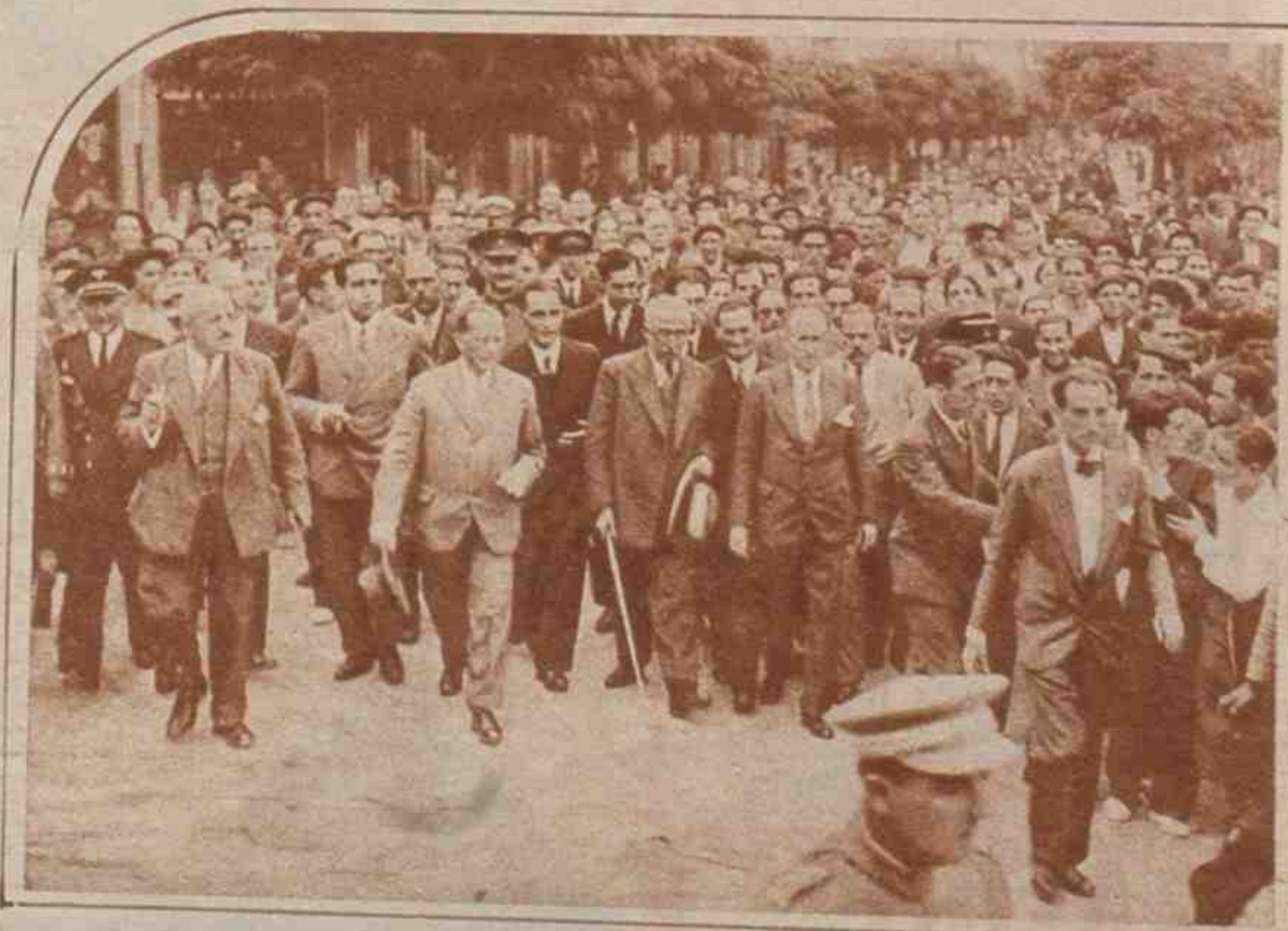
Los estudiantes extranjeros rodeando al Presidente en la Biblioteca Menéndez y Pelayo.