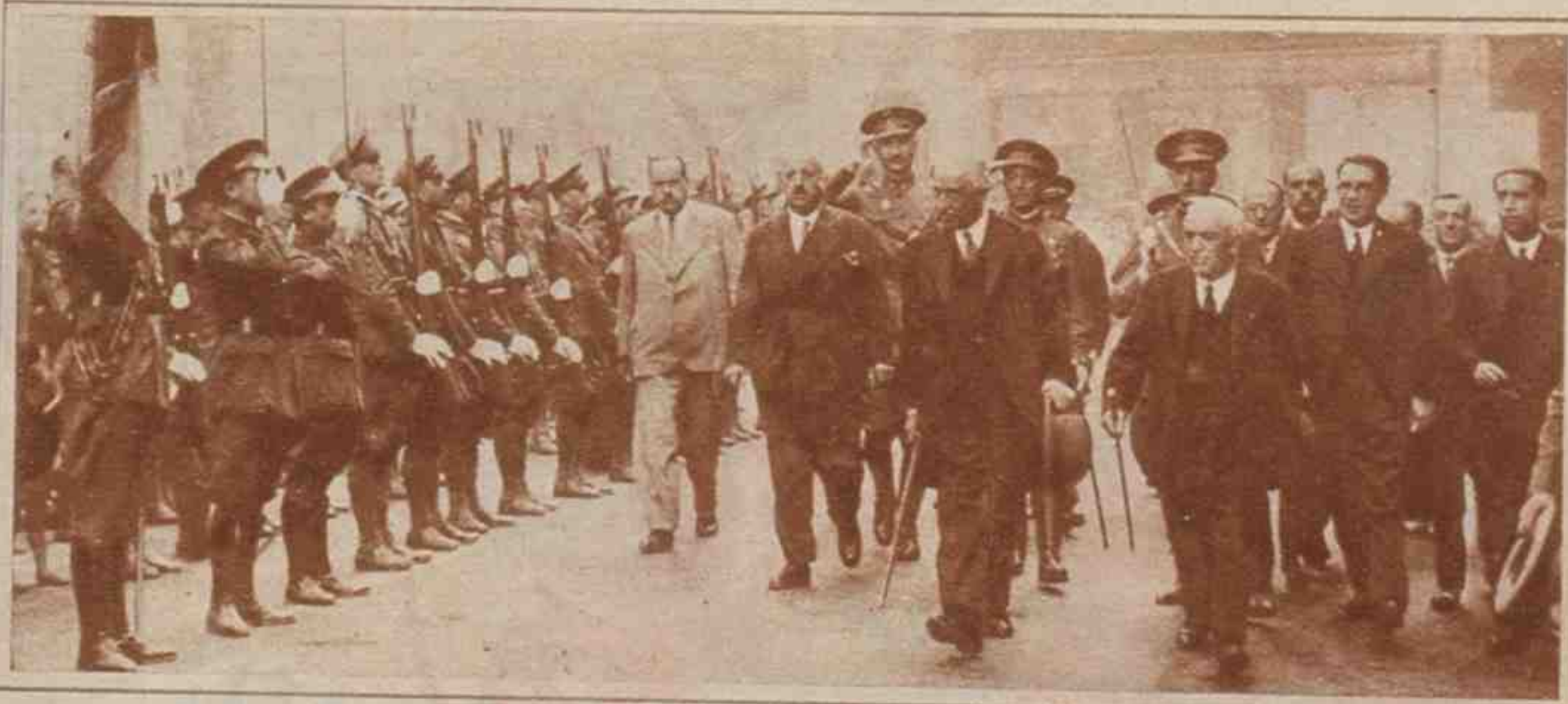
El director de la Casa de Salud de Valdecilla y el personal de la misma, durante la visita que el Presidente hizo al benéfico establecimiento.