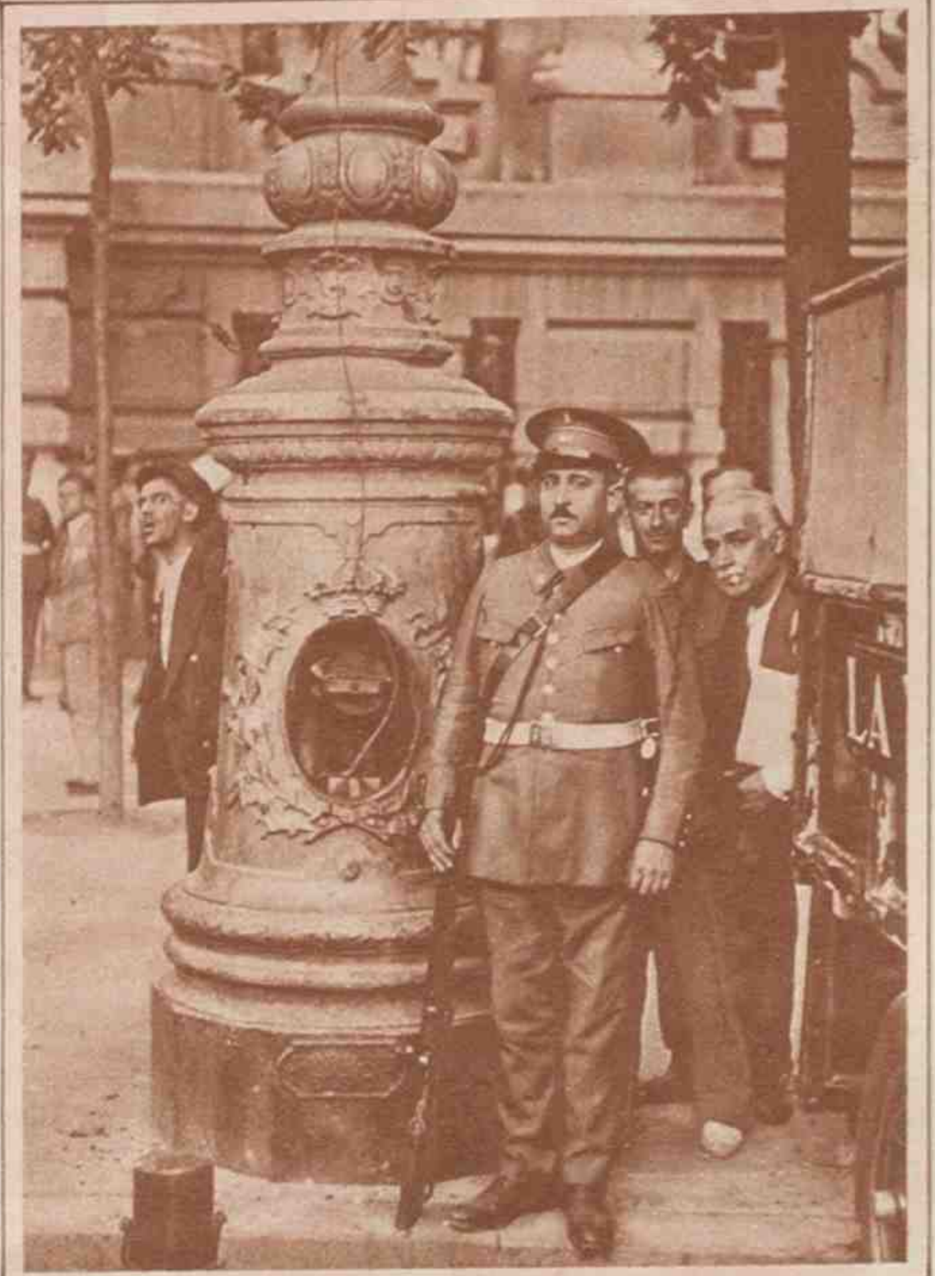
Destrozos producidos durante la lucha en uno de los postes que sostienen los focos eléctricos en las inmediaciones de Correos.