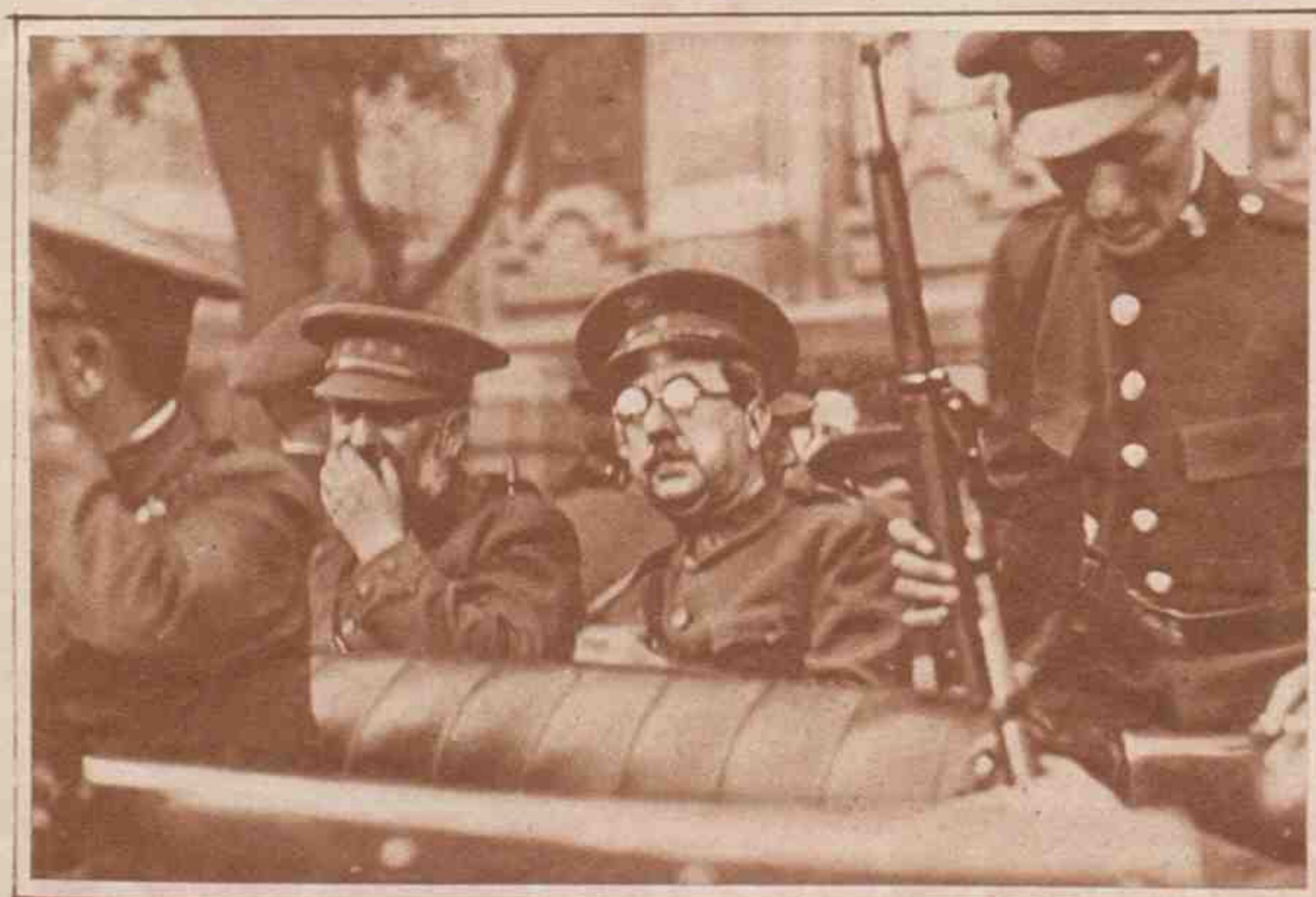
Los jefes del movimiento en el automóvil en que fueron conducidos a la Dirección de Seguridad.