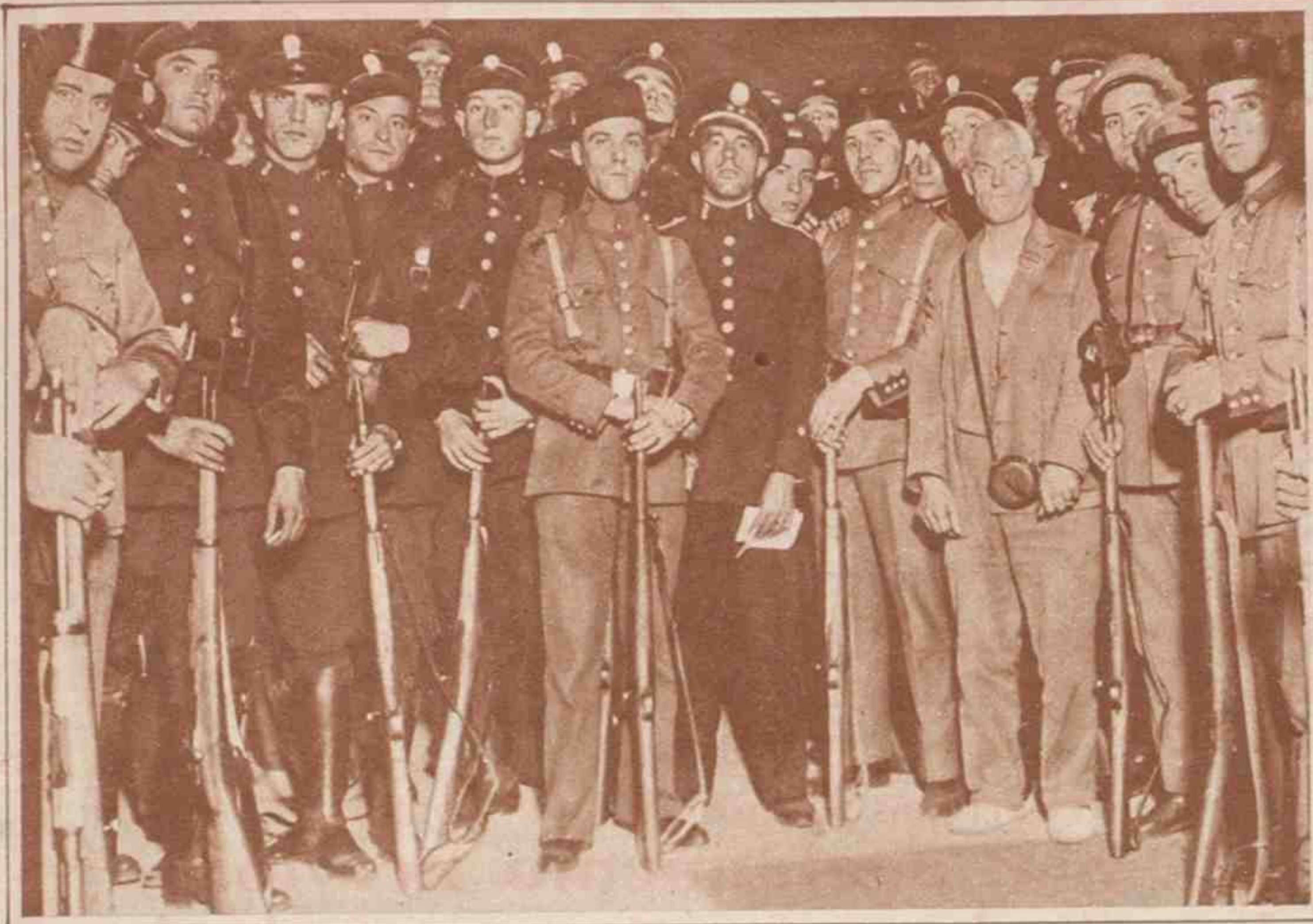
Los dos guardias civiles a quienes se dirigieron los jefes sublevados, en el edificio de Correos, sin lograr reducirlos. Después estos guardias detuvieron y desarmaron a los referidos jefes.