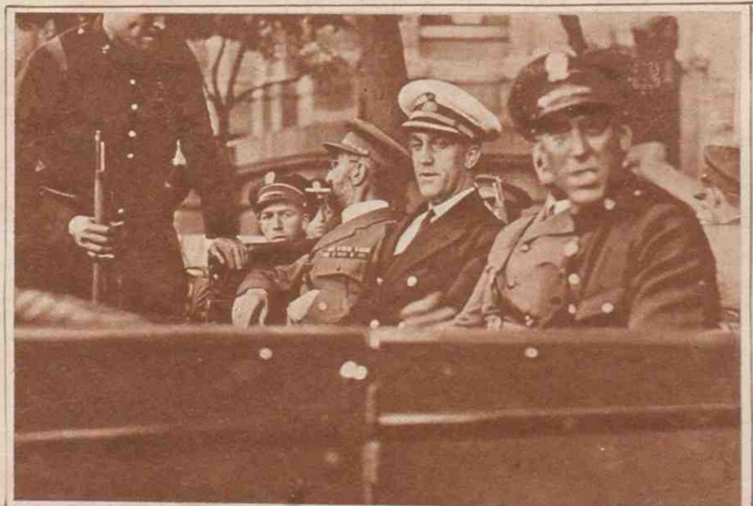
Otra fotografía en que aparecen los jefes rebeldes en el momento de su detención. (Continúa esta información en la página 19.)