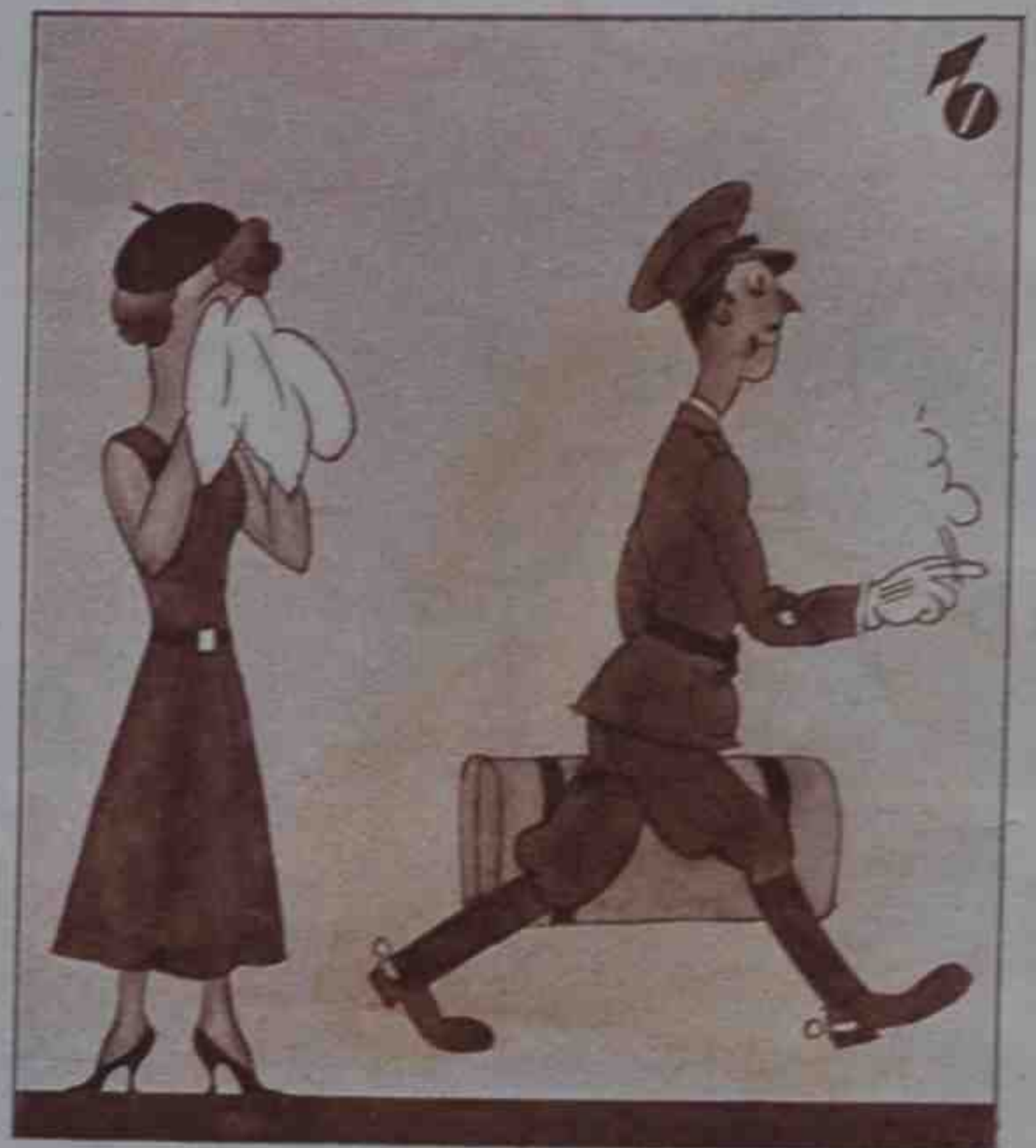
En Toledo y en Segovia llorará más de una novia.