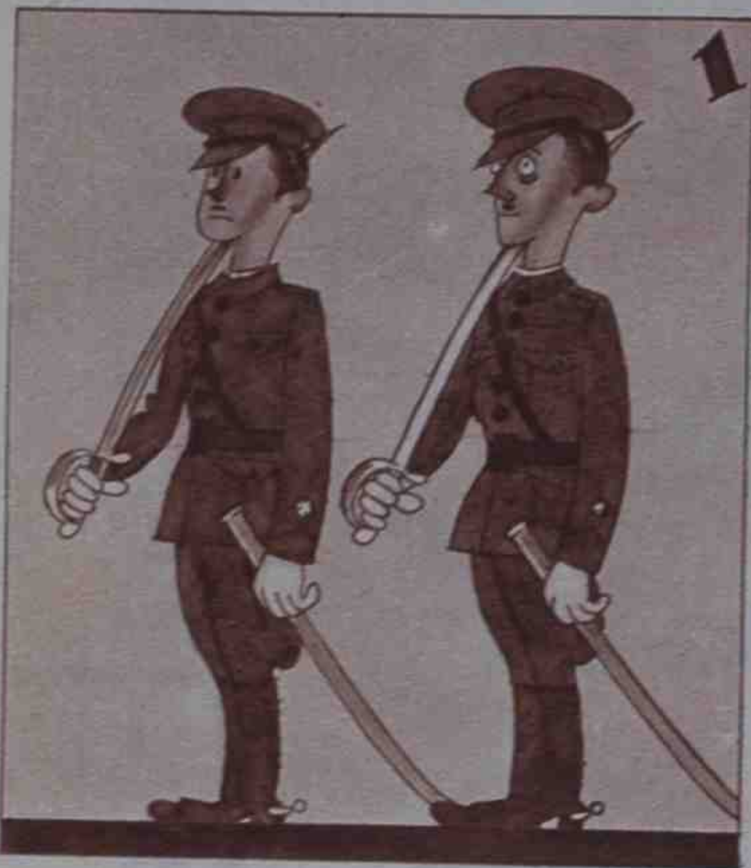
La República, marciales, tiene nuevos oficiales.