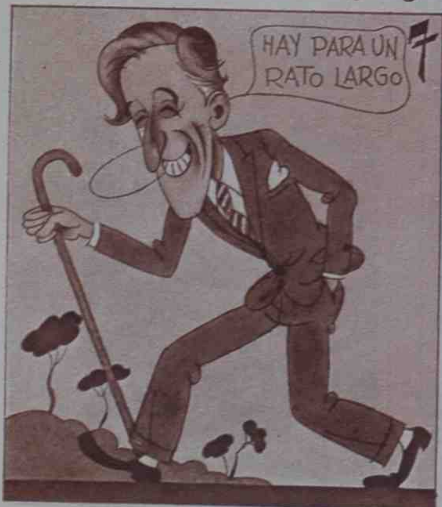
Y según su presidente gozan salud excelente.