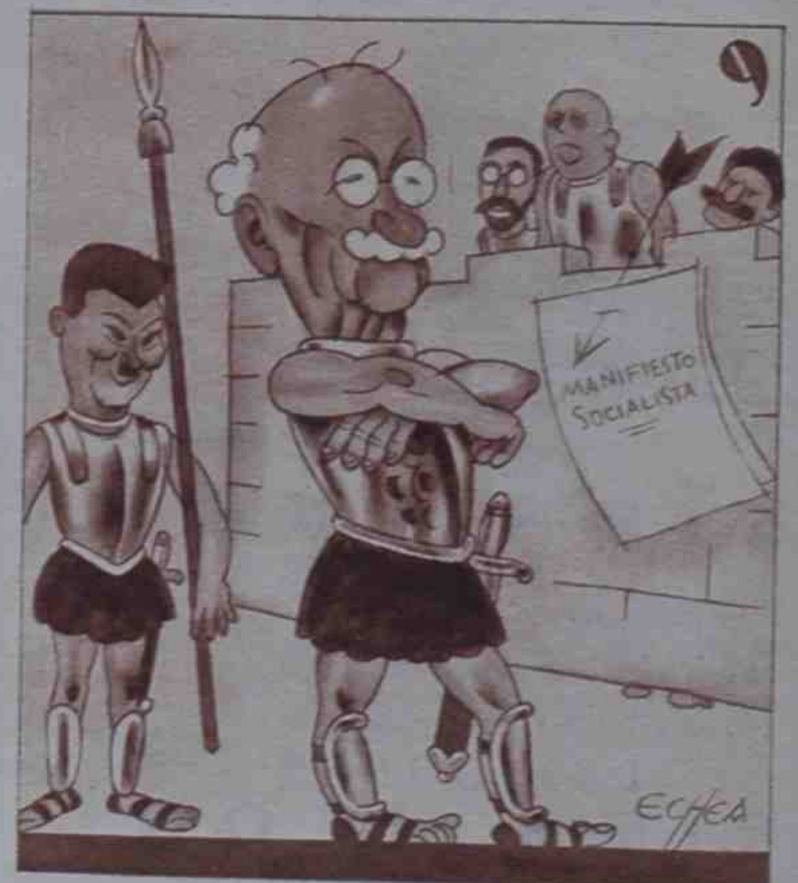
De Alejandro las conquistas estorban los socialistas.