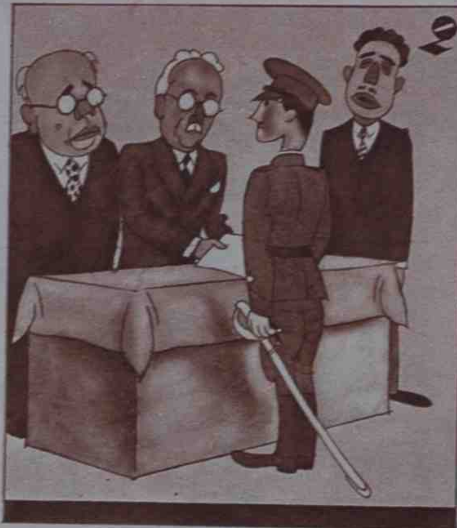
Su Excelencia a estos muchachos les entrega los despachos.