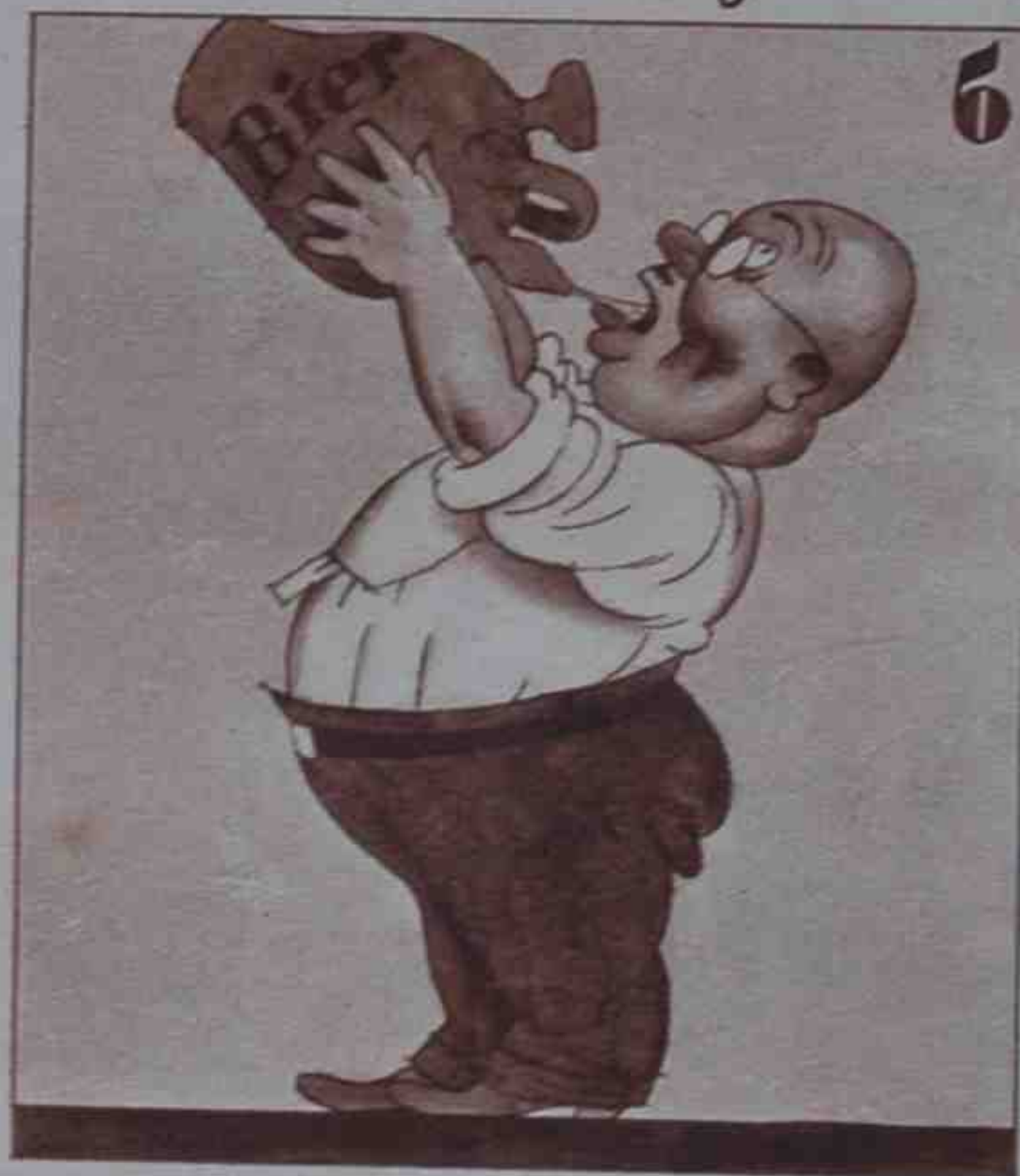
Algún Berlínés "cañi" bebe la cerveza así.