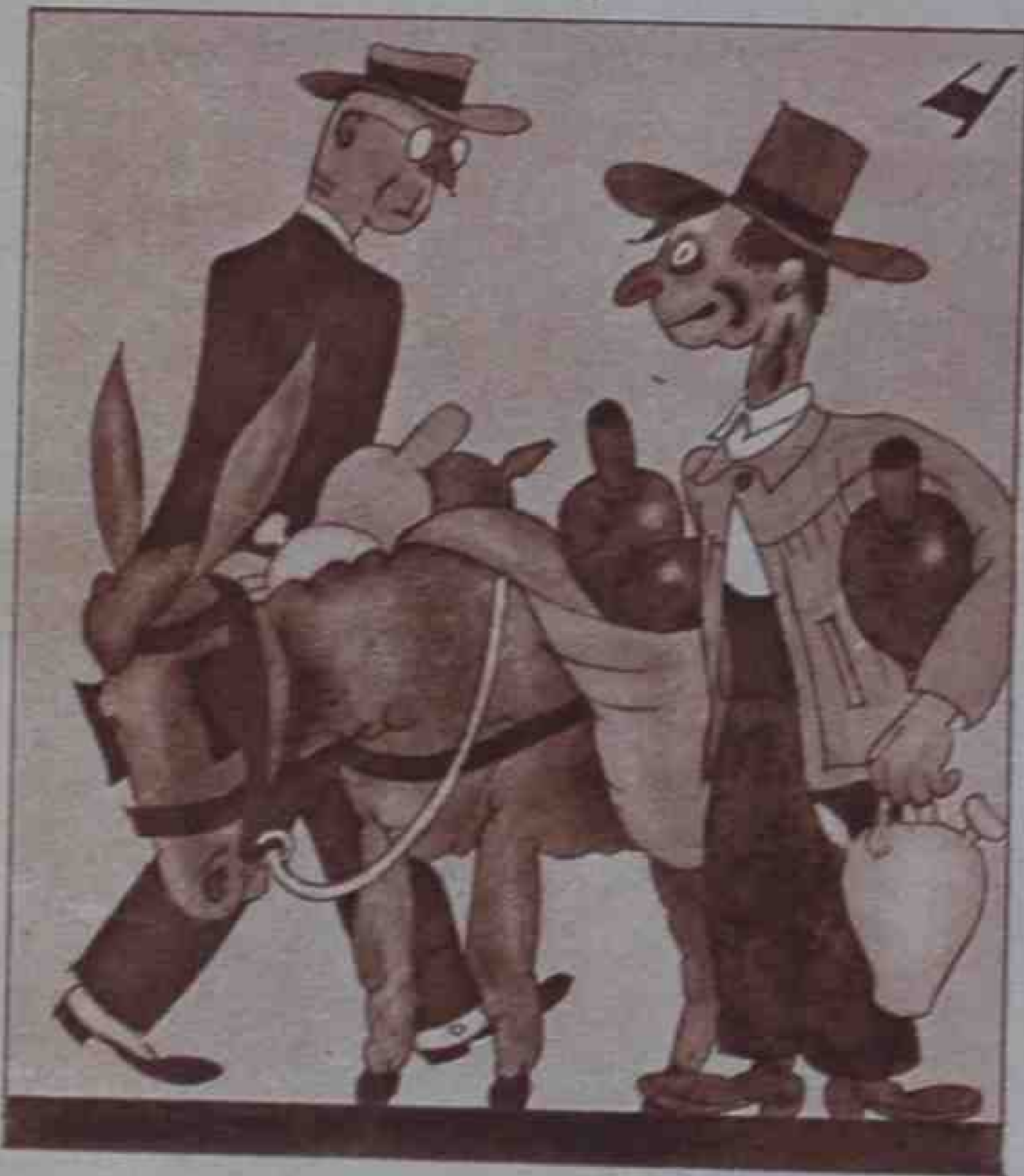
Nuestro clásico botijo causa en Berlín regocijo.