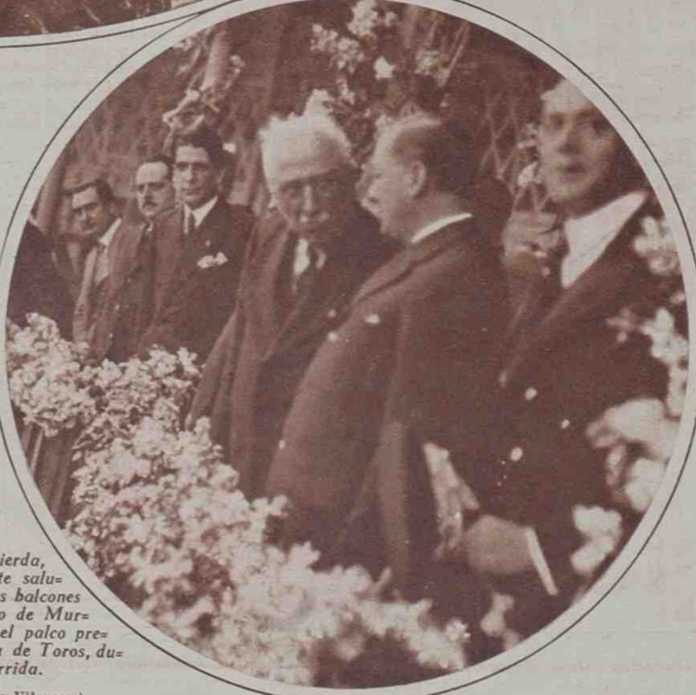
A la izquierda, el Presidente saludando desde los balcones del Ayuntamiento de Murcia. A la derecha, el palco presidencial en la Plaza de Toros, durante la corrida.