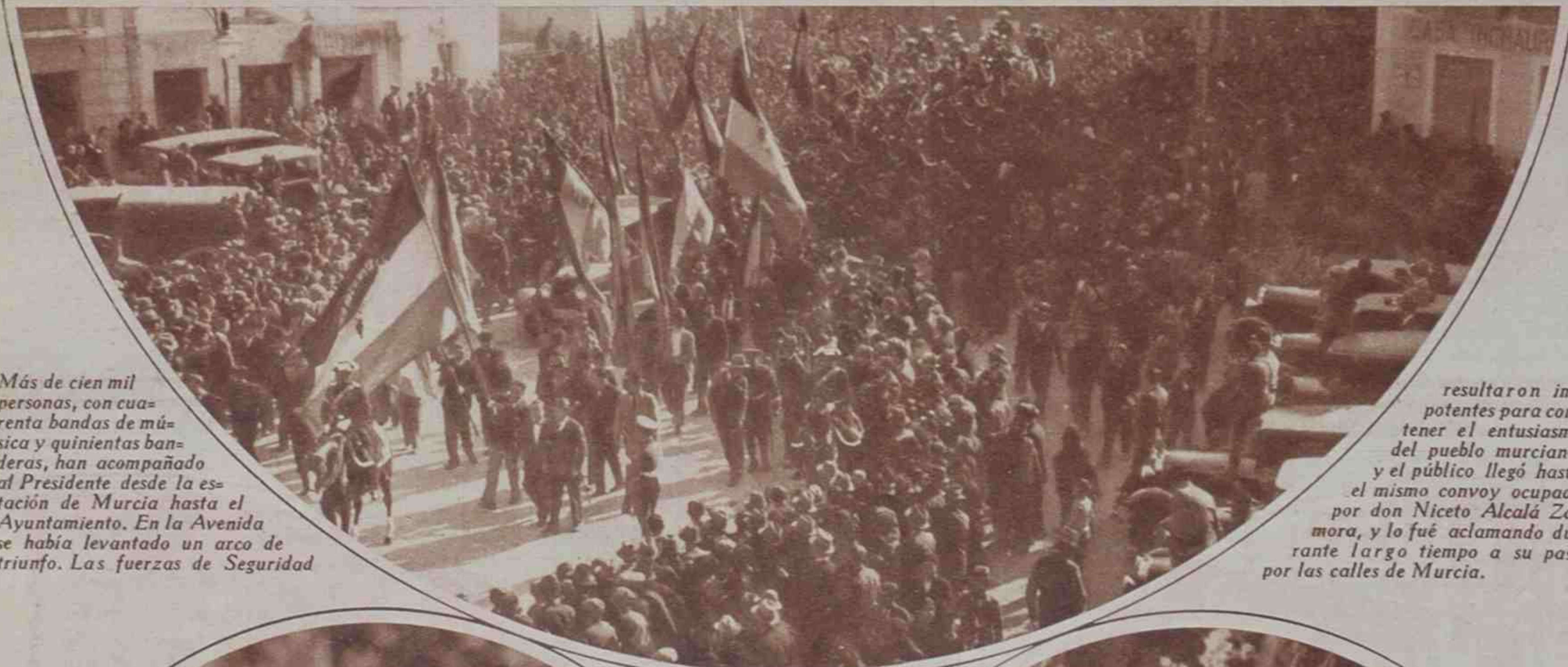
Más de cien mil personas, con cuarenta bandas de música y quinientas banderas, han acompañado al Presidente desde la estación de Murcia hasta el Ayuntamiento. En la Avenida se había levantado un arco de triunfo. Las fuerzas de Seguridad