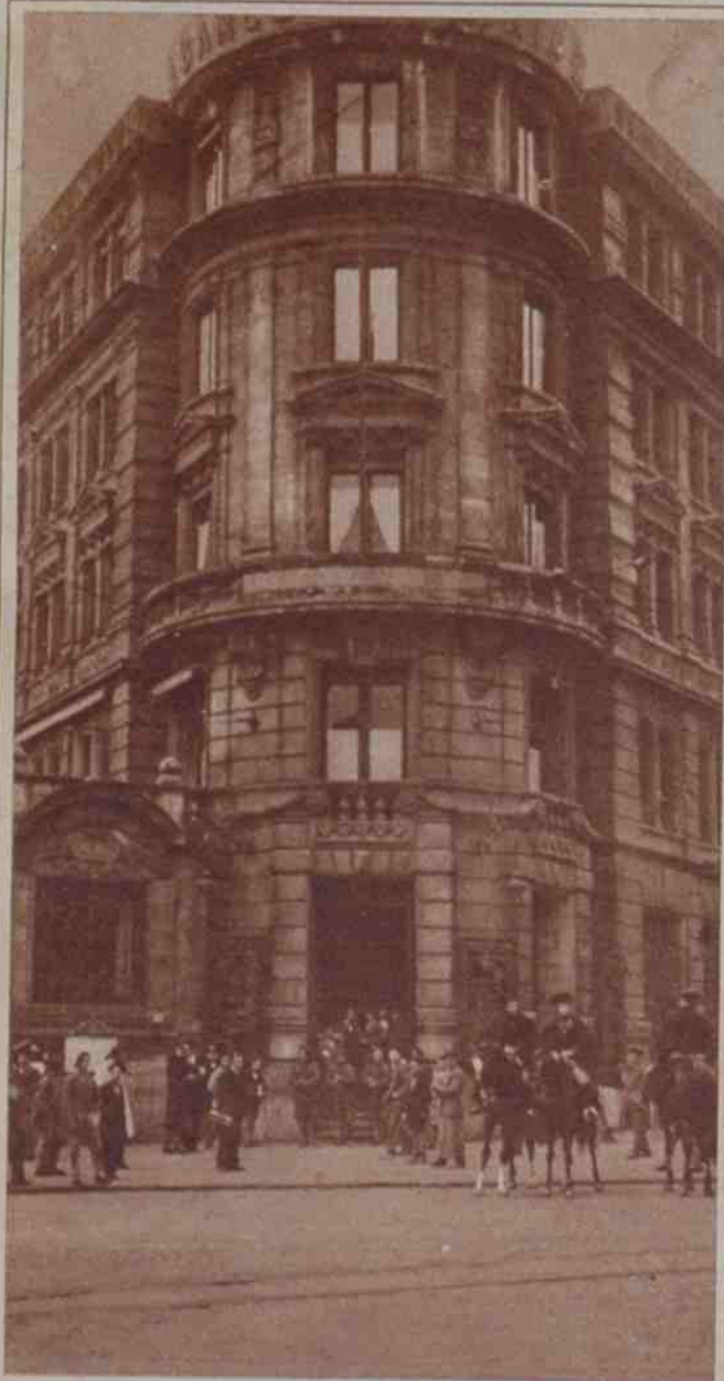
La fuerza pública custodiando un registro de la Telefónica en Vigo, donde hizo explosión un artefacto, ocasionando grandes destrozos.