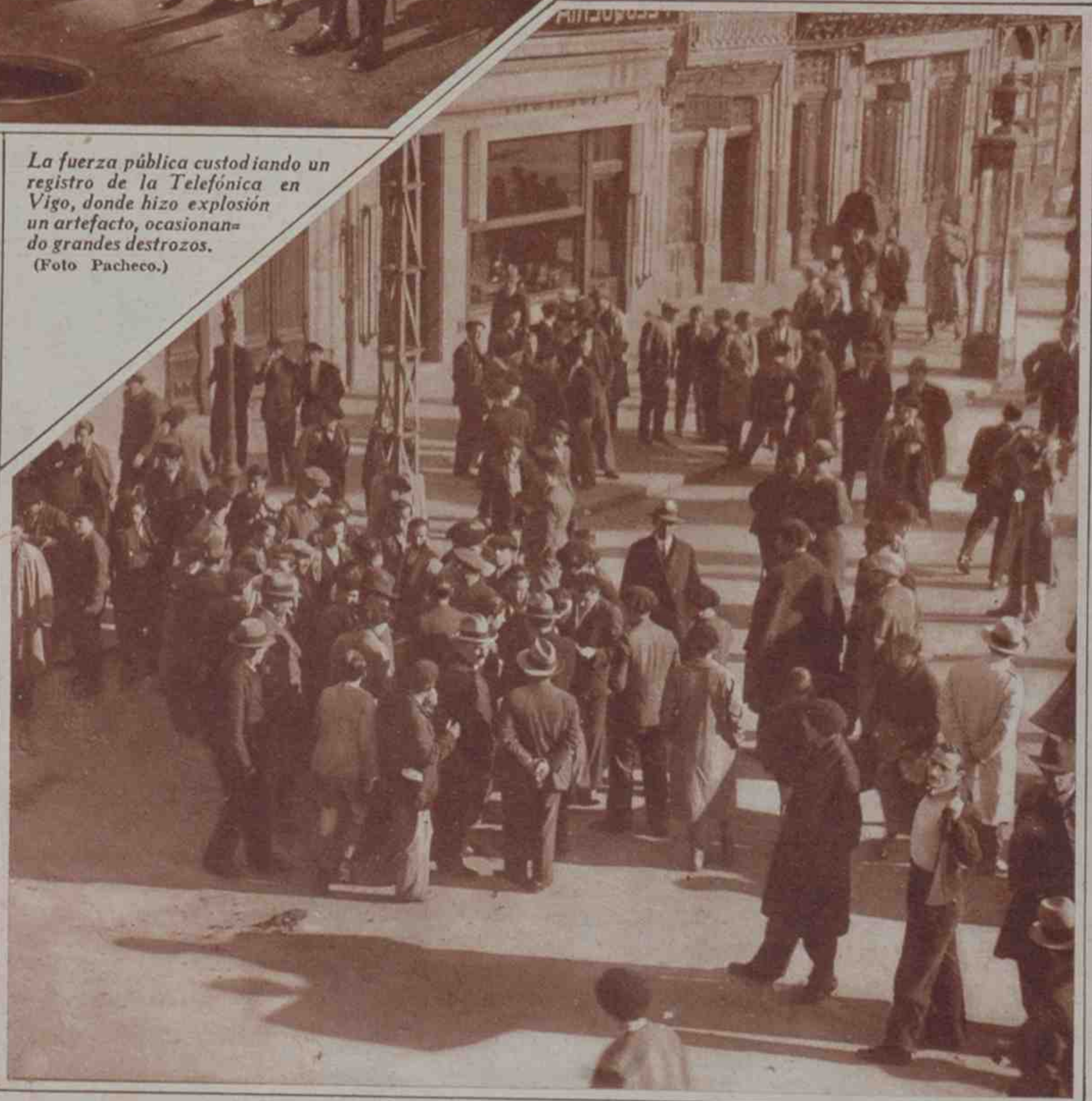
Durante la huelga general, las calles de La Coruña se vieron concurridas por numeroso público que comentaba animadamente el desarrollo de los sucesos. Vean ustedes el aspecto que ofrecía una de las vías bellas e importantes de la hermosa e importante ciudad.