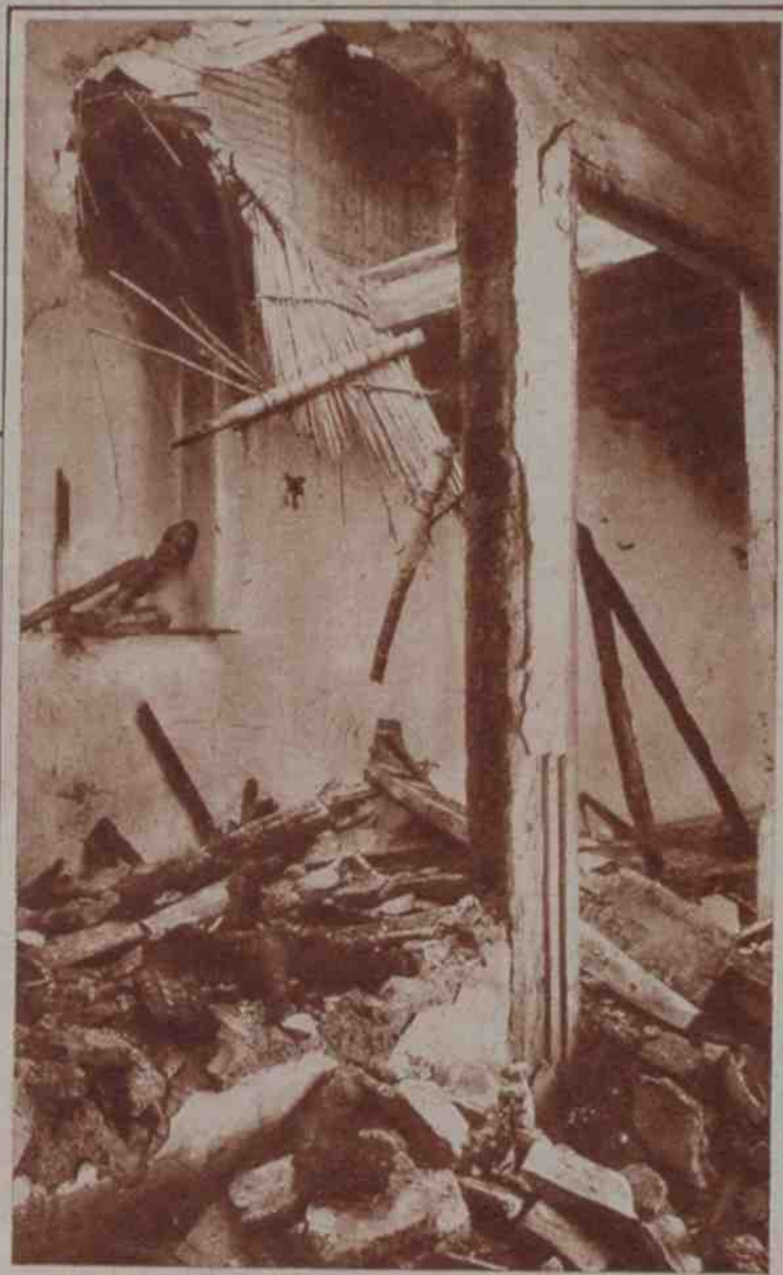
Estado en que quedó el antiguo templo de Belén, actualmente viejo penal de Granada, que fué incendiado por las turbas.