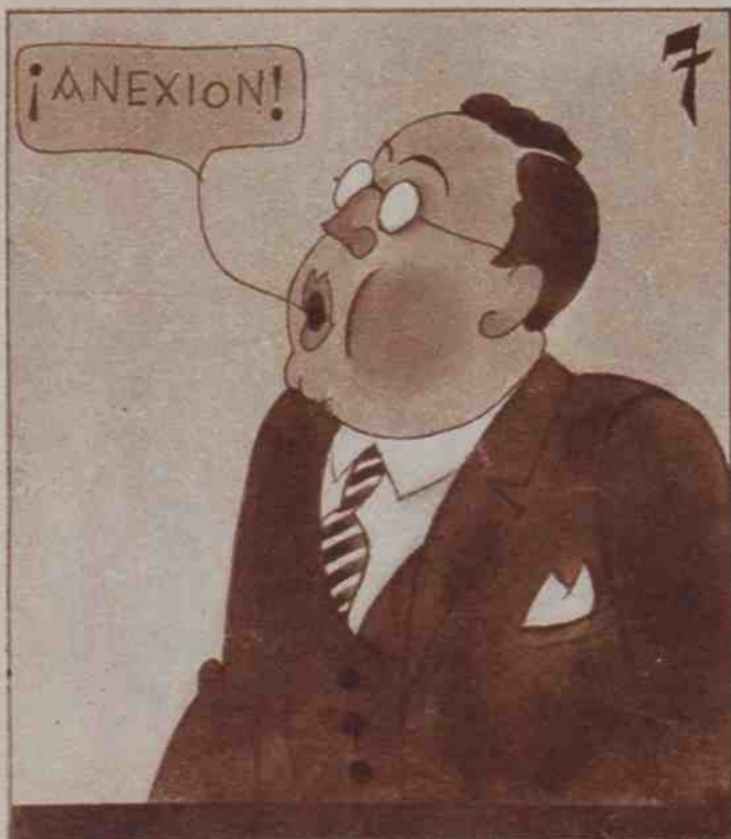
Se enfadará Sabotit si no crece "Magerit"