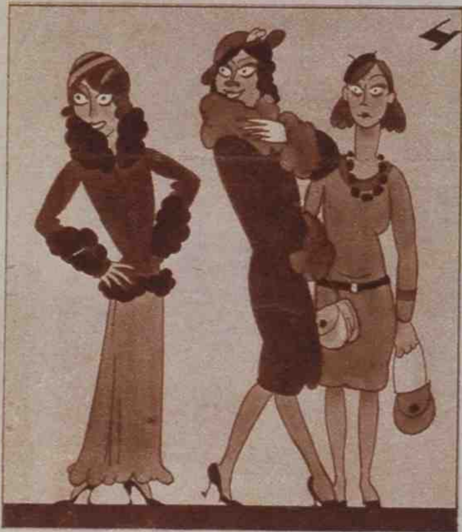
No se llegan de toda España "misses" más guapas que Aznara