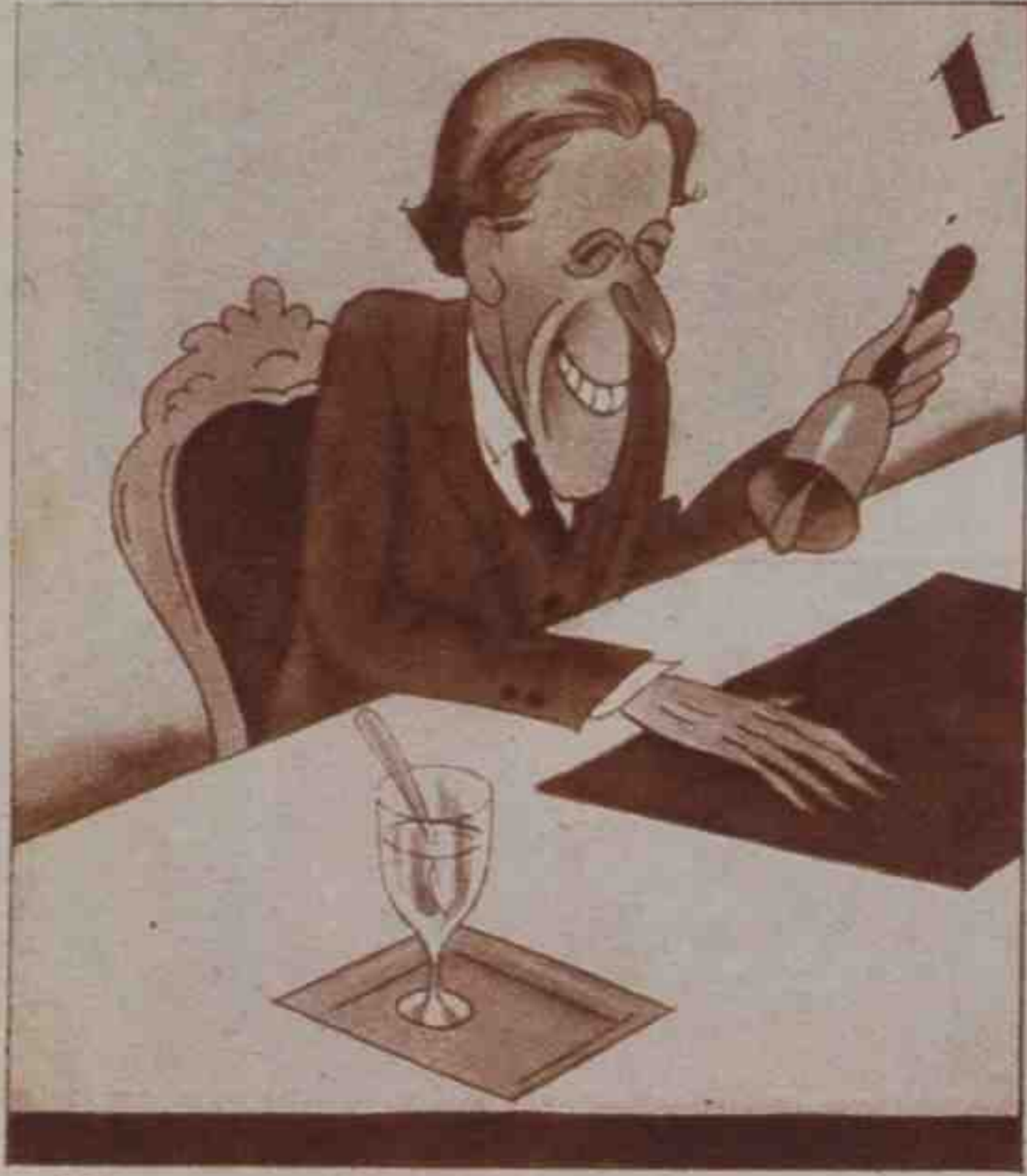
Se acabó la vacación, y "¡se abre la sesión!"