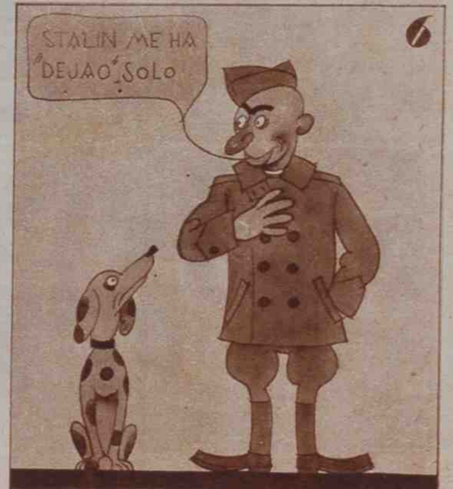
Hay en Alcalá de Henares comunistas a millares.