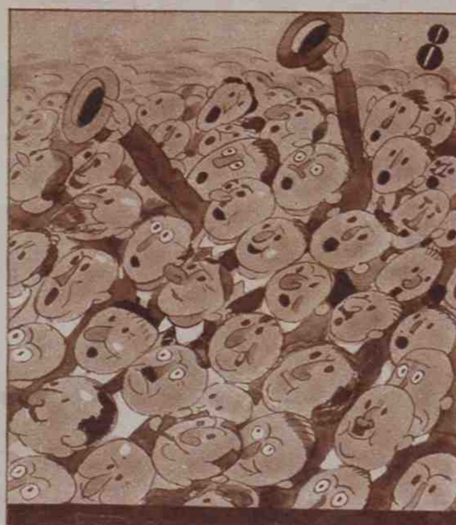
En Alicante la gente ovaciona al Presidente