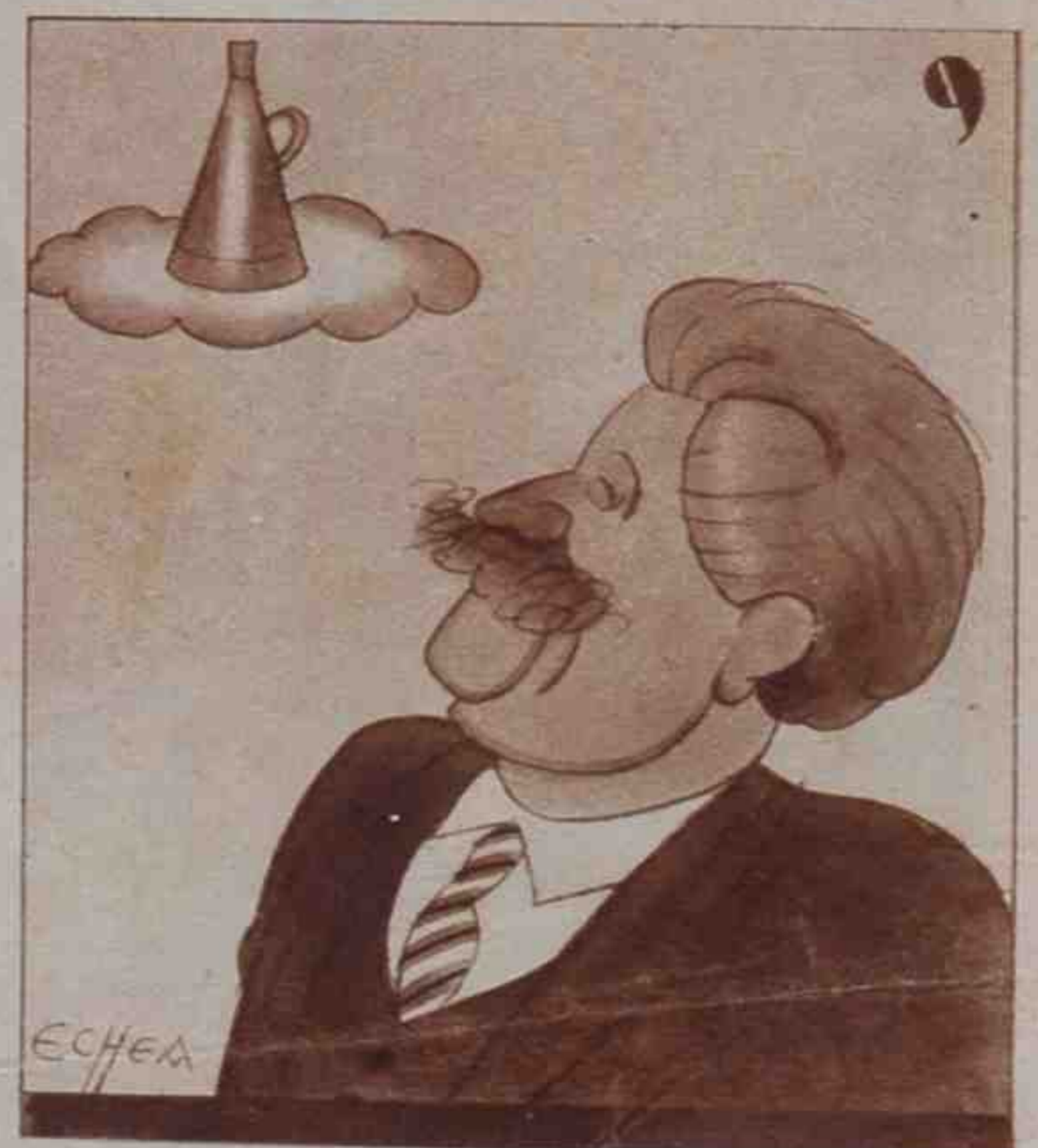
Cordero mira una nube y dice -El aceite sube