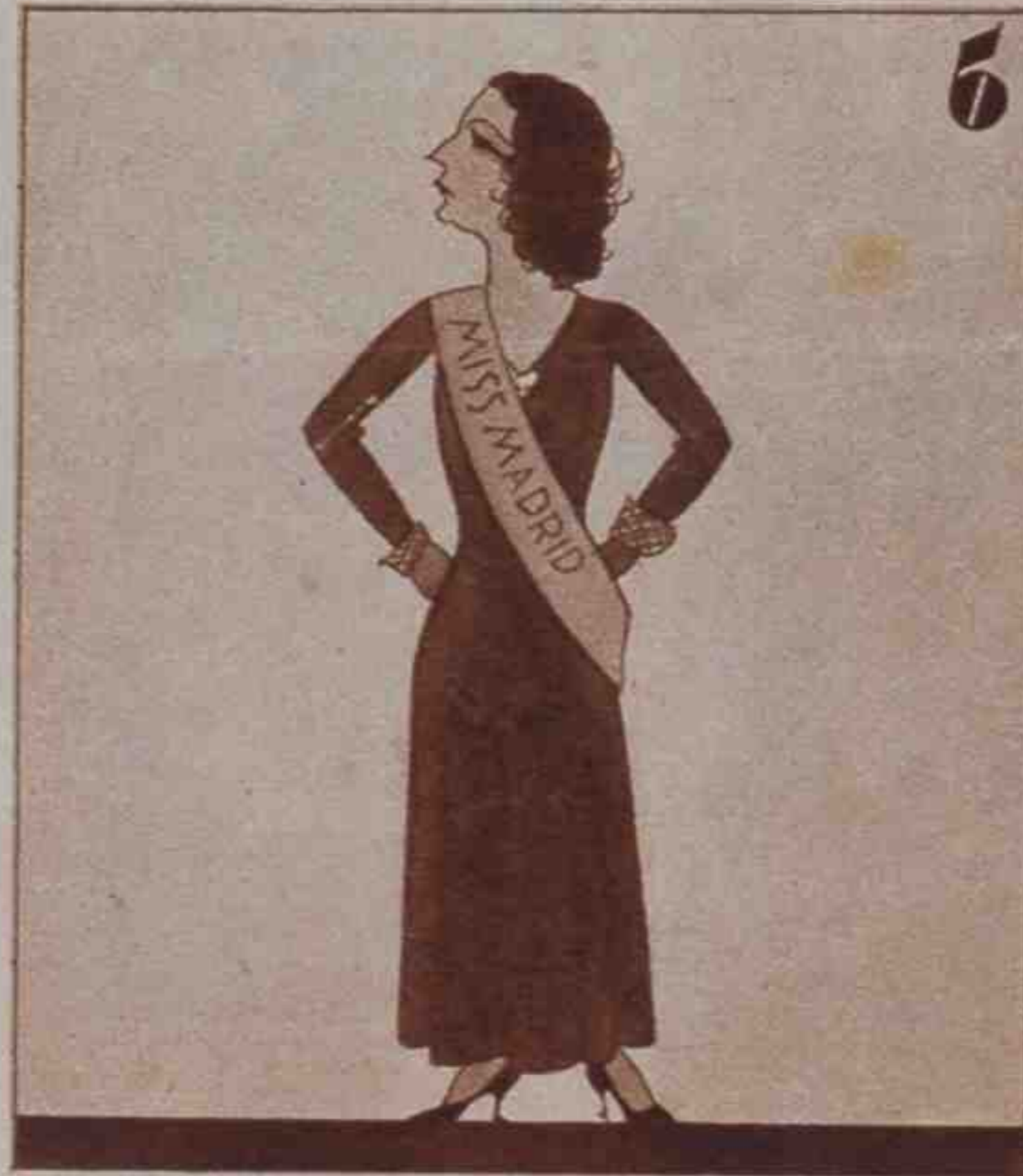
Lector: ¿no te quita el sueño este "ejemplar" madrileño?