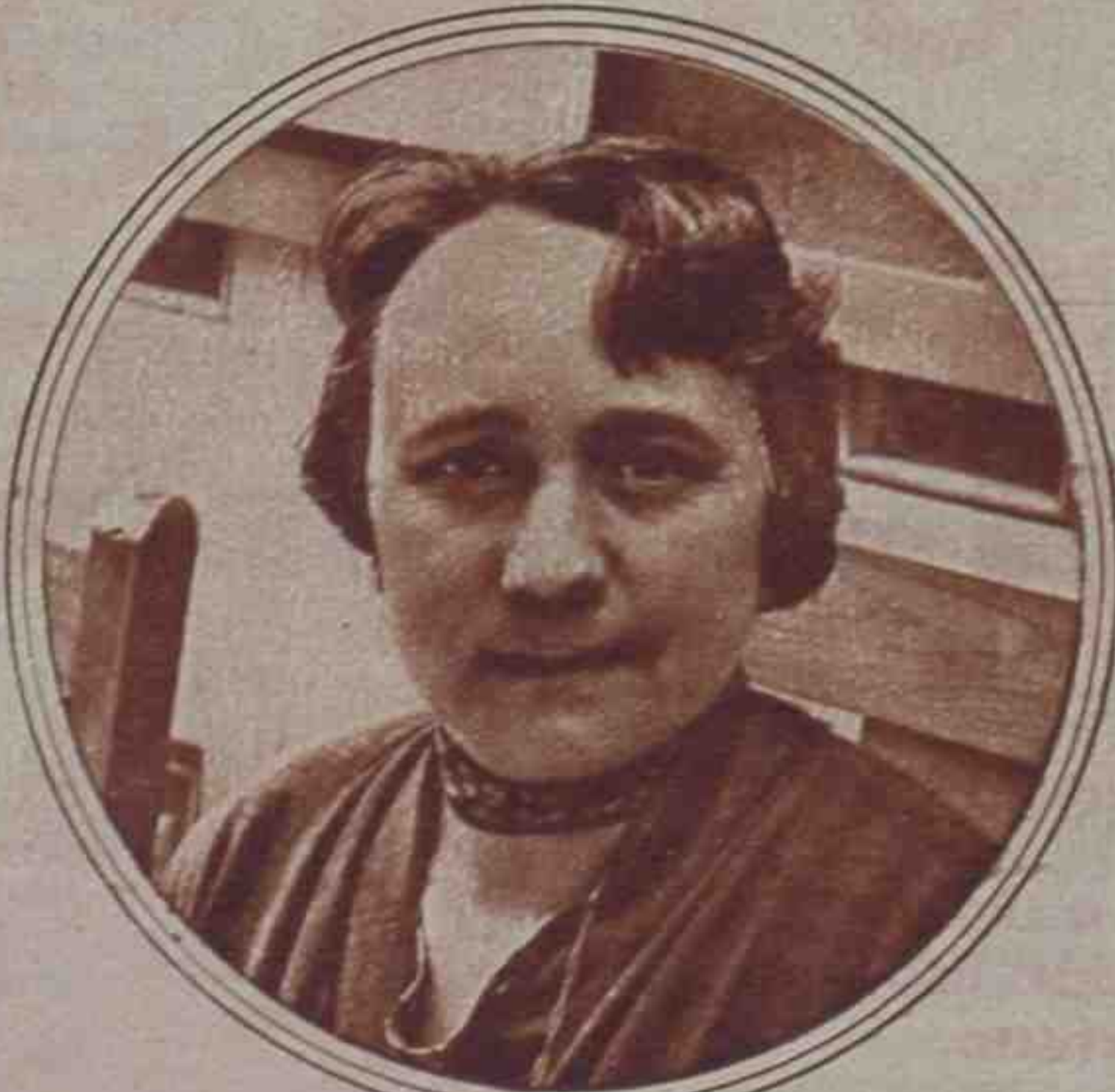
MARIA DE MAEZTU