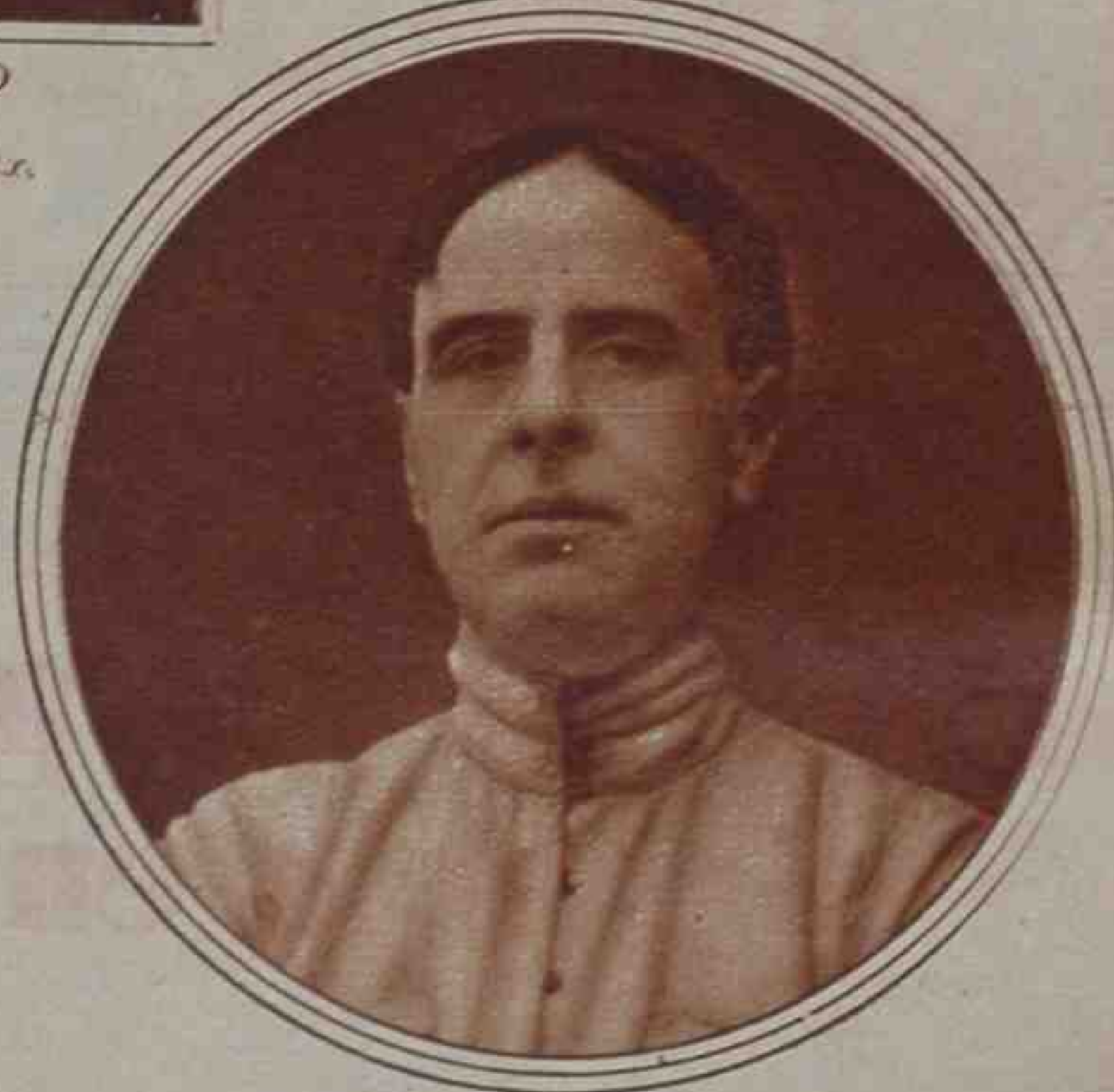
PEDRO DE REPIDE

Cualquiera que reúna estas condiciones: juventud relativa, gran fortuna, trato aristocrático, esposa distinguida y poseedora de tres idiomas; austeridad, ciencia, diplomacia, independencia de partidos y republicanismo demostrado.