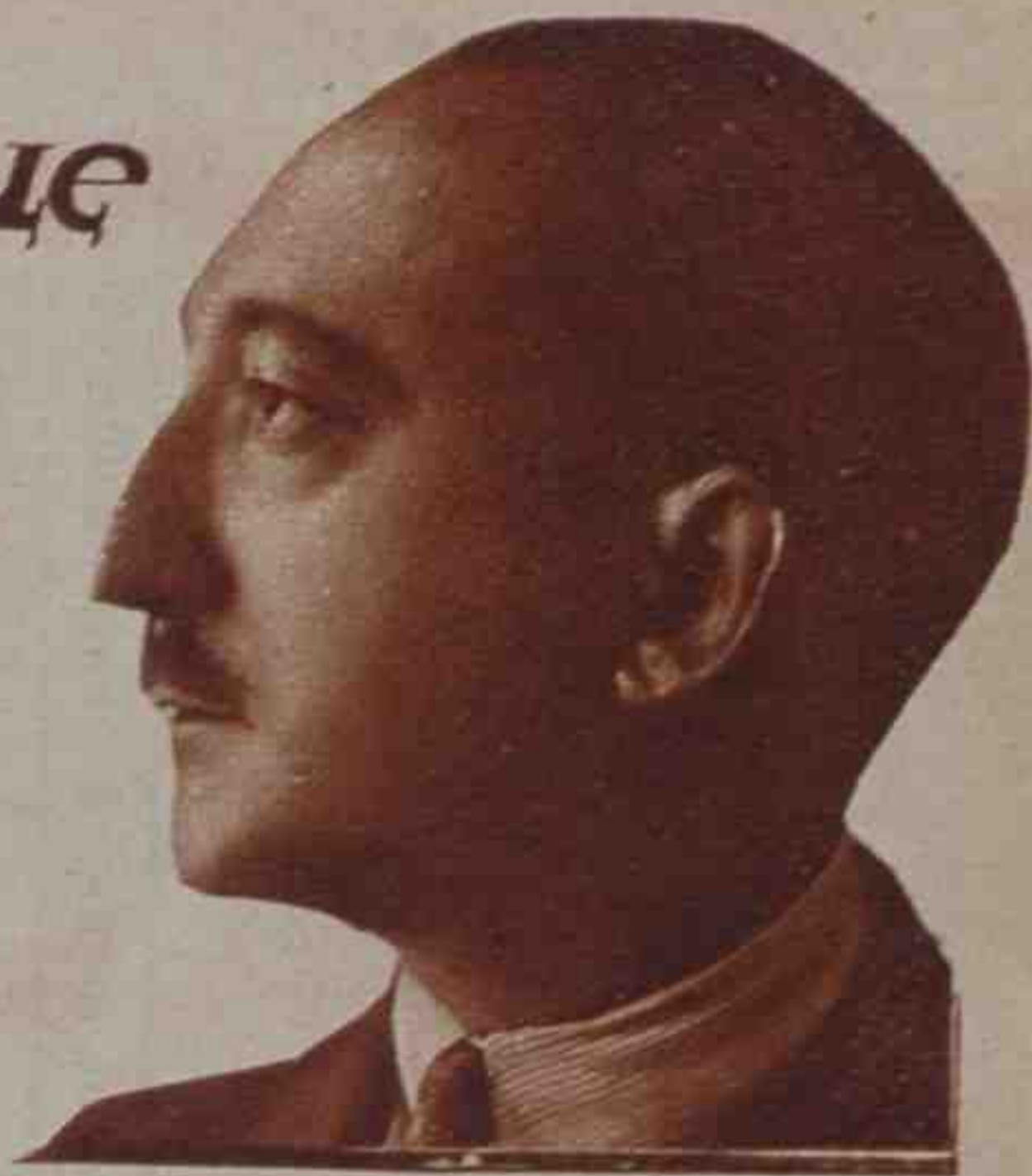
W. FERNANDEZ FLOREZ

Si se me preguntase cuál es el hombre más indicado para presidir el Gobierno republicano, contestaría, sin vacilar, que don Alejandro Lerroux. Pero no conozco exactamente el nombre del que, a mi juicio, debiera ser el presidente de la República. Yo votaría por uno de esos republicanos "de toda la vida", viejecito, que—si pudiese ser—hubiese escrito algunos libros de Derecho o de Ciencias, y del que se contasen anécdotas de honradez. Un hombre que ya estuviese más allá de la pasión. No puedo explicar por qué me parece que debería tener barba.