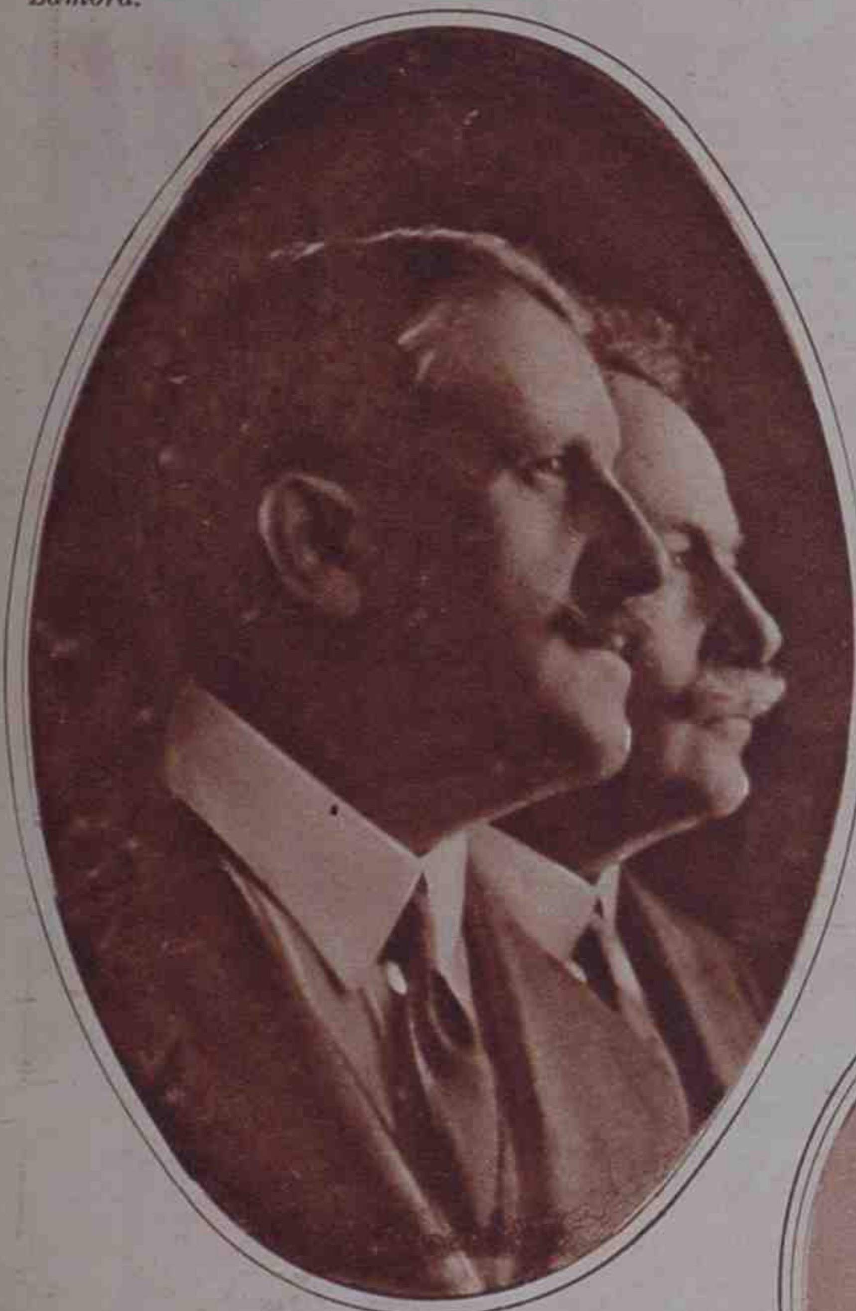
SERAFIN Y JOAQUIN ALVAREZ QUINTERO

Quisiera para nuestra República un presidente como el checoslovaco Masaryk. Por sus años, ya en la zona de la serenidad, toda pureza, sabiduría y justicia. La República española cuenta con un hombre así: don Manuel B. Cossio.