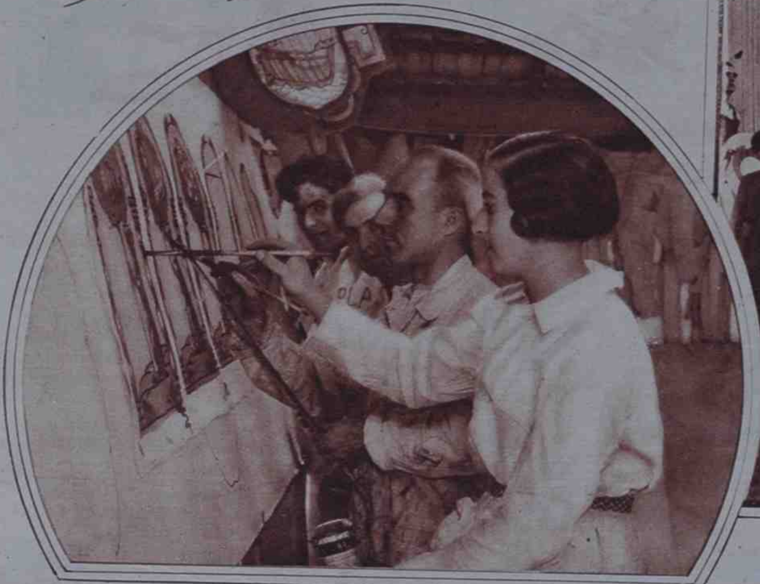
Un grupo de decoradores—entre los que, por cierto, figura una linda pintora—interpreta afanosamente una serie de emblemas a base del "oso y el madroño".

Cinco talleres de Madrid trabajan febrilmente en la construcción de las carrozas, trofeos, estandartes, faroles, etc., que han de figurar en la gran cabalgata y la fantástica retreta que se organizan por iniciativa del Ayuntamiento madrileño para festejar la proclamación de la República. Más de trescientos operarios especializados se ocupan en estas tareas. Una legión de sastres trabajan en la confección de los trajes. Otras tantas costureras afánanse por tener hechos en el corto espacio de tiempo que aun falta las gualdrapas de los caballos, colgaduras y guarniciones. Y de los trabajos que realicen todos estos obreros surgirán las dos fiestas más atractivas y populares de los festejos.