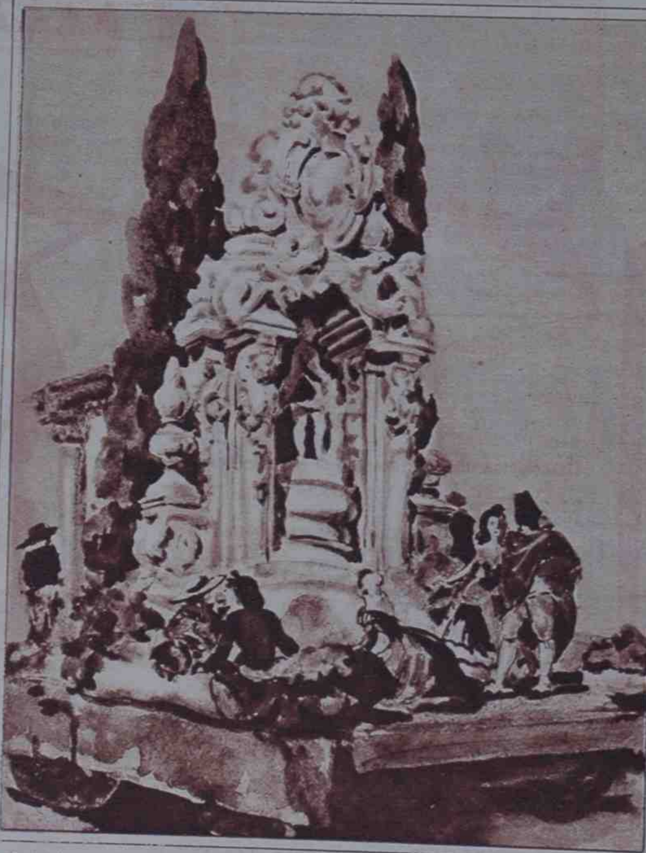
Madrid estará representada en la fiesta de las regiones por el típico templete del puente de Toledo. A su alrededor, chisperos y manolitas se agruparán en un conjunto de color y de gracia.

ces que hasta el momento no son más que unos grandes entrepaños de madera, con rejas y arcos que serán mudéjares.