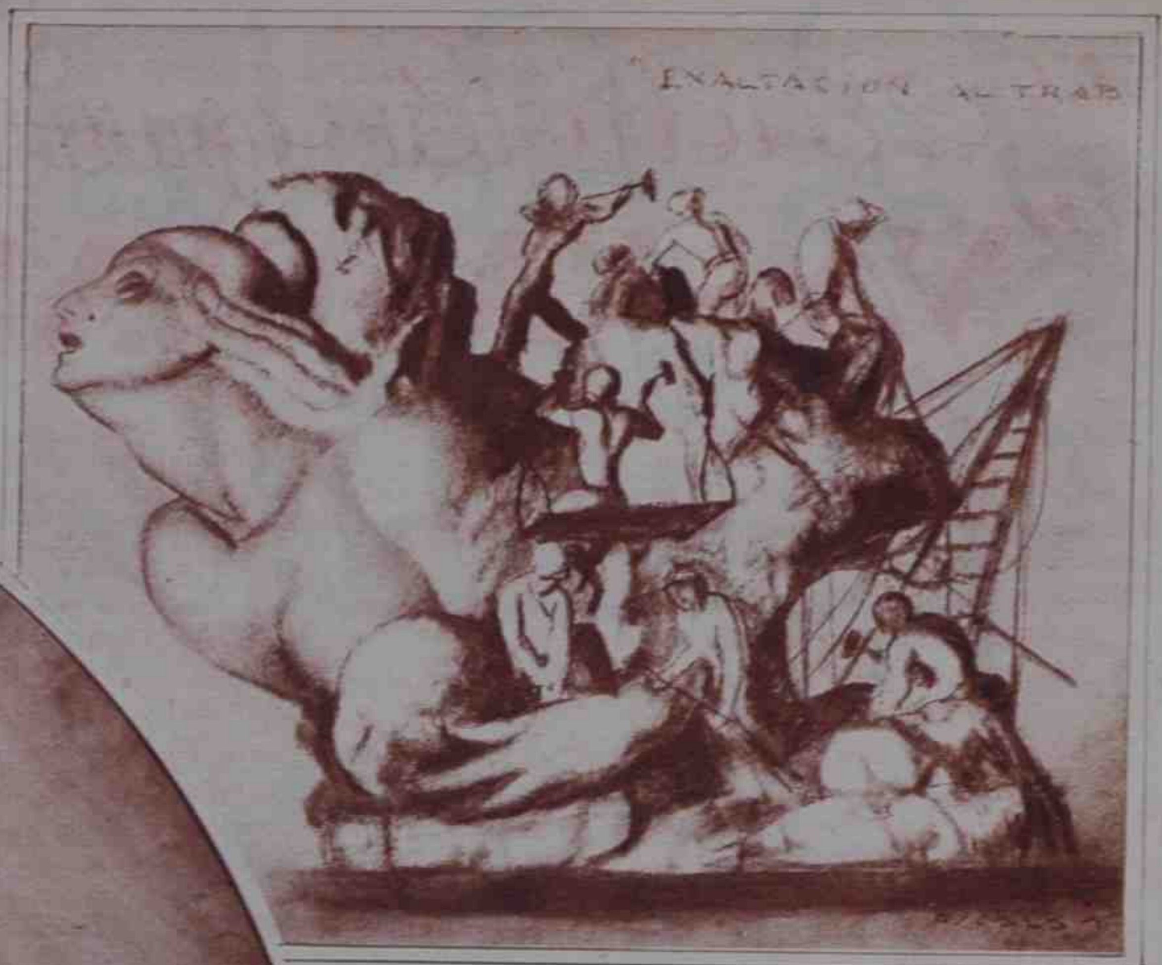
Boceto de la carroza "Exaltación del trabajo", en- cargada por la Diputación para la gran cabalgata que desfilará con motivo de las fiestas de la Re- pública.

La más expresiva será la de la Diputación, simbólica de la naciente República.