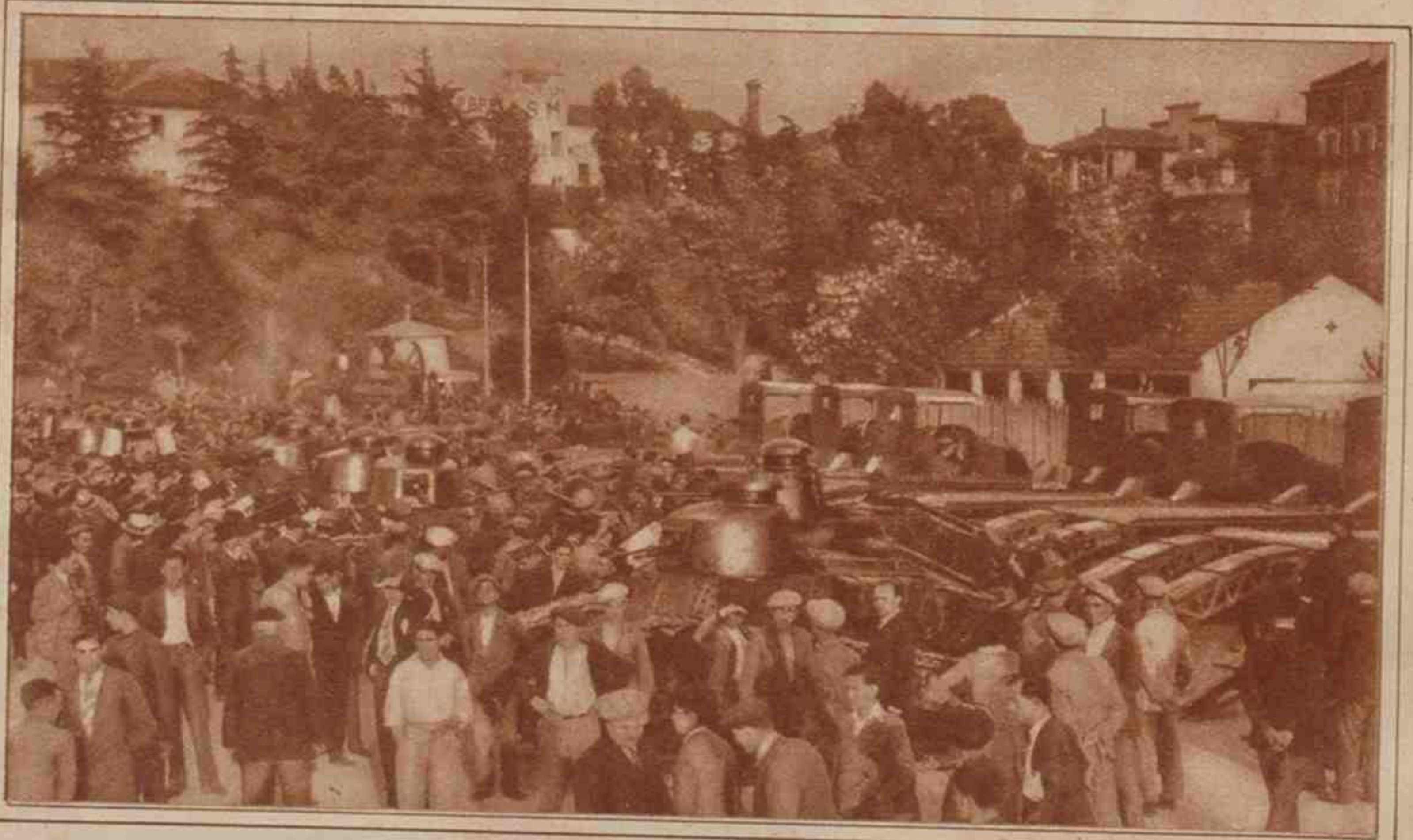
Los tanques tortugas, llevados en camiones hasta la plaza de Oriente, son objeto de la curiosidad del público.

CHADY Los perfumes de gran lujo, vendidos sueltos. Avenida Peñalver, 3.