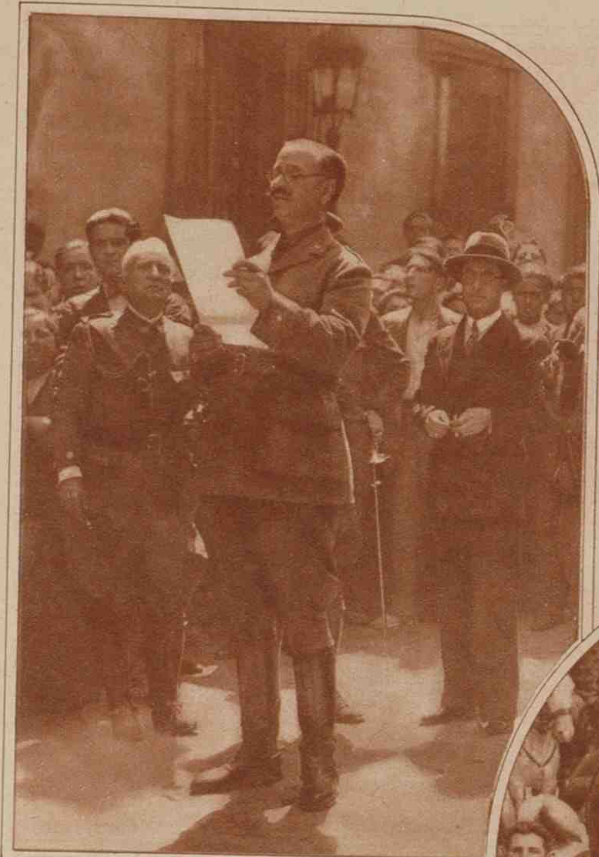
El general Queipo de Llano leyendo el bando de la proclamación del estado de guerra.