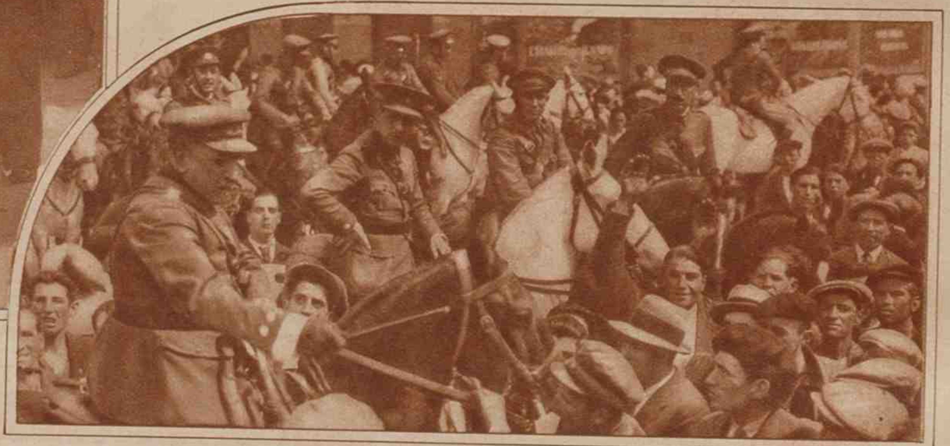
Fuerzas de Caballería asegurando la vigilancia en las calles de la capital.