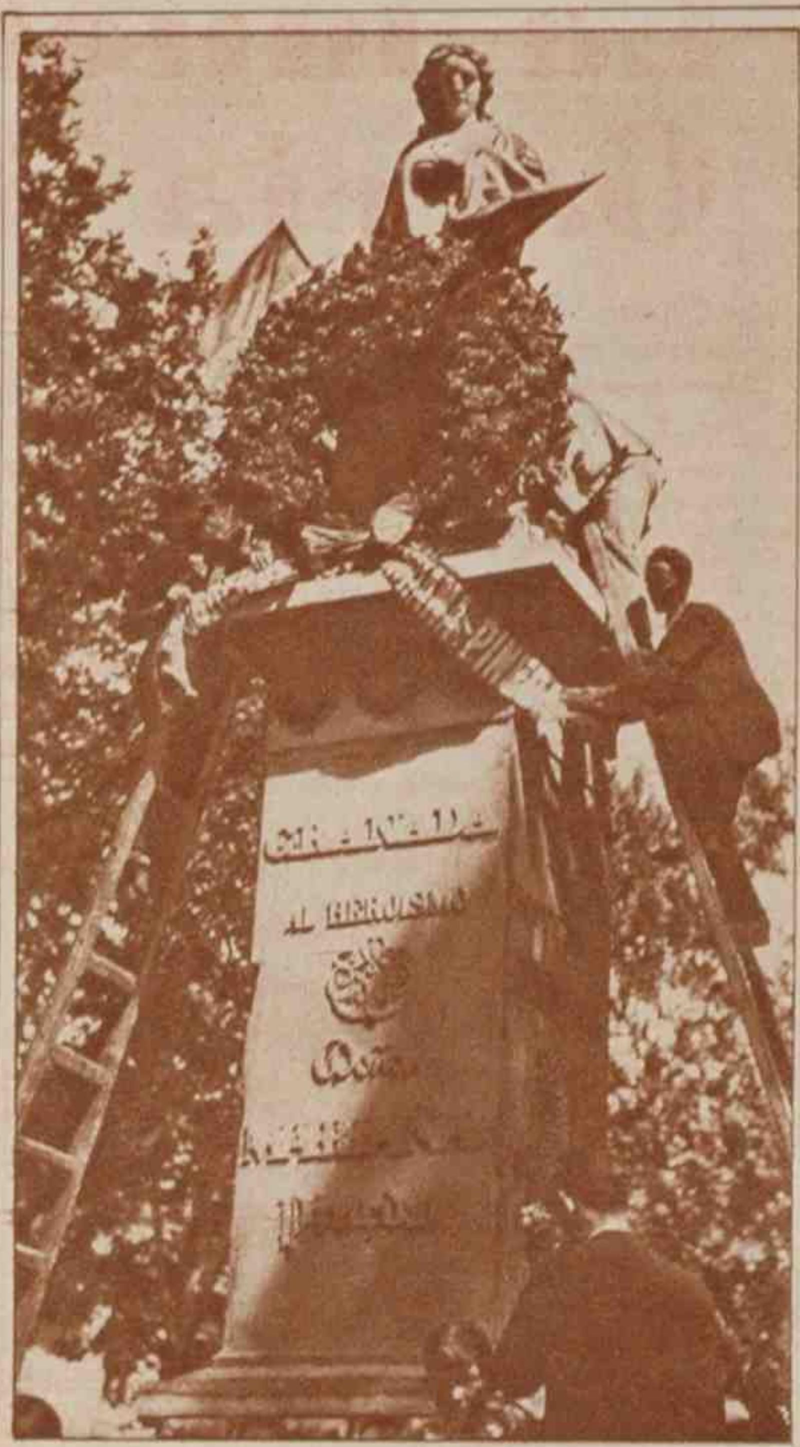
Con motivo de la fiesta del Primero de Mayo, Granada ha tributado un homenaje a la memoria de doña Mariana Pineda, la heroína de la libertad, condenada a muerte por las autoridades fernandinas. En las fotos, la cabeza de la manifestación, formada por las señoras que ejercen cargos administrativos, dirigiéndose al monumento a Mariana Pineda, en el cual colocaron una corona.