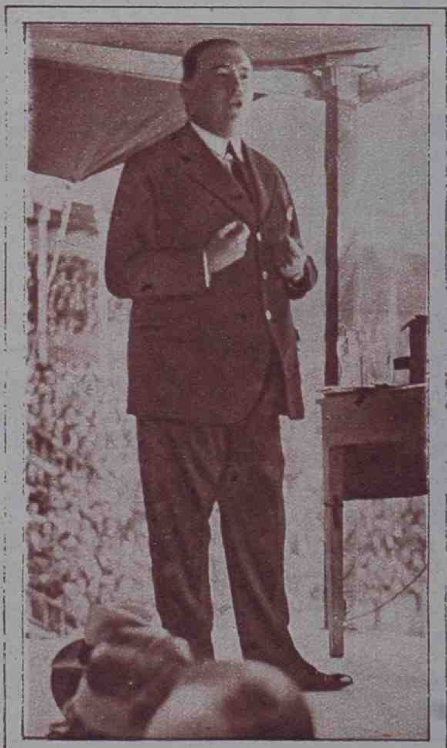
Don Diego Martínez Barrios, del Partido republicano de Andalucía.