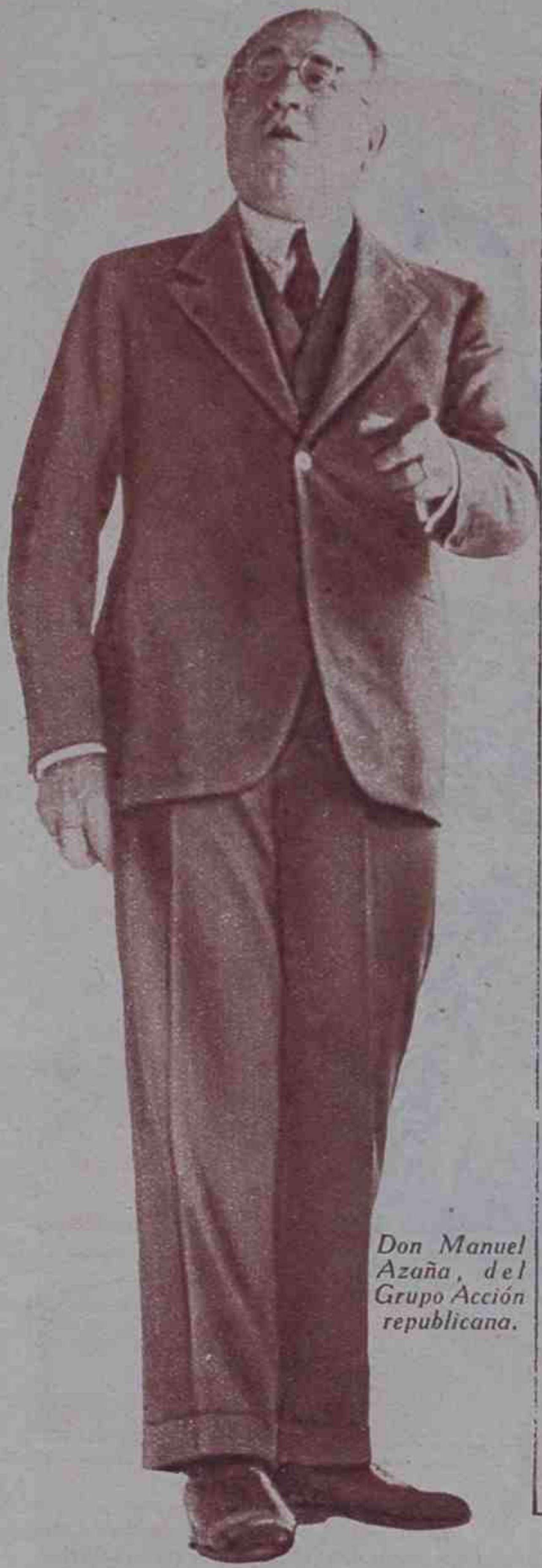
Don Manuel Azaña, del Grupo Acción republicana.