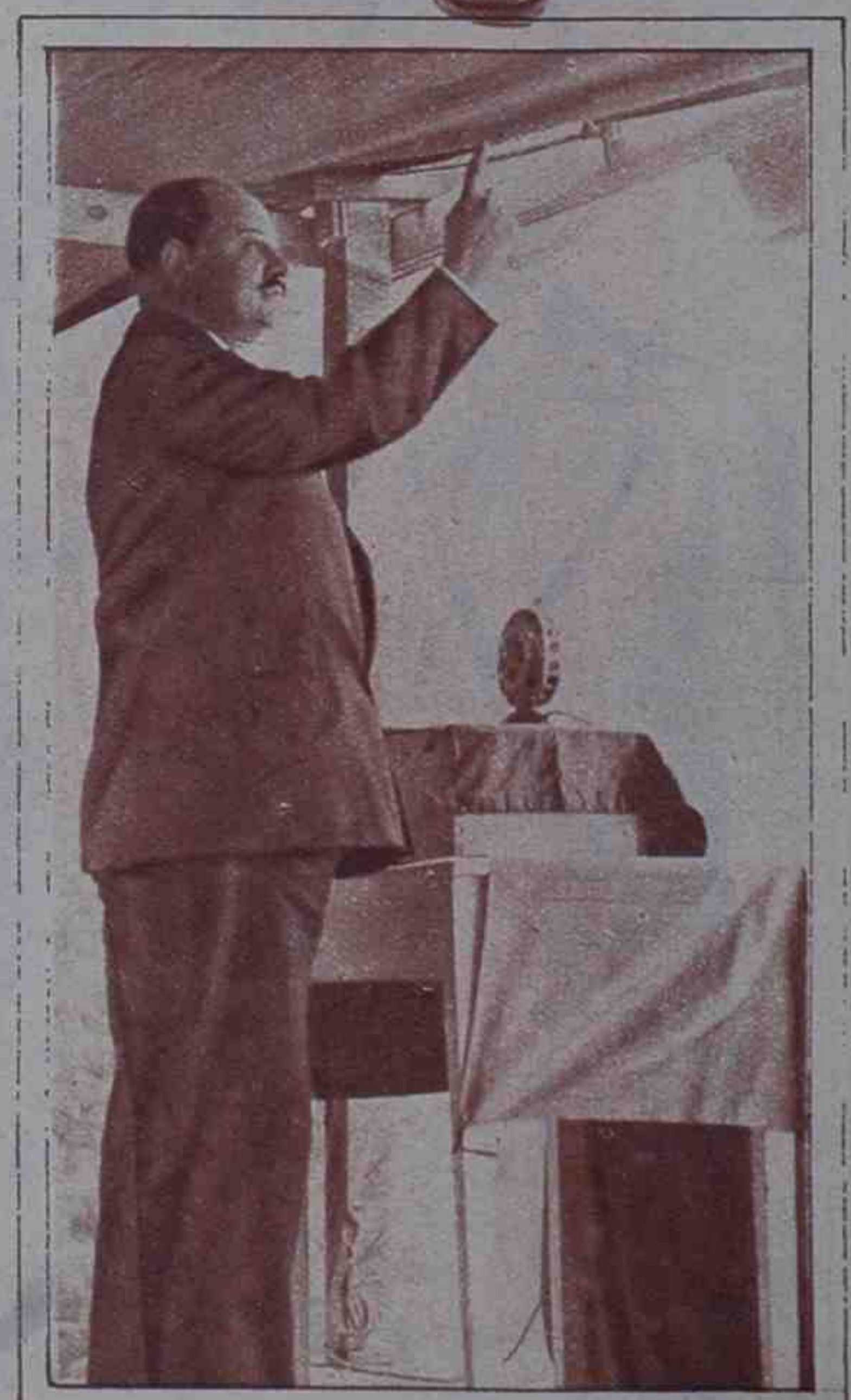
Don Gerardo Abad Conde, del Partido republicano de Galicia.