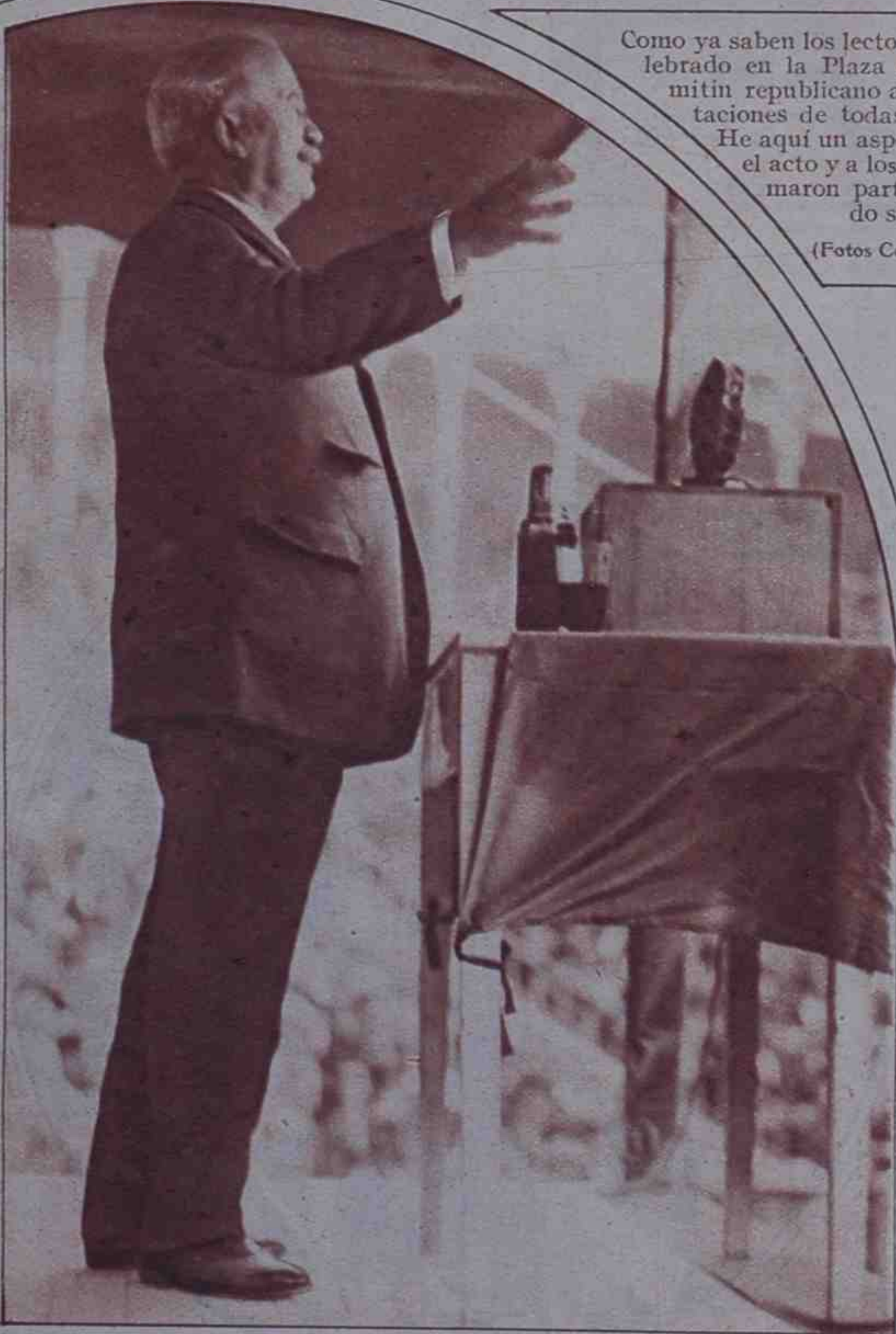
Don Alejandro Lerroux, del Partido radical.