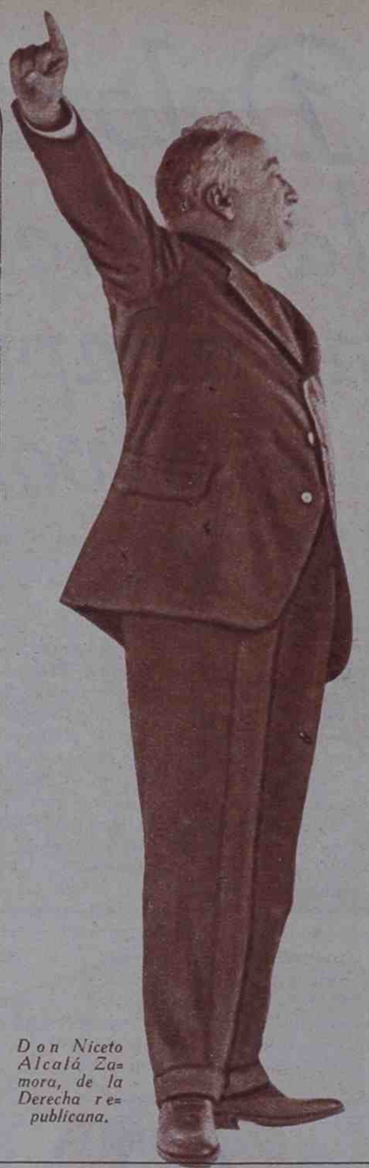
Don Niceto Alcalá Zamora, de la Derecha republicana.