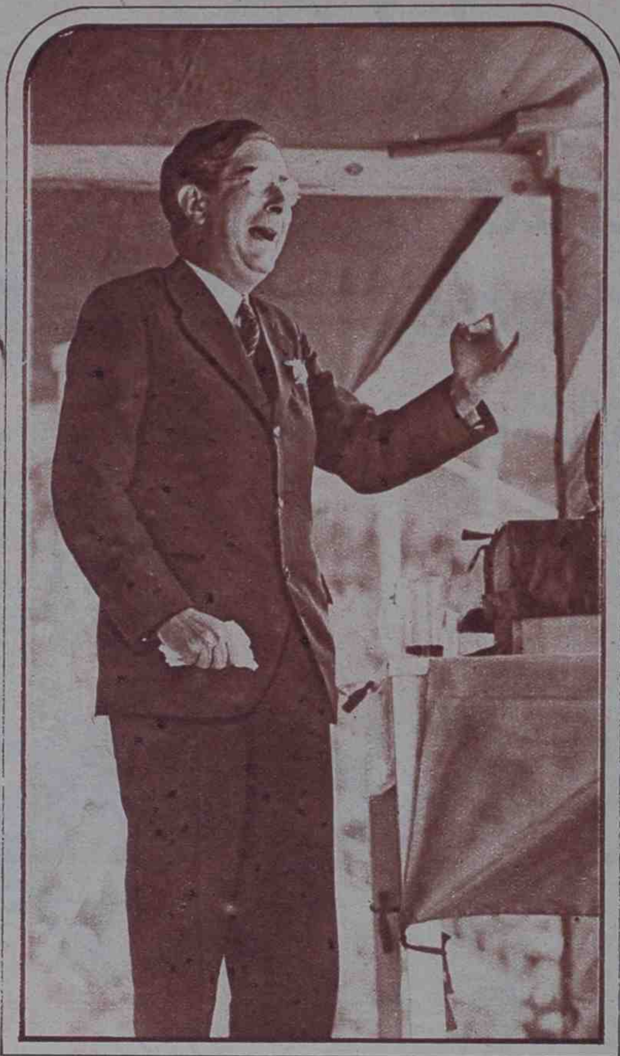
Don Marcelino Domingo, del Partido radical socialista.