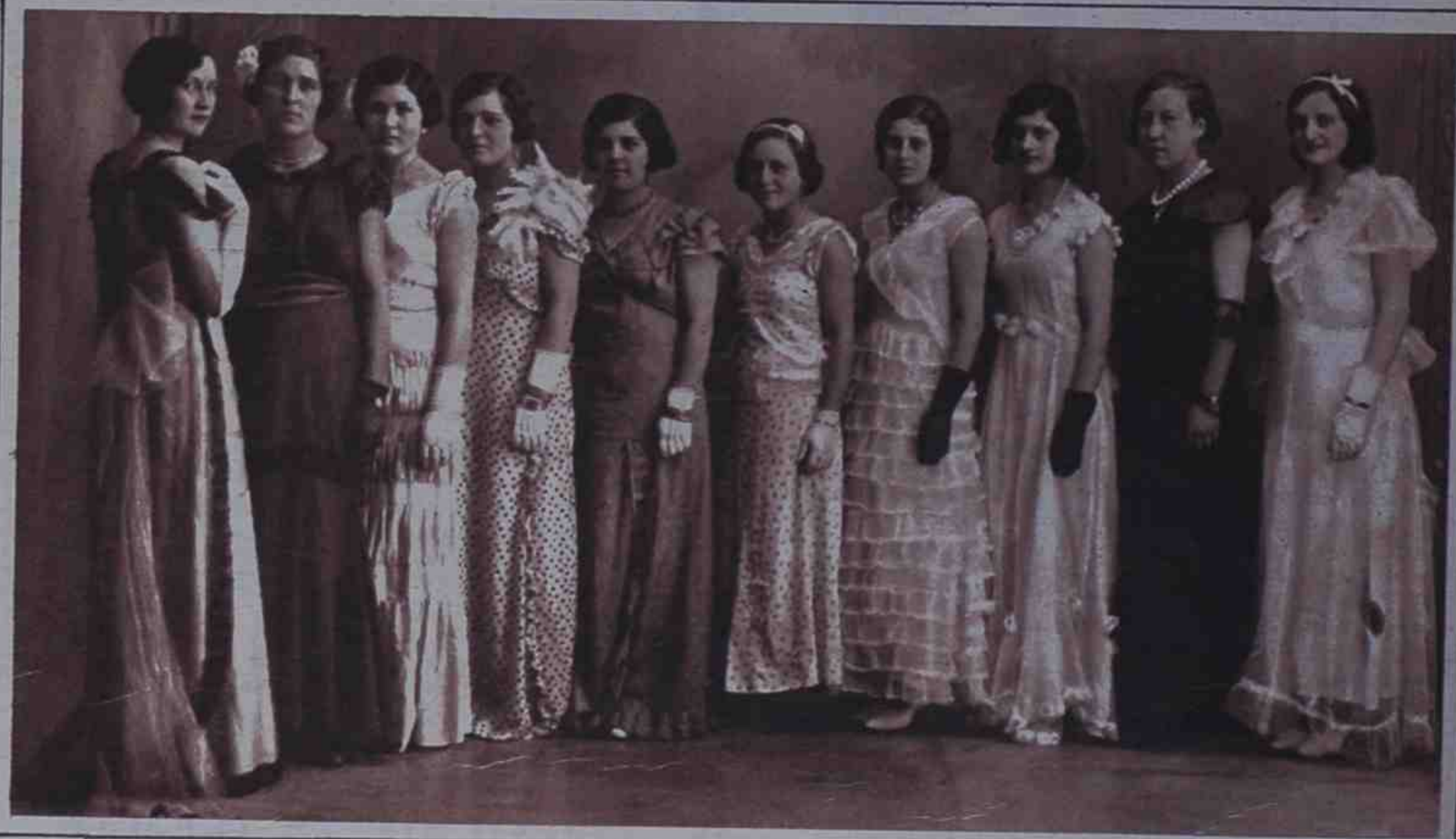
En Gerona se ha celebrado con gran éxito un Concurso del Vestido de Cuatro Pesetas, iniciativa de ESTAMPA, que ha encontrado felices imitadores en casi todas las provincias de España. Vean aquí las señoritas premiadas en dicho Concurso.