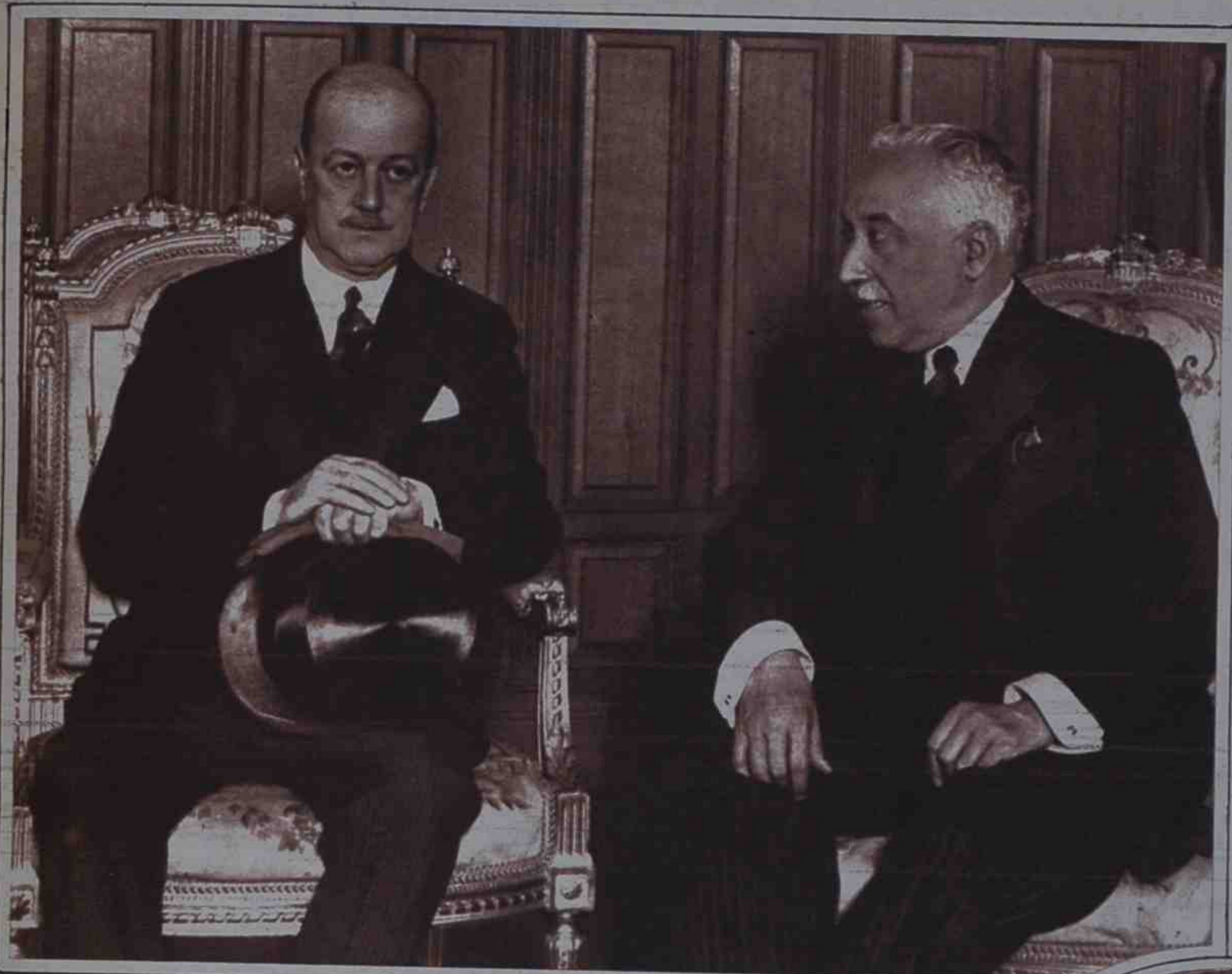
El vicepresidente de la República Argentina, don Julio A. Roca, que ha sido huésped ilustre de Madrid, durante la visita al Jefe del Estado español.