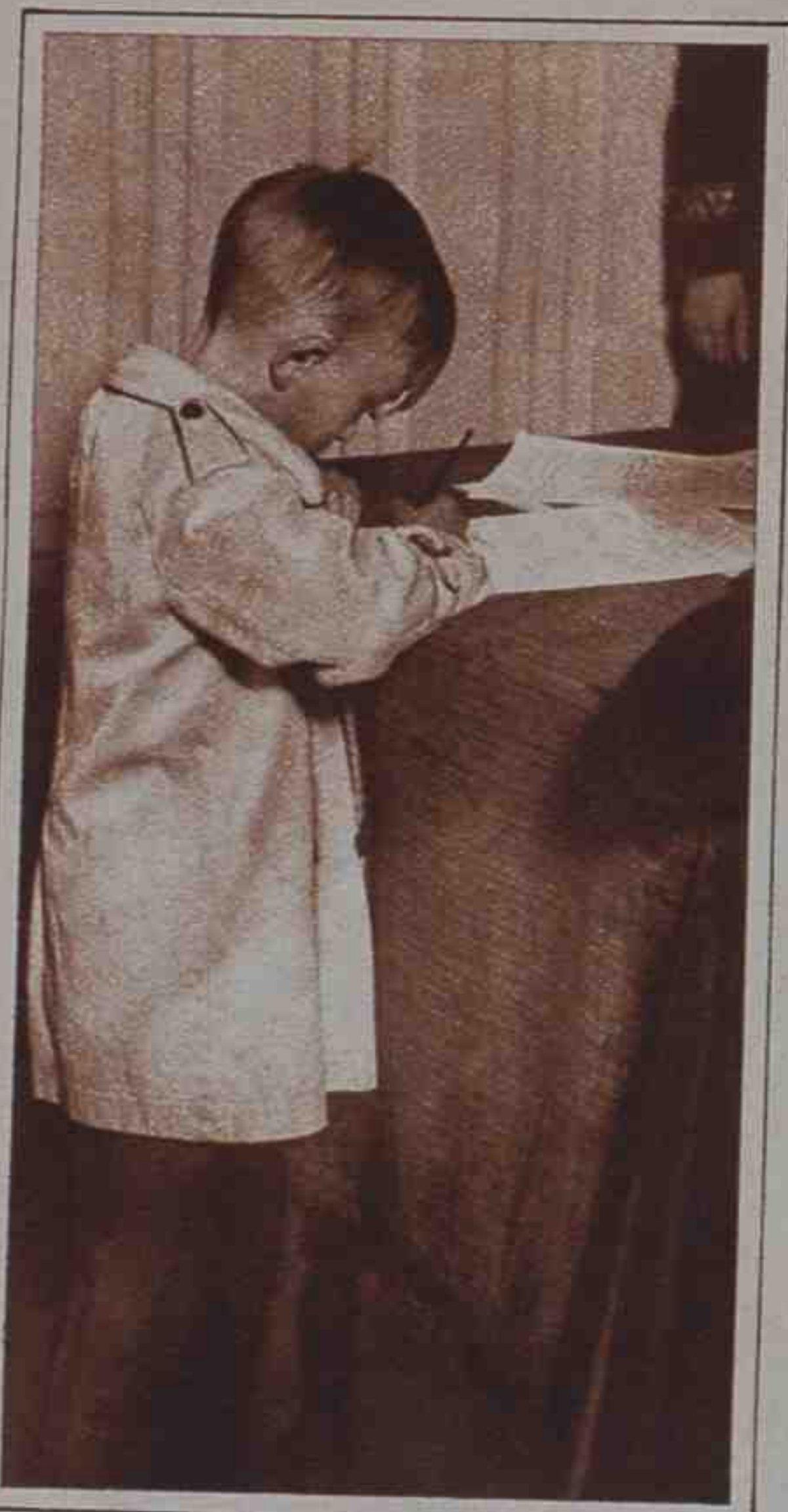
A firmar los pliegos puestos en Palacio con motivo de las fiestas, acudieron todas las clases sociales y hasta pequeñines...