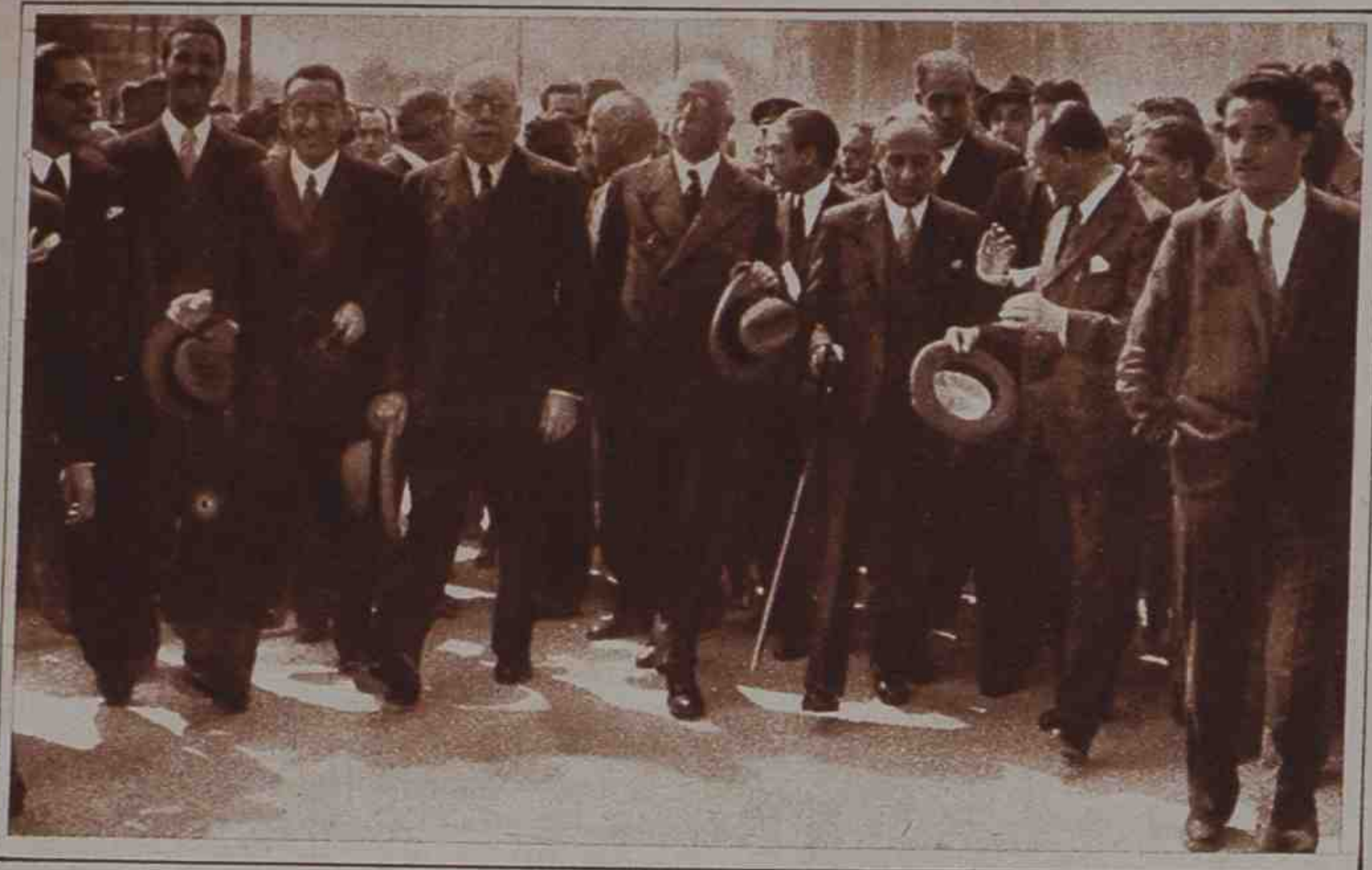
El Jefe del Estado, con el Gobierno, rodeados del público, recorren el nuevo trayecto abierto a la circulación, después de inaugurar la prolongación de la Castellana.