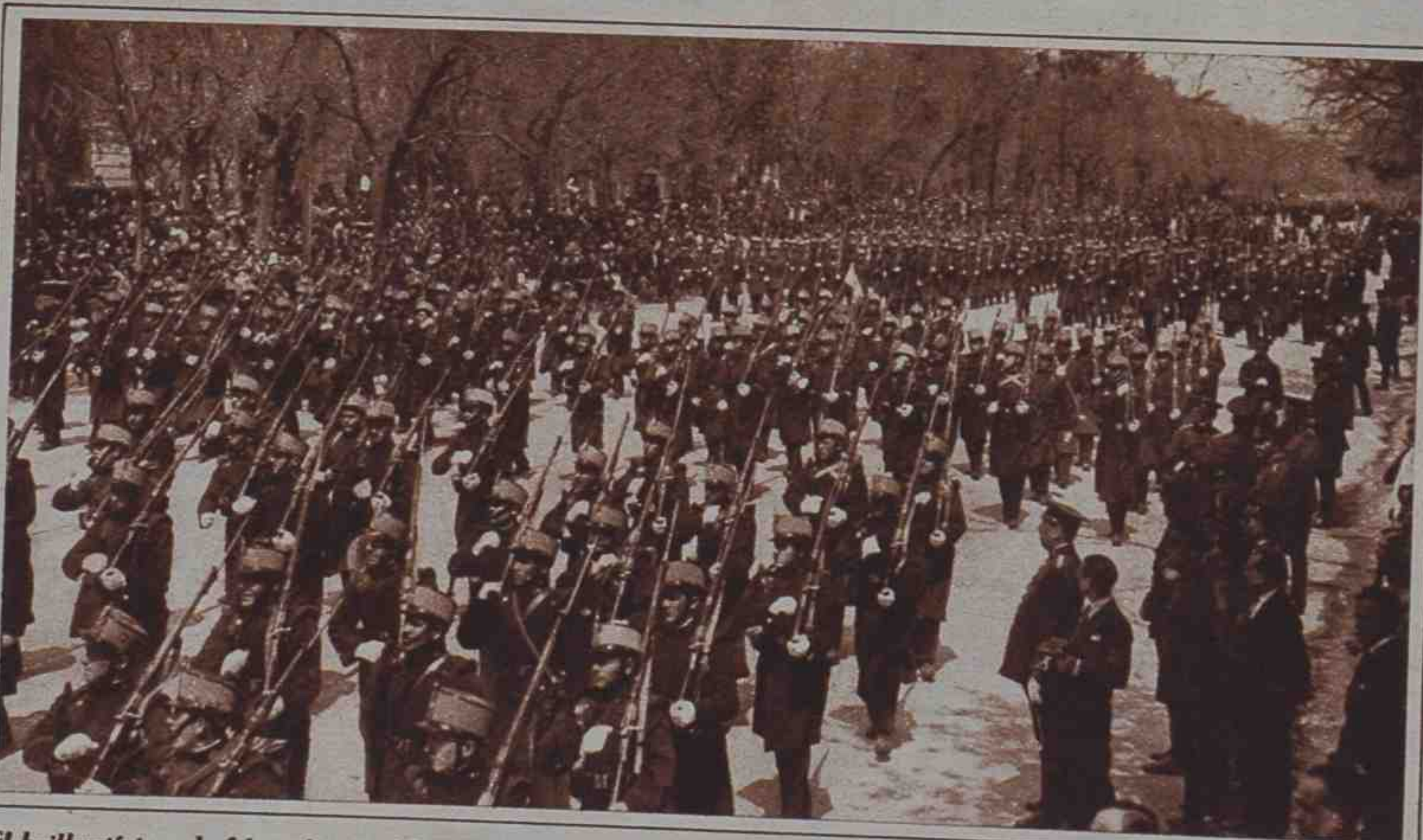
El brillantísimo desfile militar celebrado en la Castellana el domingo, durante el cual el numeroso público que acudió a presenciarlo aclamó con entusiasmo al Jefe del Estado, al Gobierno y a las tropas.

Eleuterio GRANDES ALMACENES FUENCARRAL, 18. LUNA, 11 O'DONNELL, 40 Y 42 (RETUAN) APARTADO, 12318