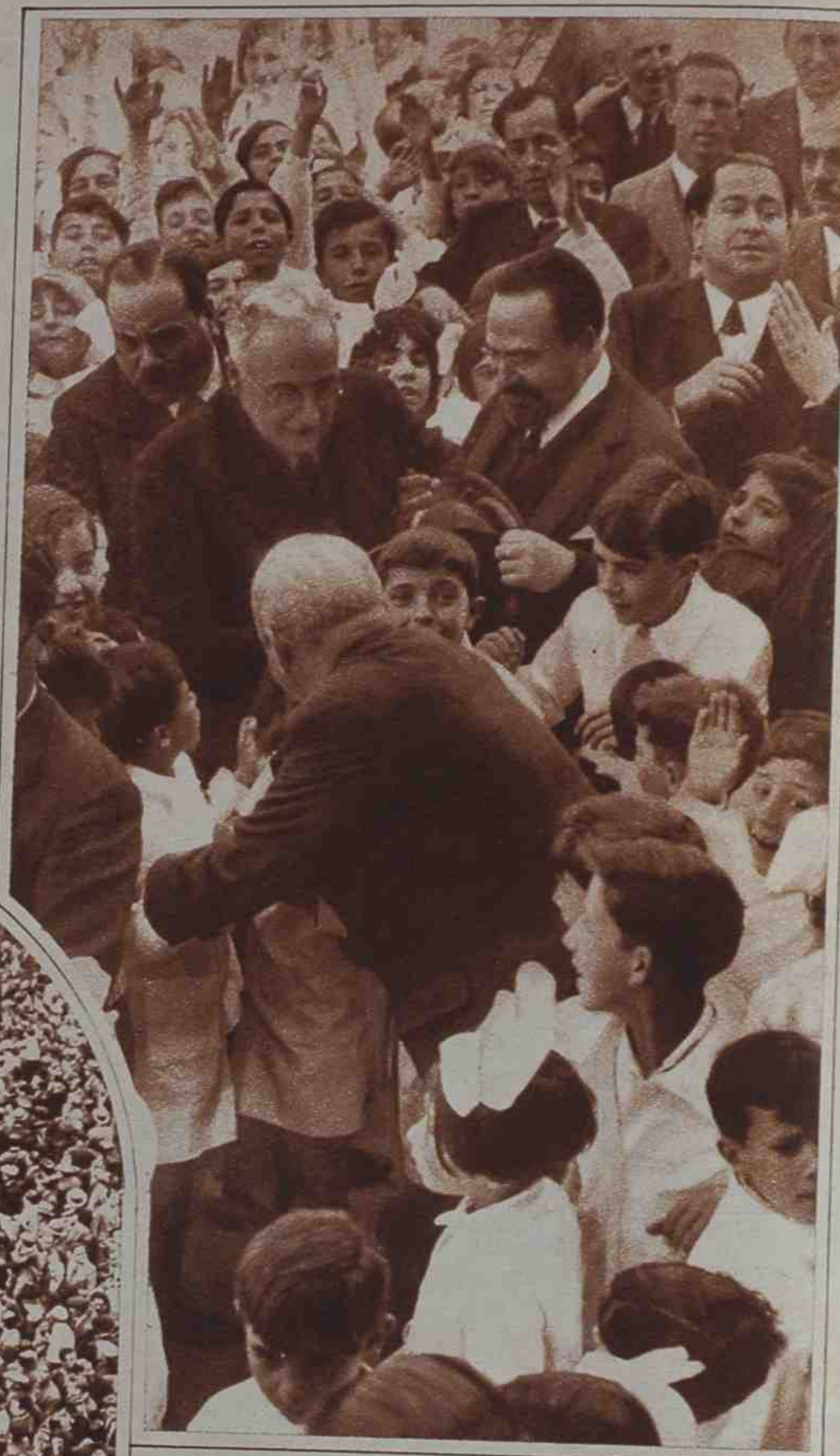
De todos los actos organizados para festejar el segundo aniversario de la República, sin duda ninguno tan grato a Su Excelencia como éste de la inauguración de los nuevos grupos escolares, que le ha permitido convivir unos momentos con los niños.