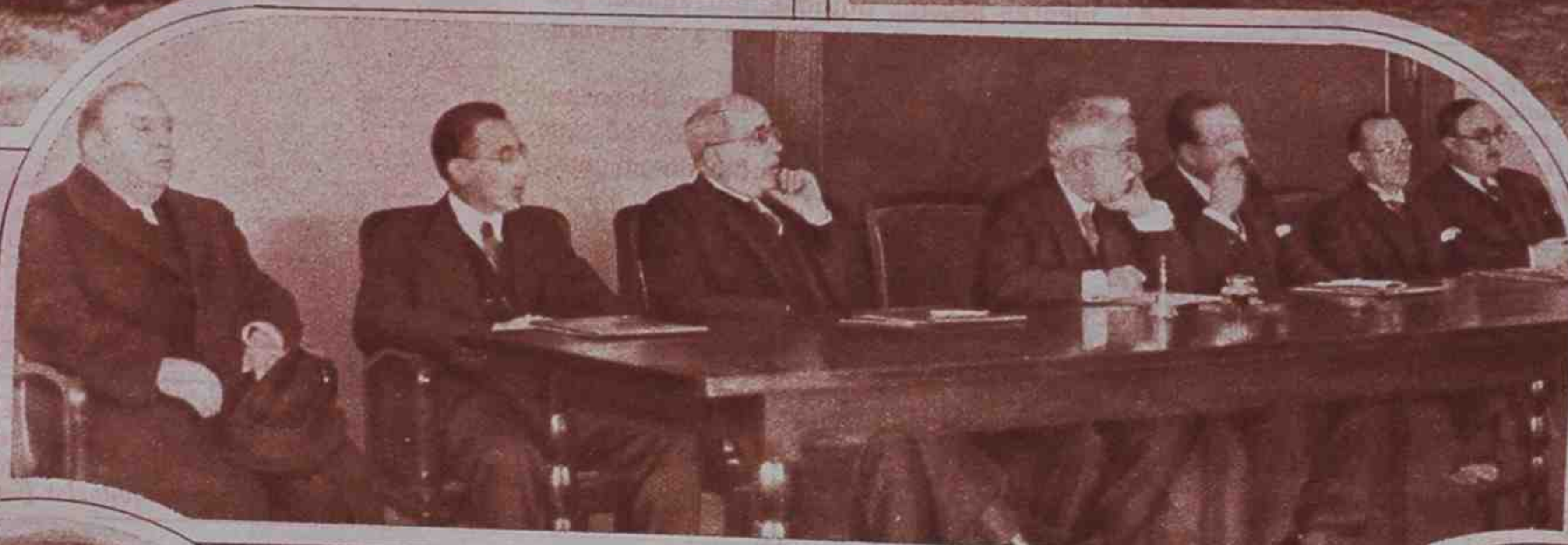
El domingo pasado se inauguró el edificio de la Facultad de Filosofía y Letras en la Ciudad Universitaria. Después hubo una brillante demostración deportiva, a la que asistió el Presidente de la República.