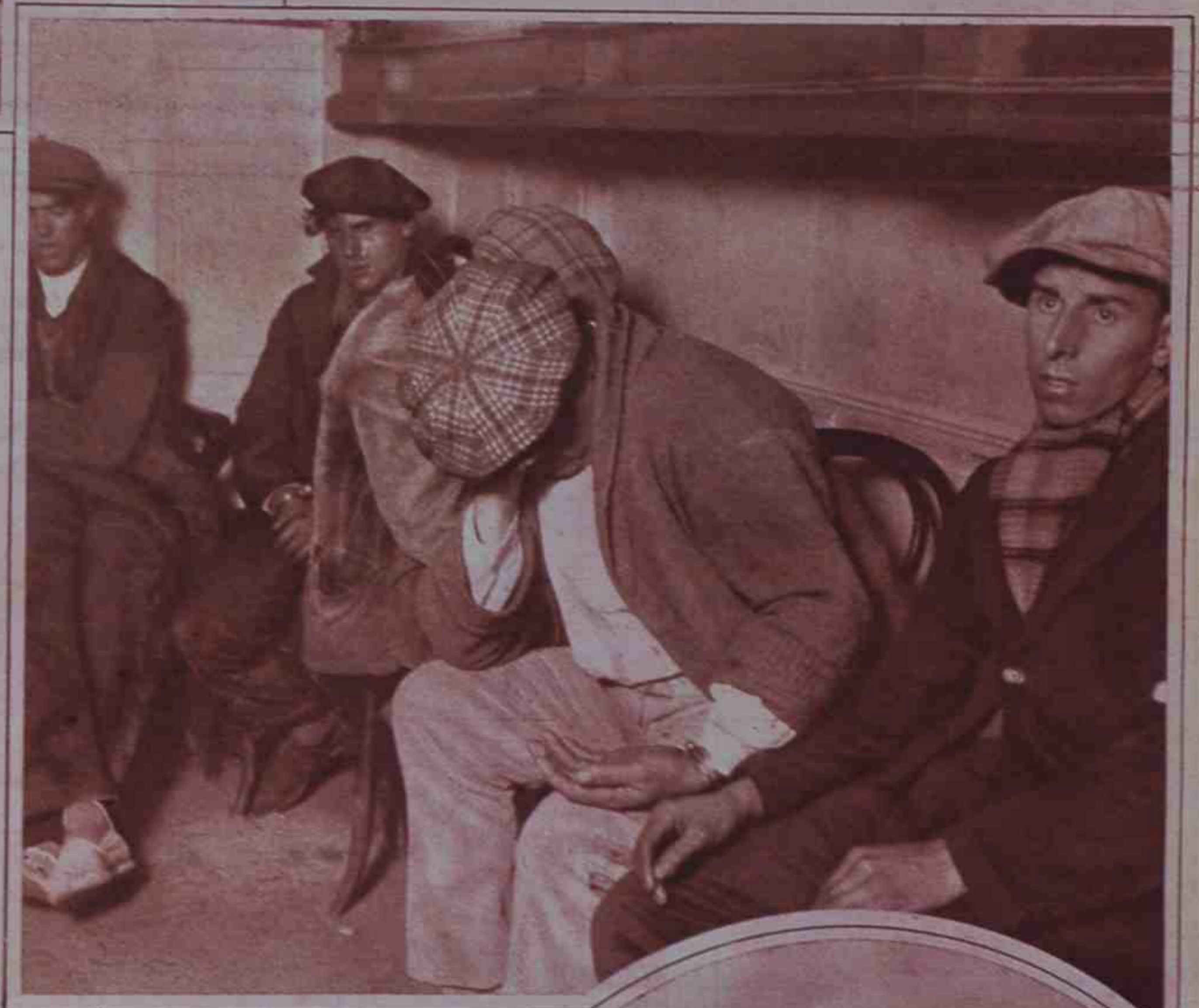
En Ripollet, después de un vivo tiroteo, la fuerza pública detuvo a varios individuos que fueron trasladados a Barcelona. Hubo que lamentar dos muertos y varios heridos.