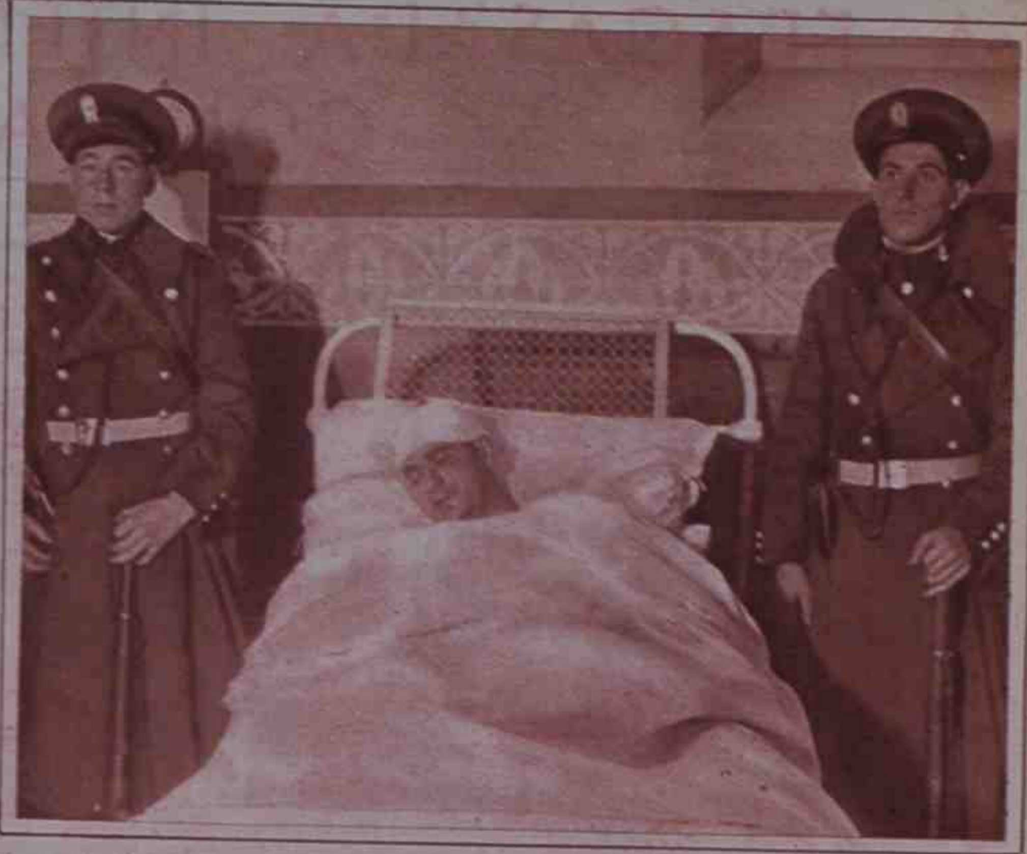
Después del tiroteo en las Ramblas, los guardias de Asalto vigilan a los revolucionarios heridos que han sido trasladados al hospital.