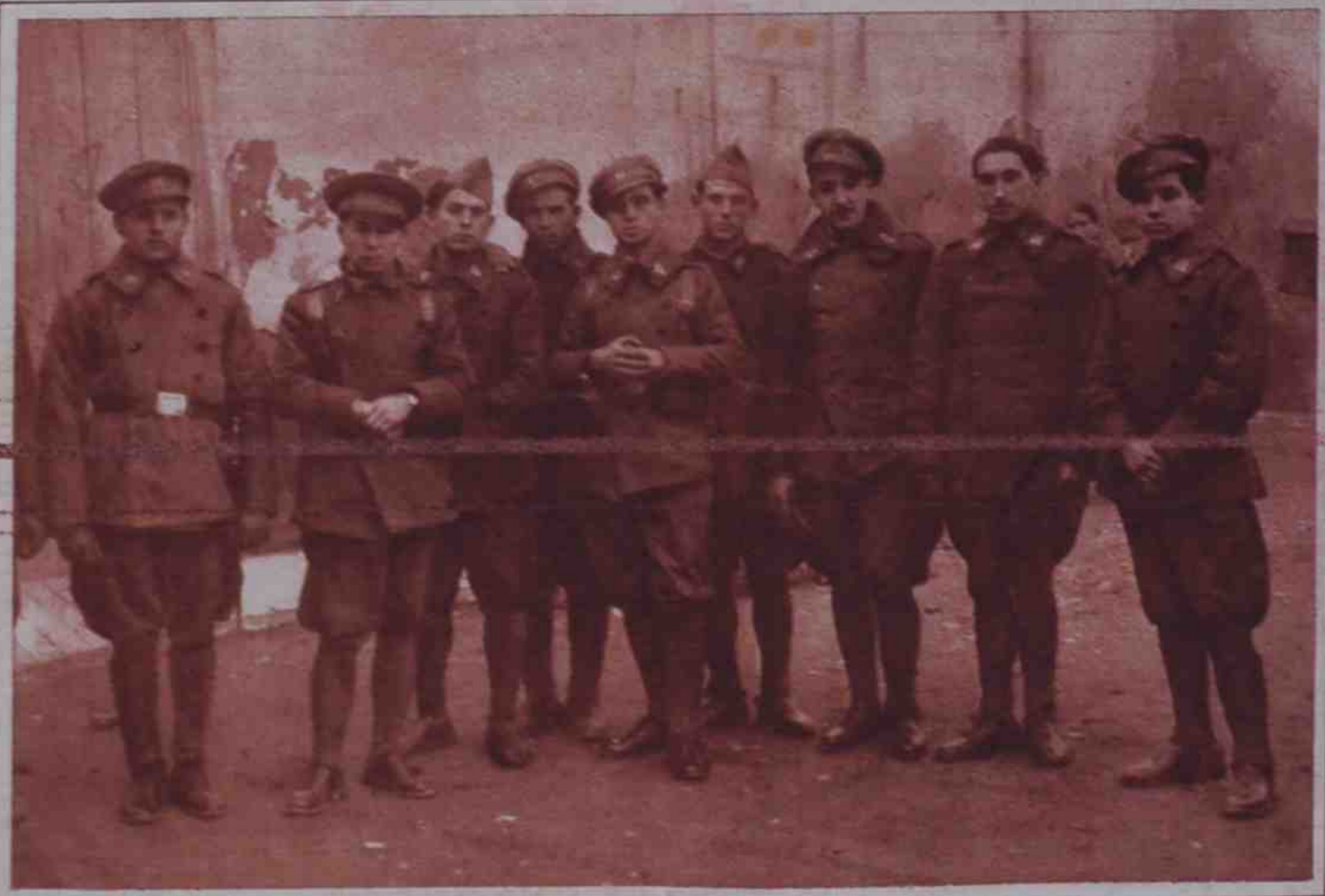
Soldados que componían la guardia en el cuartel de la Panera, y que lucharon valientemente rechazando a los extremistas.