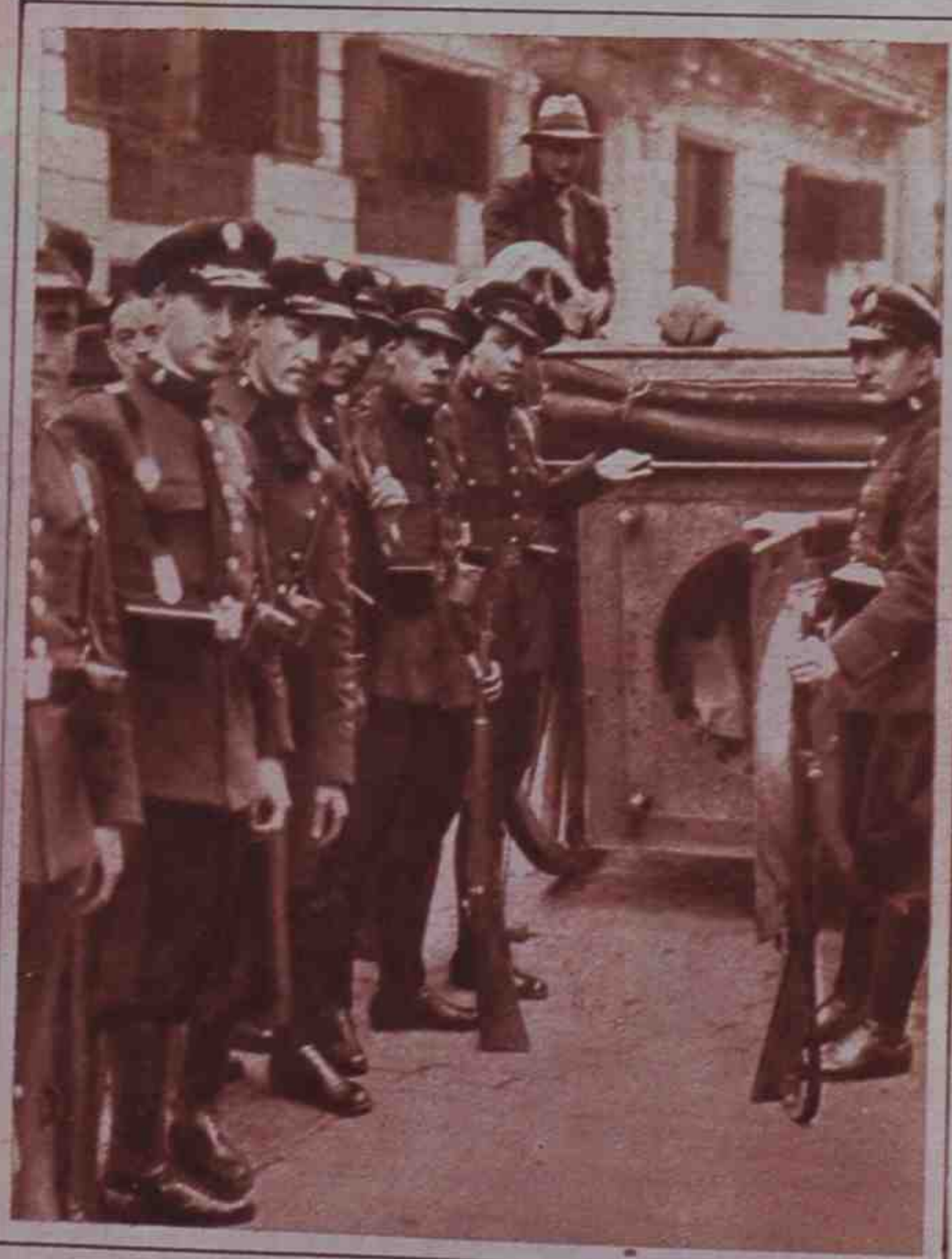
En Barcelona, como en el resto de España, la mayoría de los extremistas han procurado deshacerse cuanto antes de las bombas que les habían sido entregadas. La Policía las ha recogido en un armón blindado.