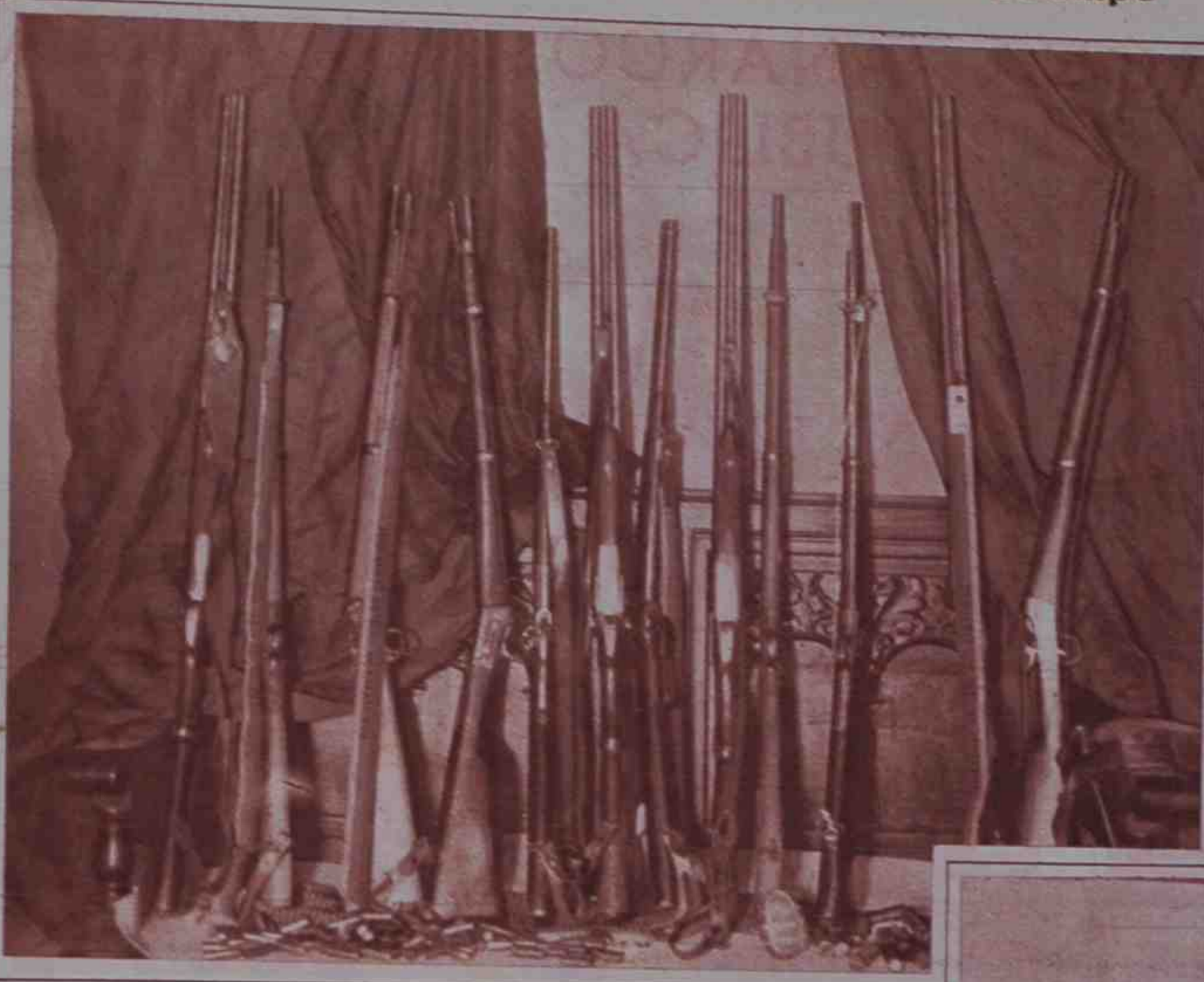
Armas y banderas rojas abandonadas por los revoltosos que se hicieron fuertes en Sardañola.