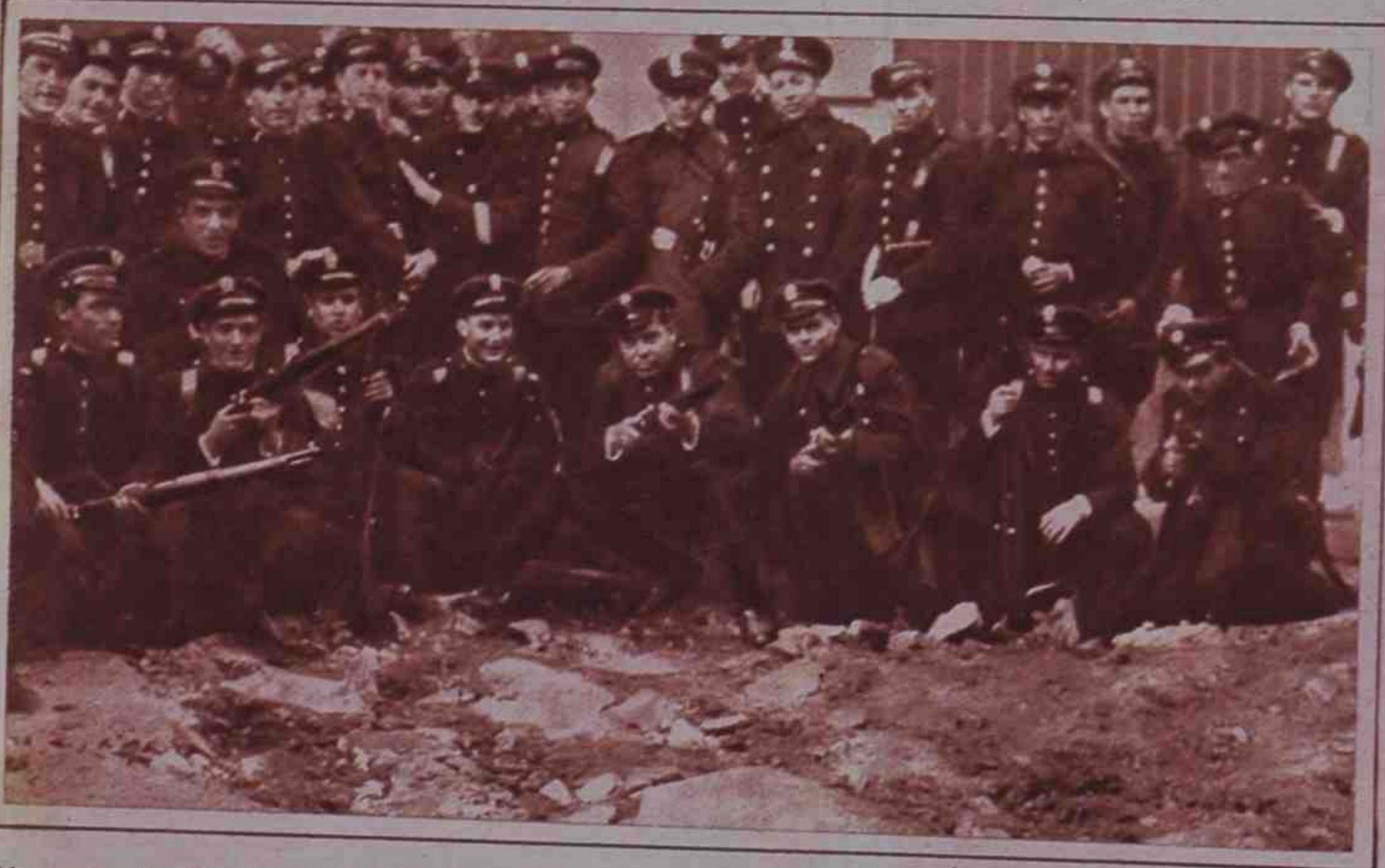
En Barcelona, la Policía, la Guardia civil y las fuerzas de Asalto, vigilaron intensamente y sofocaron con gran rapidez los numerosos intentos de asalto y desorden.