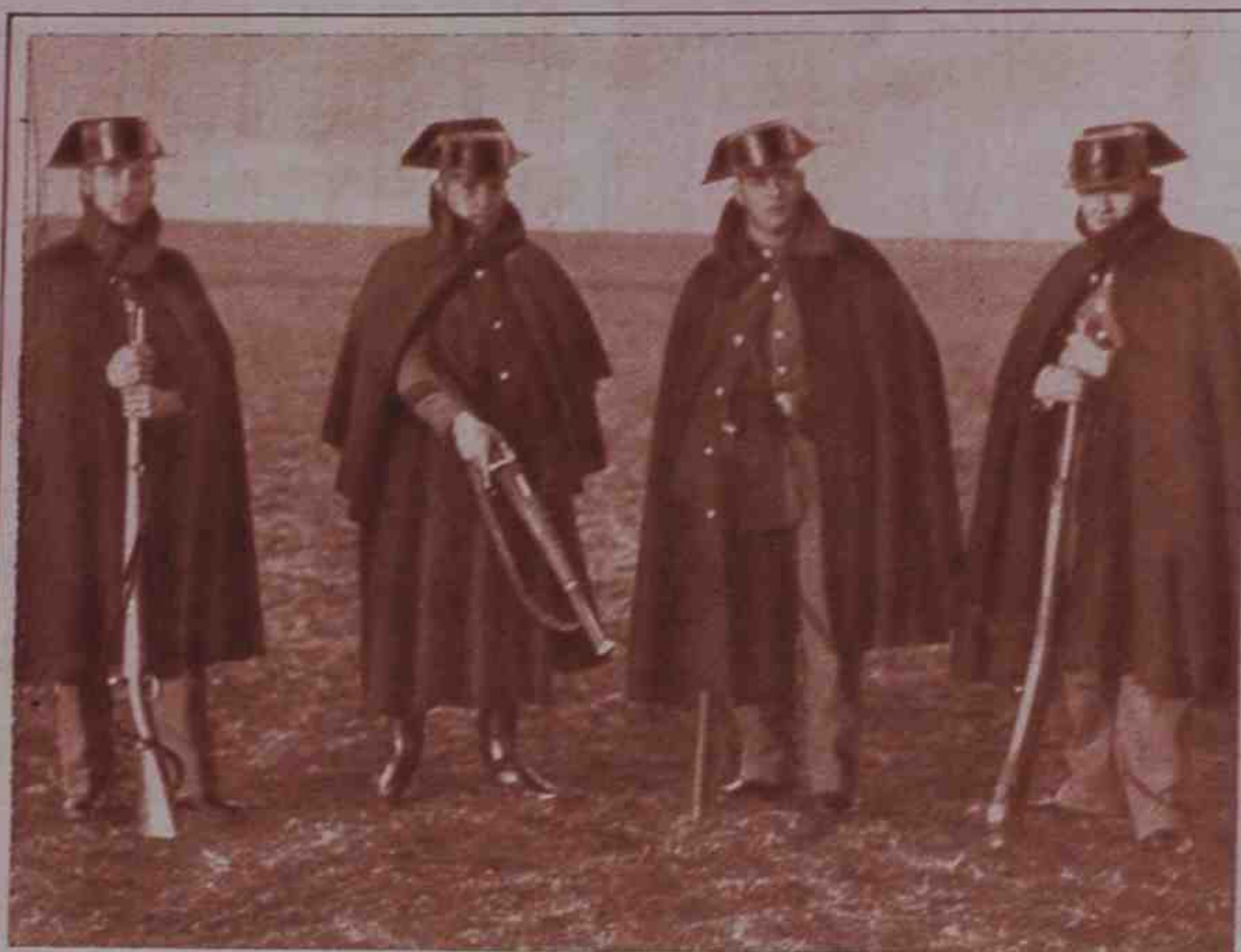
El domingo pasado se produjo en Madrid y en otras ciudades españolas un movimiento extremista, rápidamente sofocado por fortuna. Hubo varios muertos y numerosos heridos por parte de la fuerza pública y de los revoltosos. Estos soldados pusieron en fuga a un grupo que intentaba apoderarse de la estación de Cuatro Vientos.