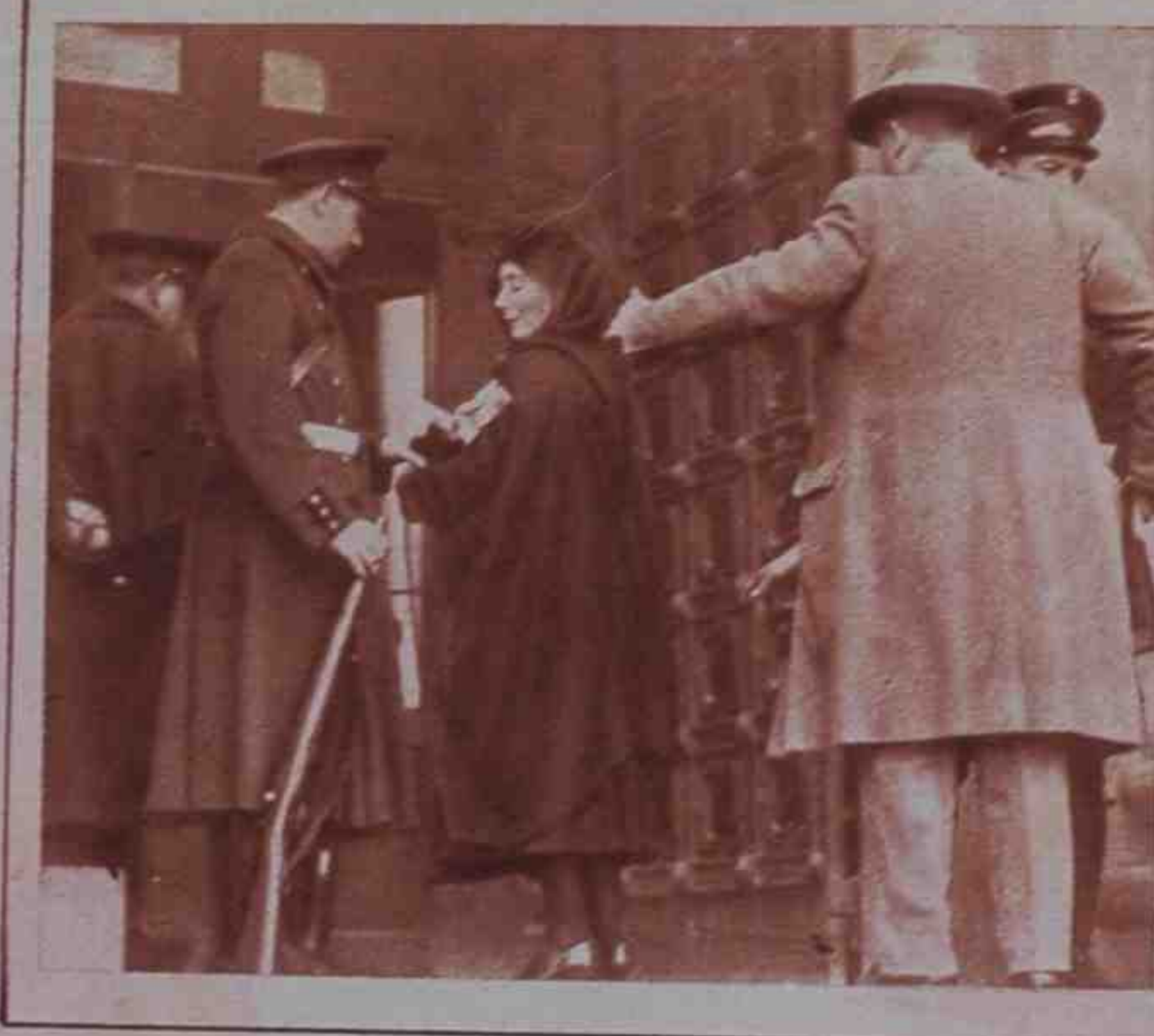
Las fuerzas de Asalto cacheando al público a la entrada del edificio de Correos de la capital catalana.