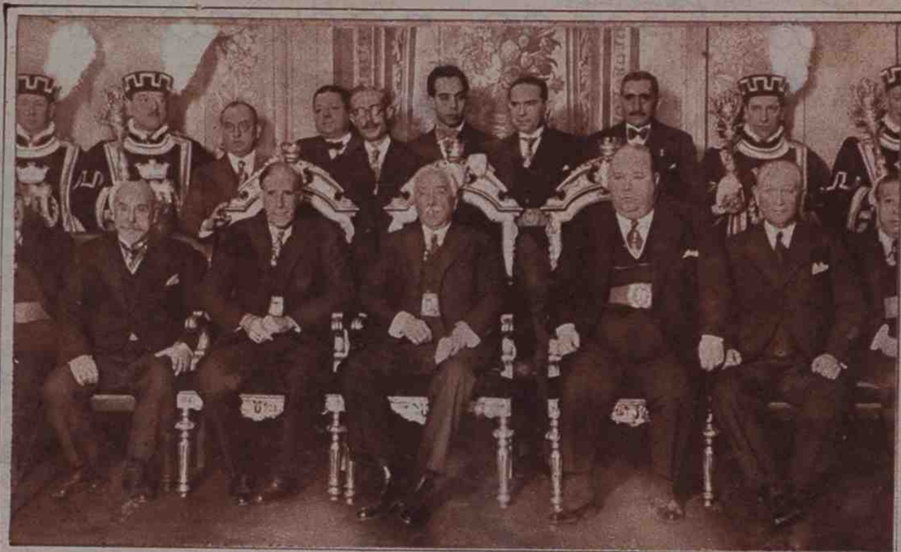
El Presidente de la República ha entregado al alcalde de Madrid un medallón de concejal. El Ayuntamiento ha tributado un homenaje a don Niceto Alcalá Zamora, que en esta fotografía aparece entre los señores Besteiro y Pedro Rico.