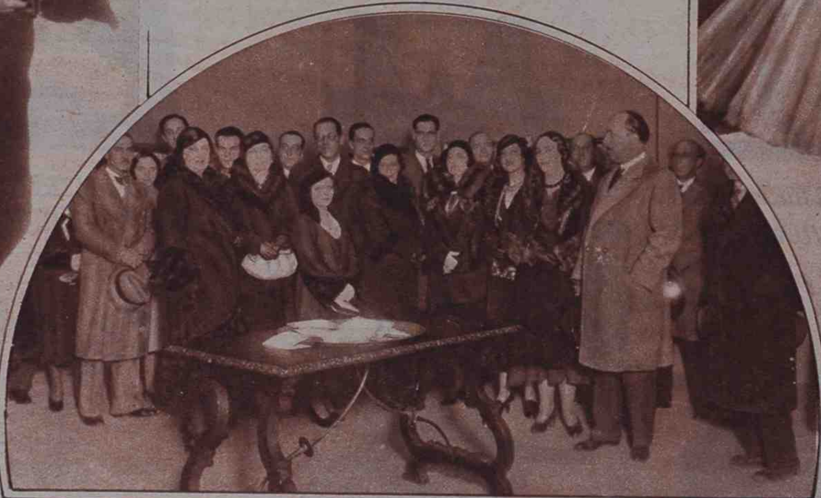
Asistentes a la inauguración de la colección de paisajes, que el notable pintor catalán Manuel Rocamora, exhibe en Barcelona, con extraordinario éxito de crítica. (Foto Badosa.)

LA MEJOR TIENDA DE radio S.I.C.E. AV. EDUARDO DATO, 9 TELEFONO 93924