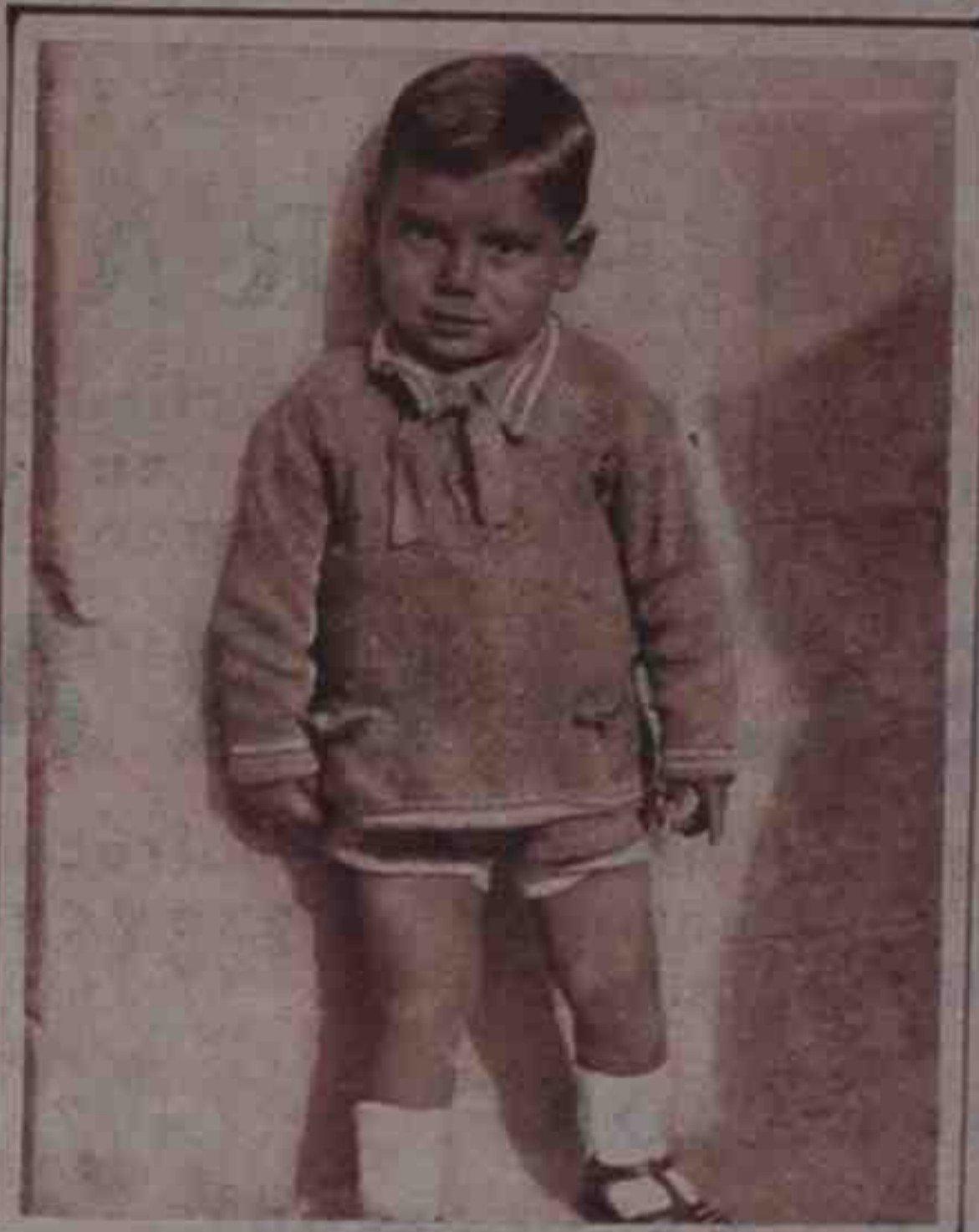
HE AQUI UN CHICO que ha estado perdido durante unos días. El martes, por fortuna, apareció su madre, y los madrileños que se habían conmovido por la suerte del "peque" se han tranquilizado.