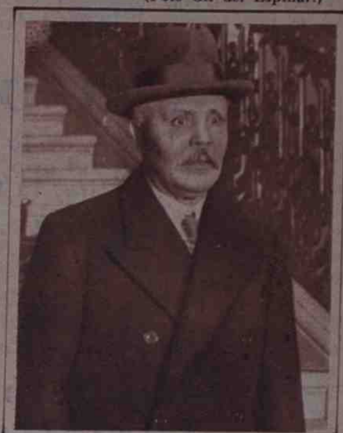
FALLECIMIENTO DE UN POLITICO FRANCÉS. —El señor Loucheur, ilustre político francés, que ha fallecido recientemente, tras una breve enfermedad. Durante la Guerra, organizó el aprovisionamiento de municiones para el Ejército aliado.