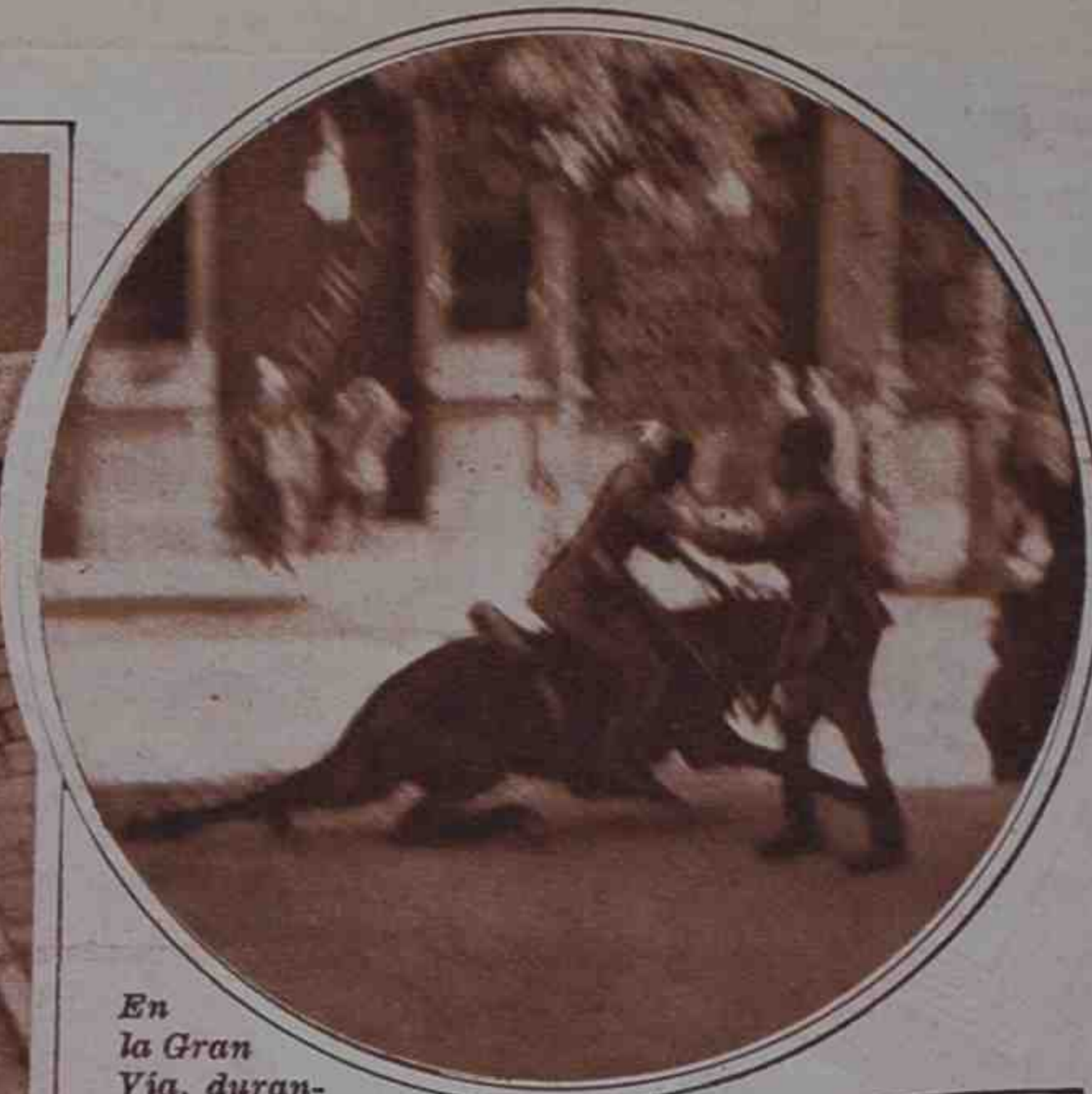
En la Gran Vía, durante una carga, un caballo resbala sobre el empedrado

La intensidad del paro obrero en Granada ha dado lugar a que los sin trabajo se manifiesten en las calles, y que, por último, logren de sus compañeros la huelga general revolucionaria, para protestar de este estado de cosas. La Guardia civil detiene a un huelguista, sorprendido cuando intentaba agredir a la fuerza pública.