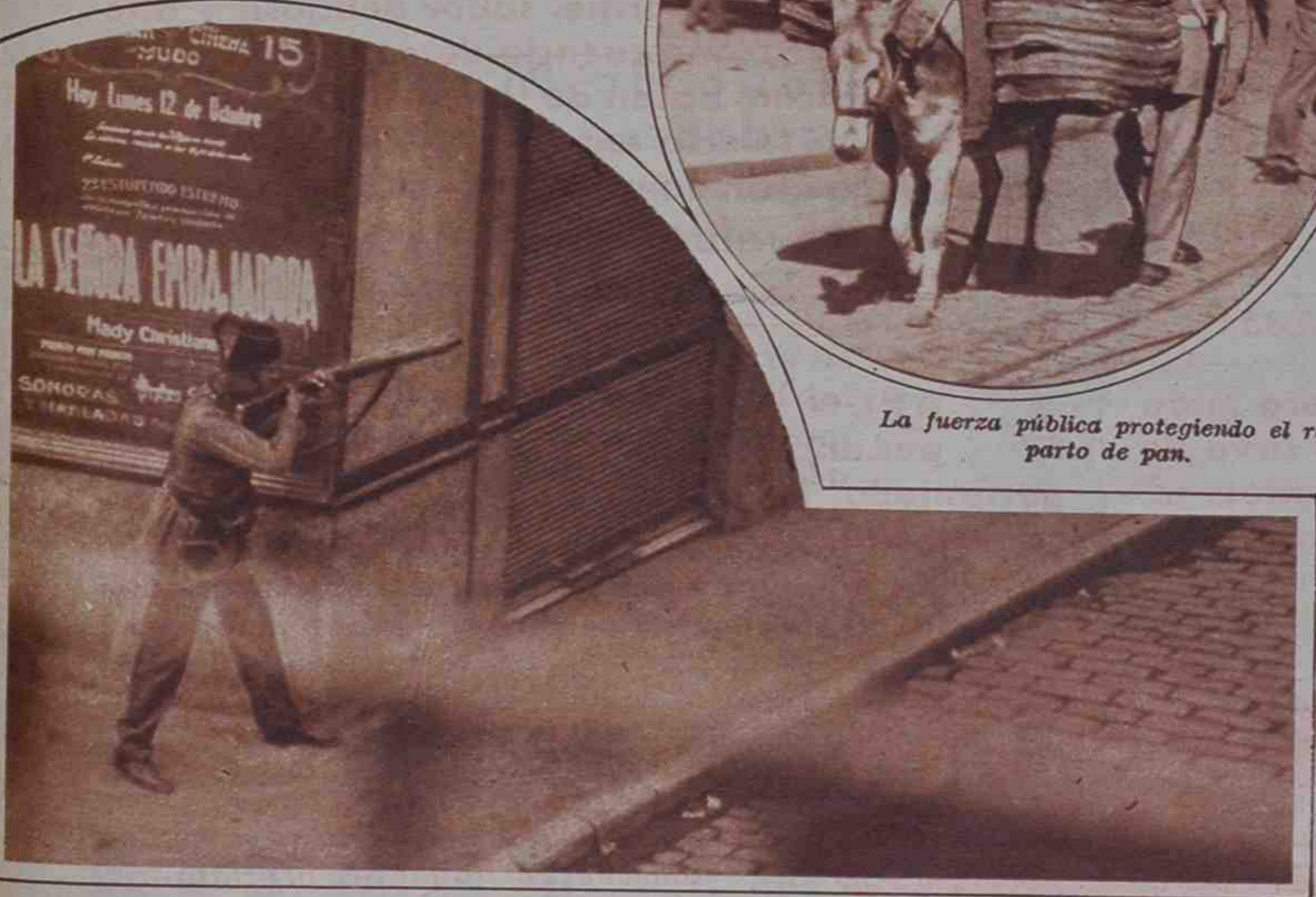
Parapetado en la esquina de una calle, un guardia civil responde, con los disparos de su máuser, a los de los huelguistas.