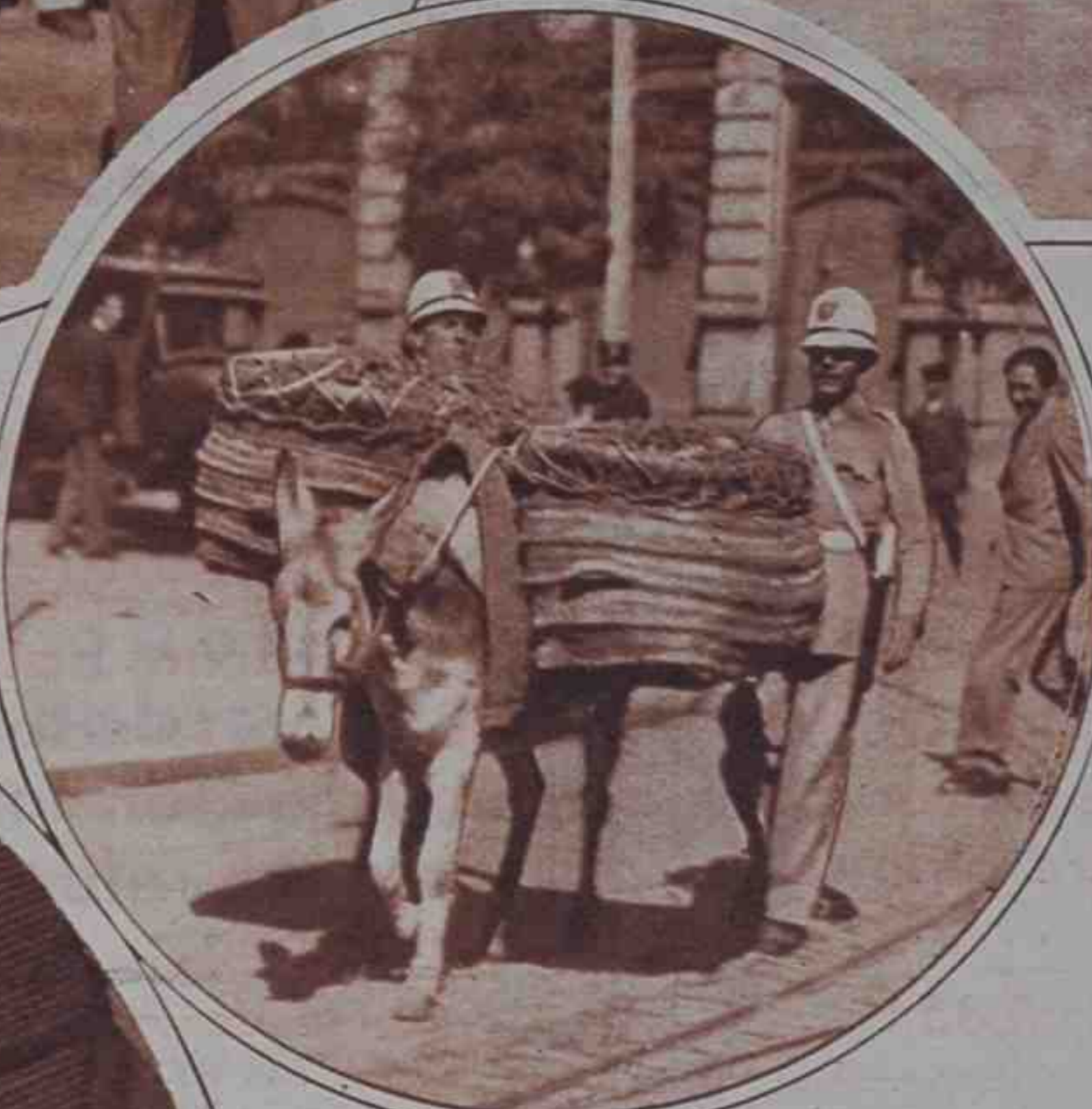
La fuerza pública protegiendo el reparto de pan.