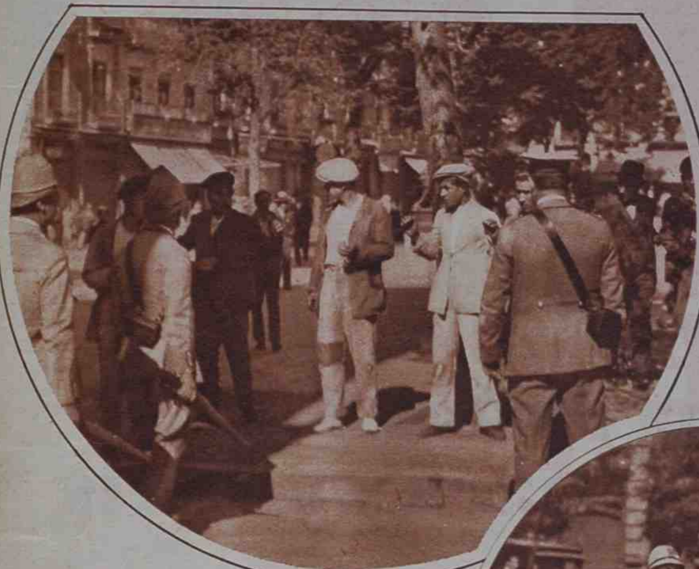
Detención de un grupo de huelguistas agresores por fuerzas de Seguridad.

La intensidad del paro obrero en Granada ha dado lugar a que los sin trabajo se manifiesten en las calles, y que, por último, logren de sus compañeros la huelga general revolucionaria, para protestar de este estado de cosas. La Guardia civil detiene a un huelguista, sorprendido cuando intentaba agredir a la fuerza pública.