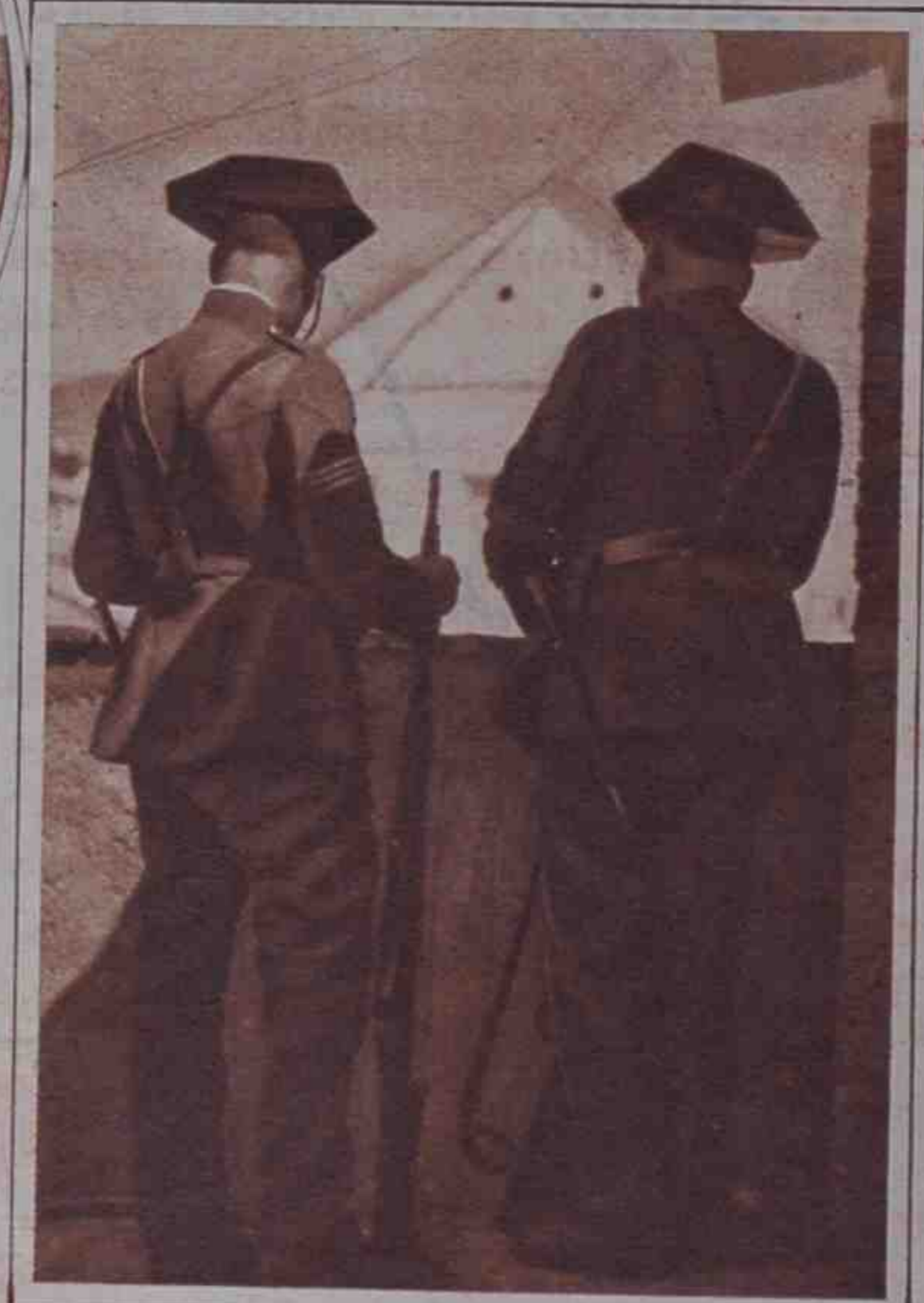
Los huelguistas se han refugiado en un edificio. Temiendo posibles disturbios, la Guardia civil los vigila desde una terraza contigua.