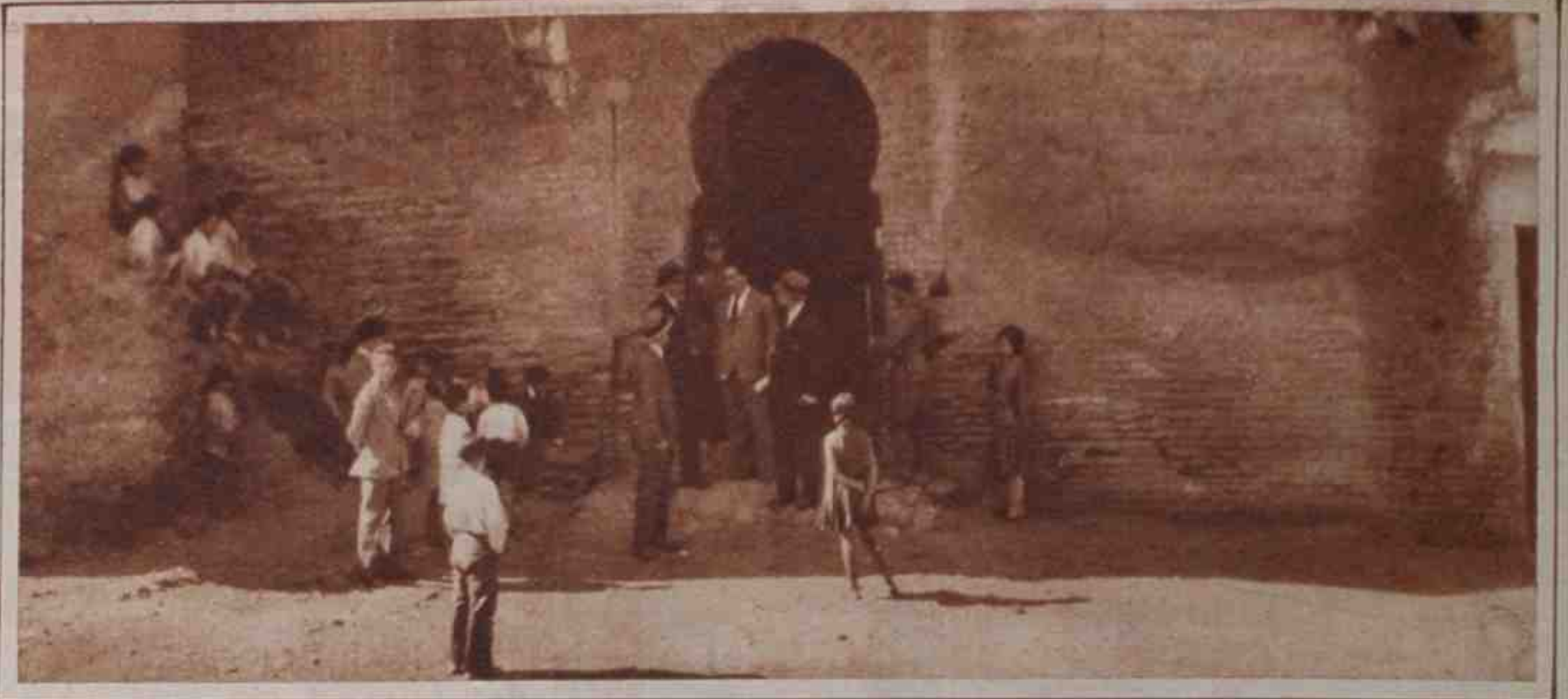
El gobernador civil, con las autoridades, saliendo de Torres Bermejas, prisión de los cabecillas de la huelga general revolucionaria.