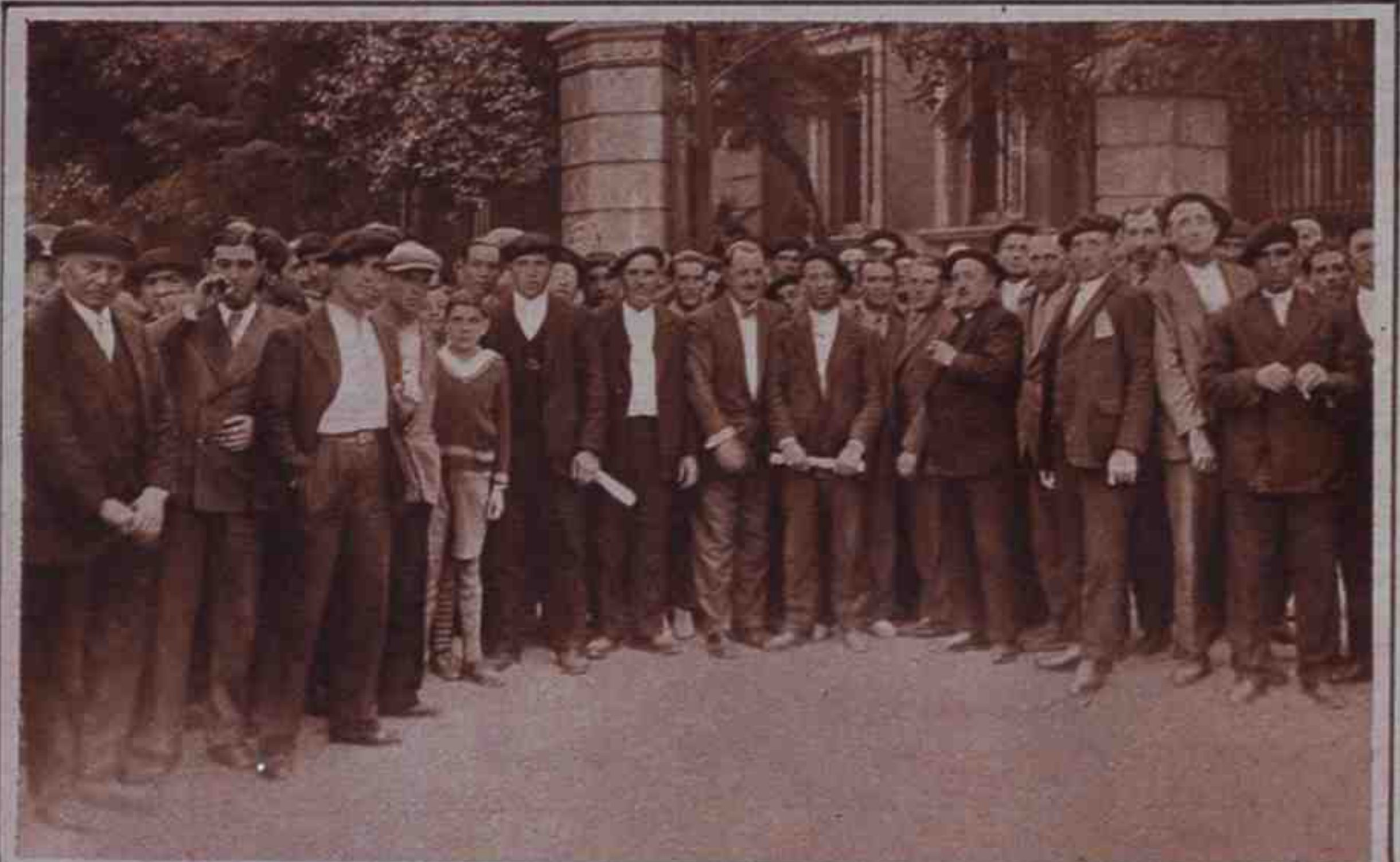
Los alcaldes saliendo de la Presidencia después de entregar el Estatuto.