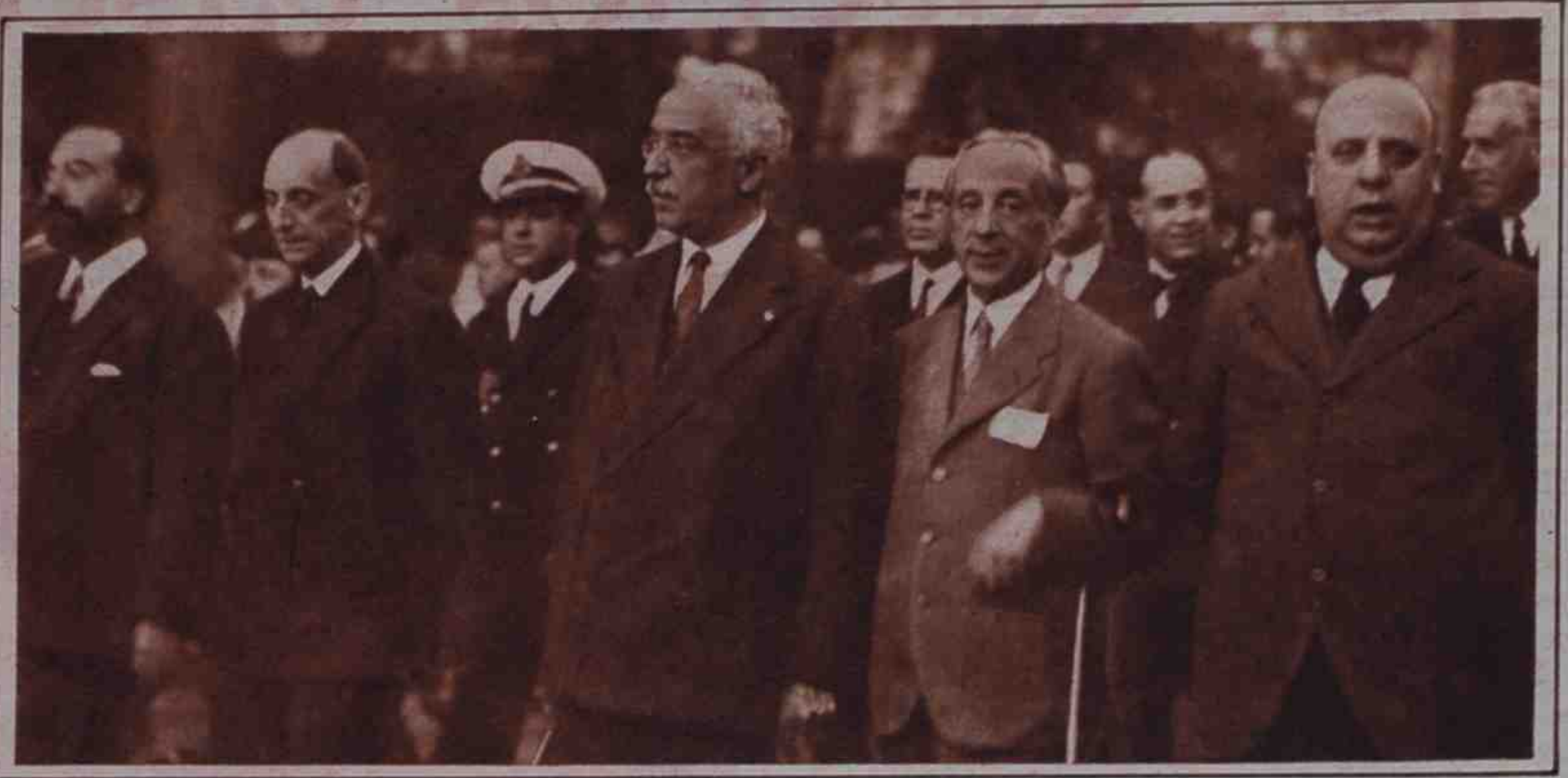
El entierro del veterano político ha dado lugar a una sentida manifestación de duelo por parte de las clases liberales. Asumieron la presidencia, en unión de otros miembros del Gabinete, los ministros de Fomento, Hacienda, Marina y Economía.