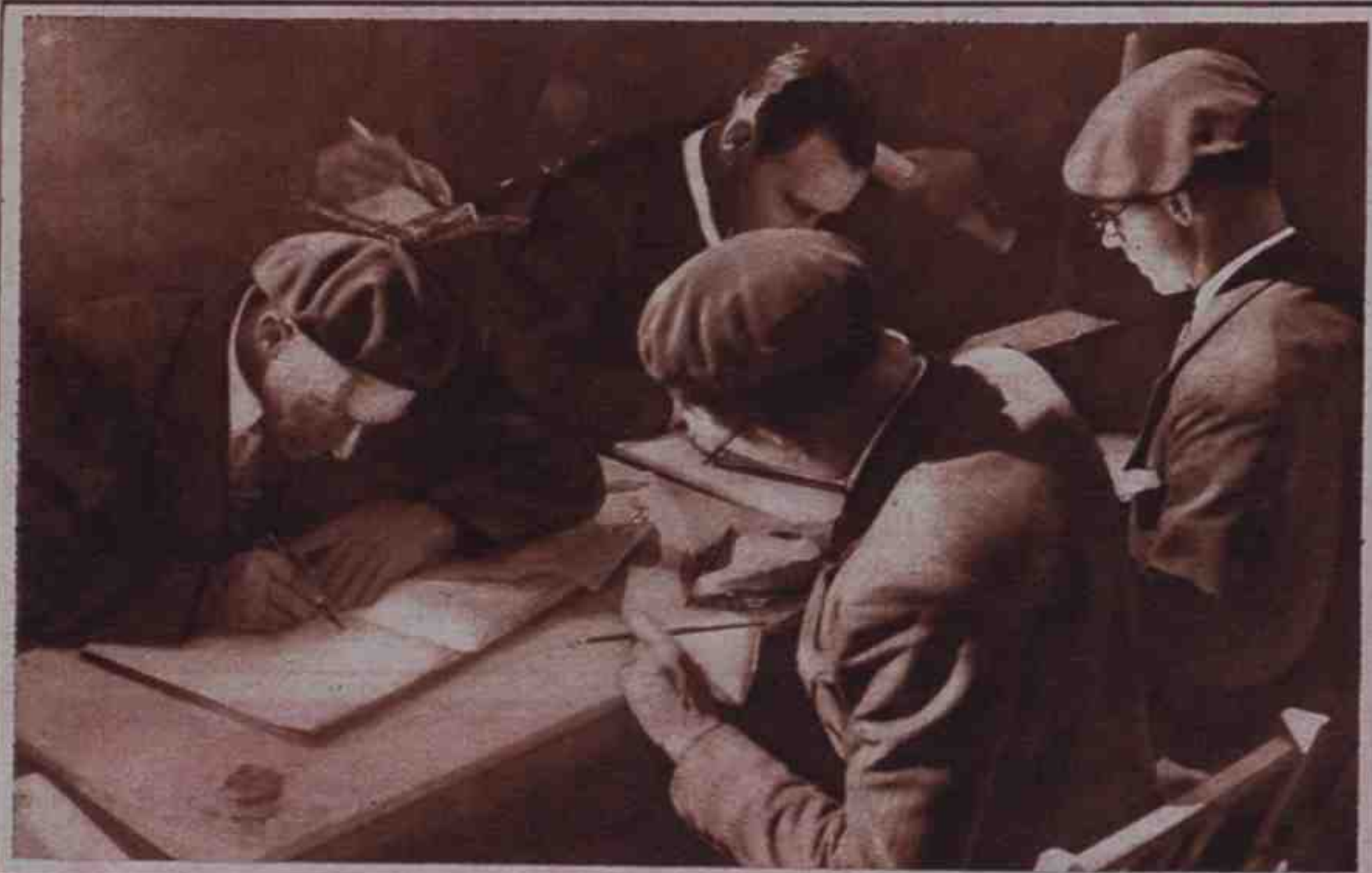
En el Hogar Vasco, de Madrid, se colocaron numerosos pliegos para recoger las firmas de adhesión al Estatuto de Estella.