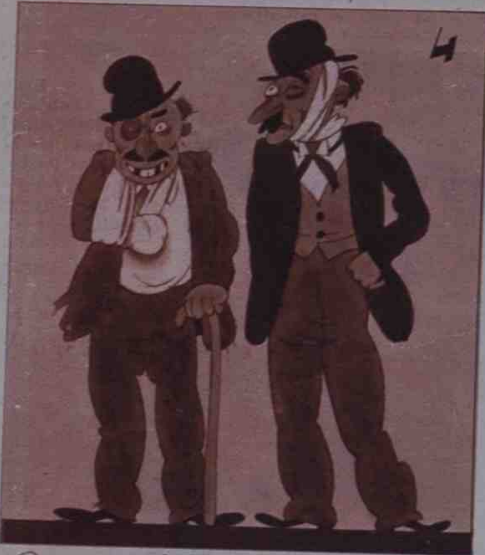
4 Pues no ha habido rozadura entre una y otra figura