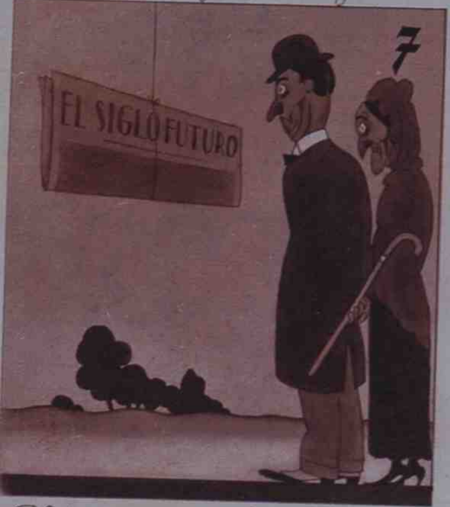
7 El tiempo es duro, muy duro, y más el tiempo futuro