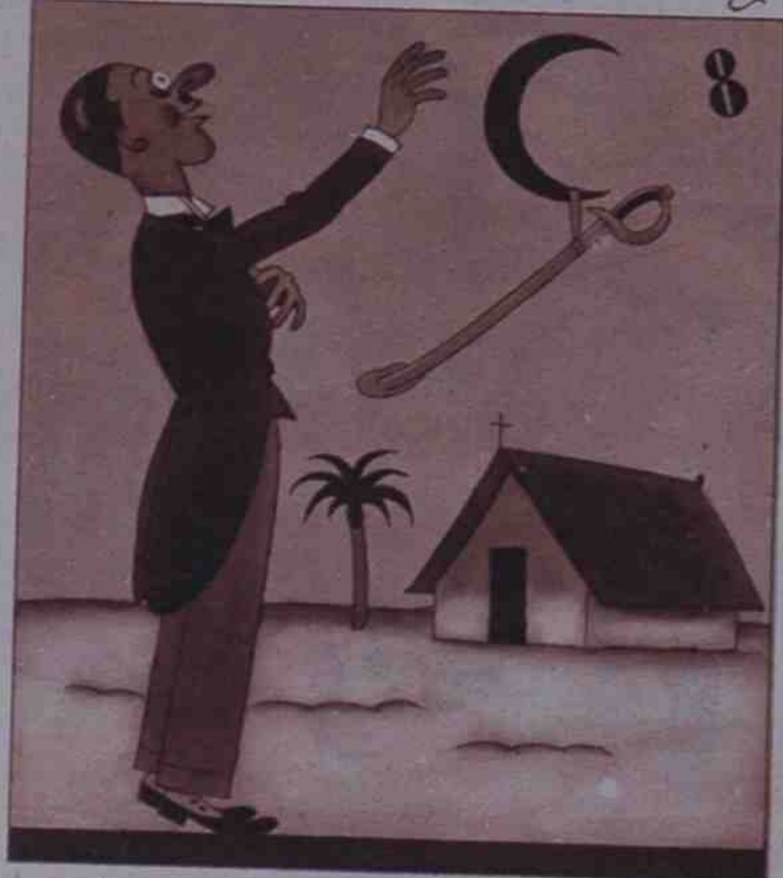
8 Alguien muestra preferencia por la luna de Valencia