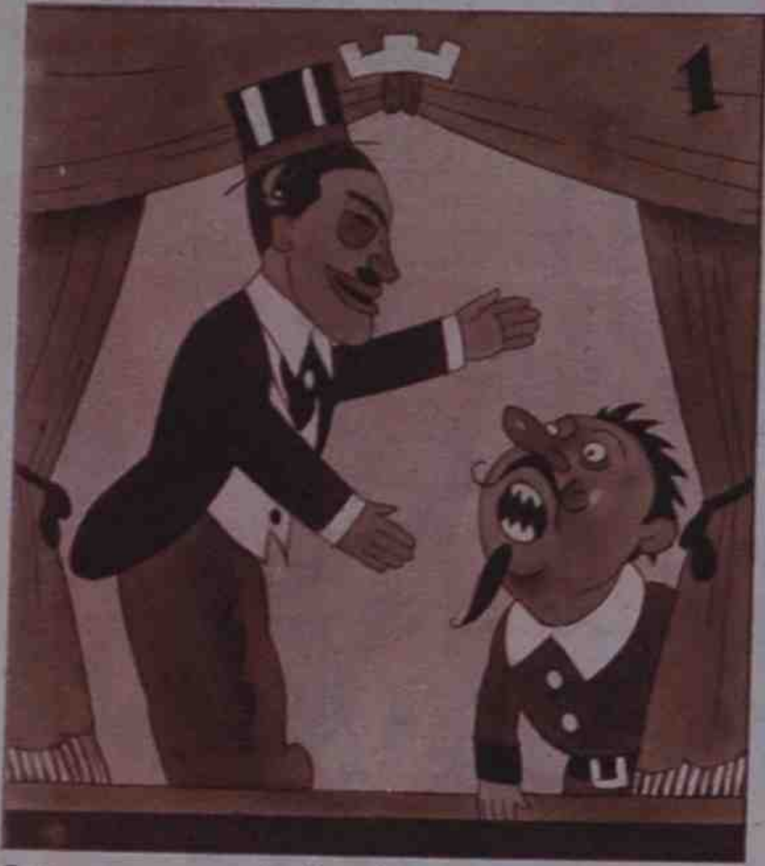
1 Maura el de las cejas foscas convence hasta al Papa-moscas