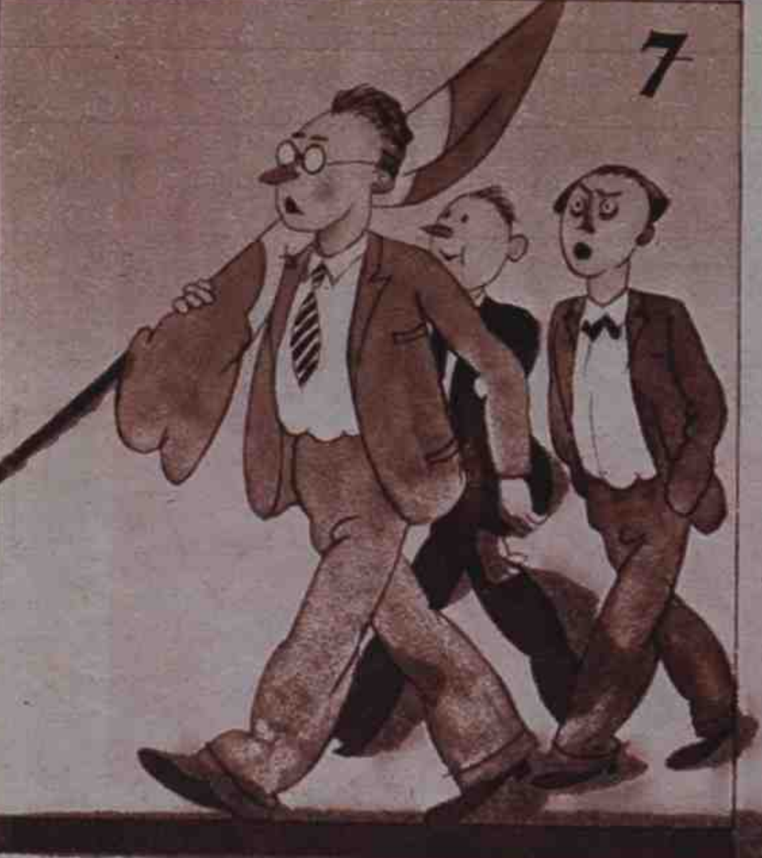
7 Viernes. Hacen su debut los de "¡Voteu l'Estatut!"