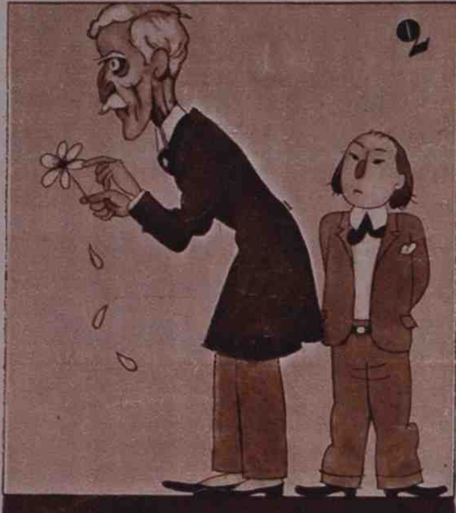
2 Pero "L'Avi", de levita, deshoja una margarita.