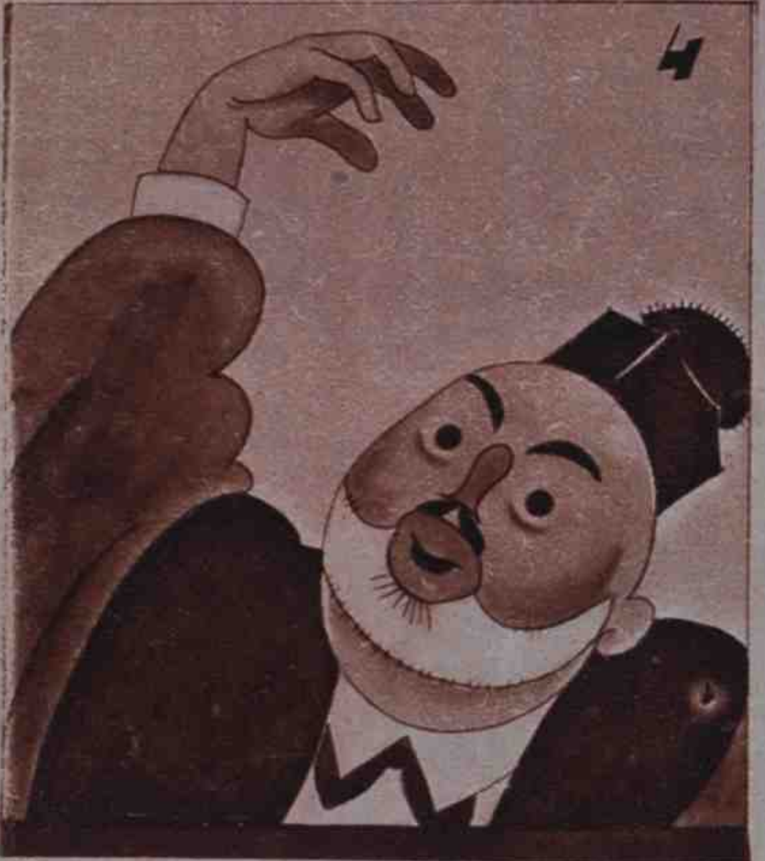
4 En tanto, don Angelote, discurrea con estramboté.