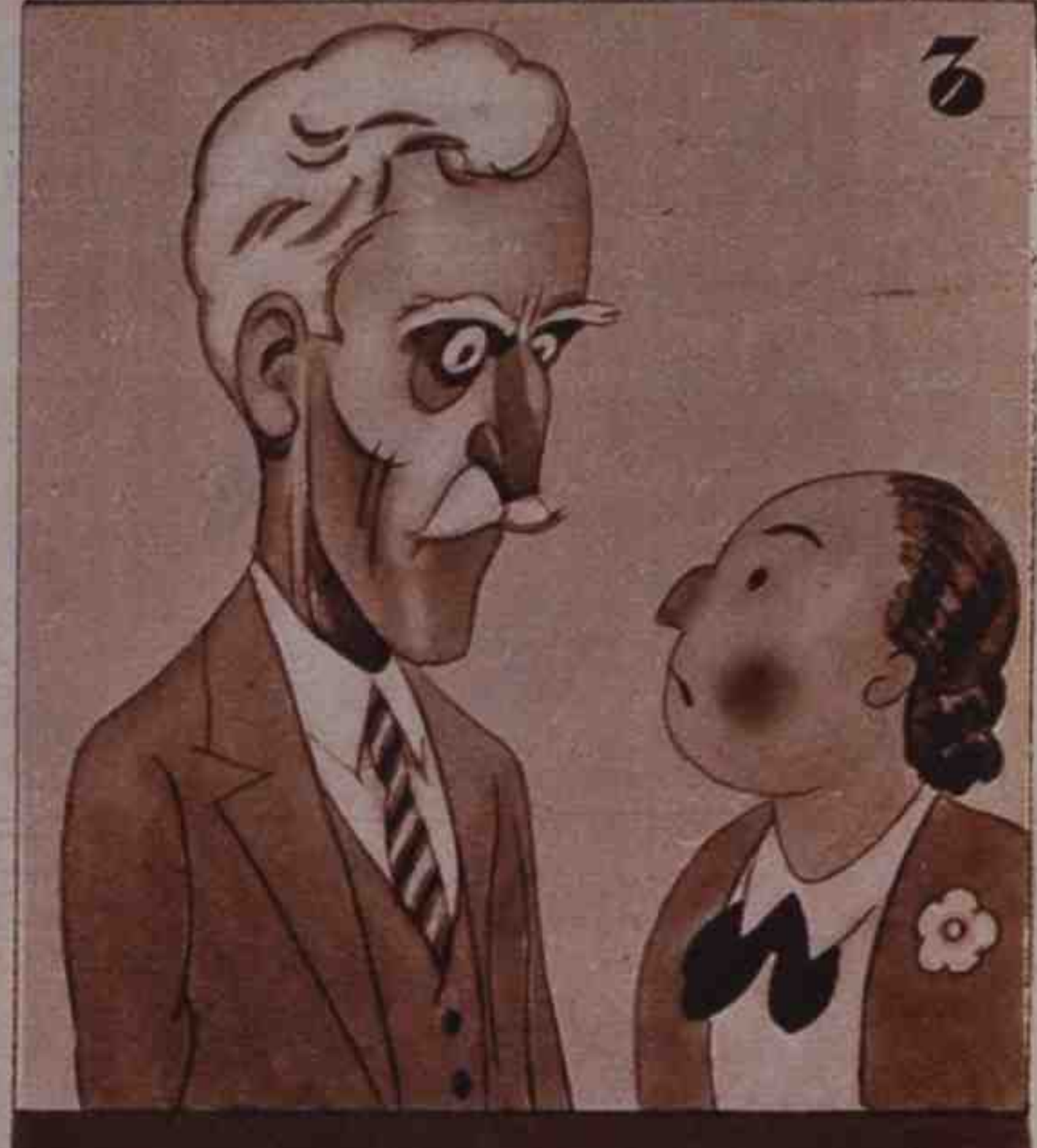
3 -Que si voy... que si no voy... -¡Diguili qui vingi, noy!