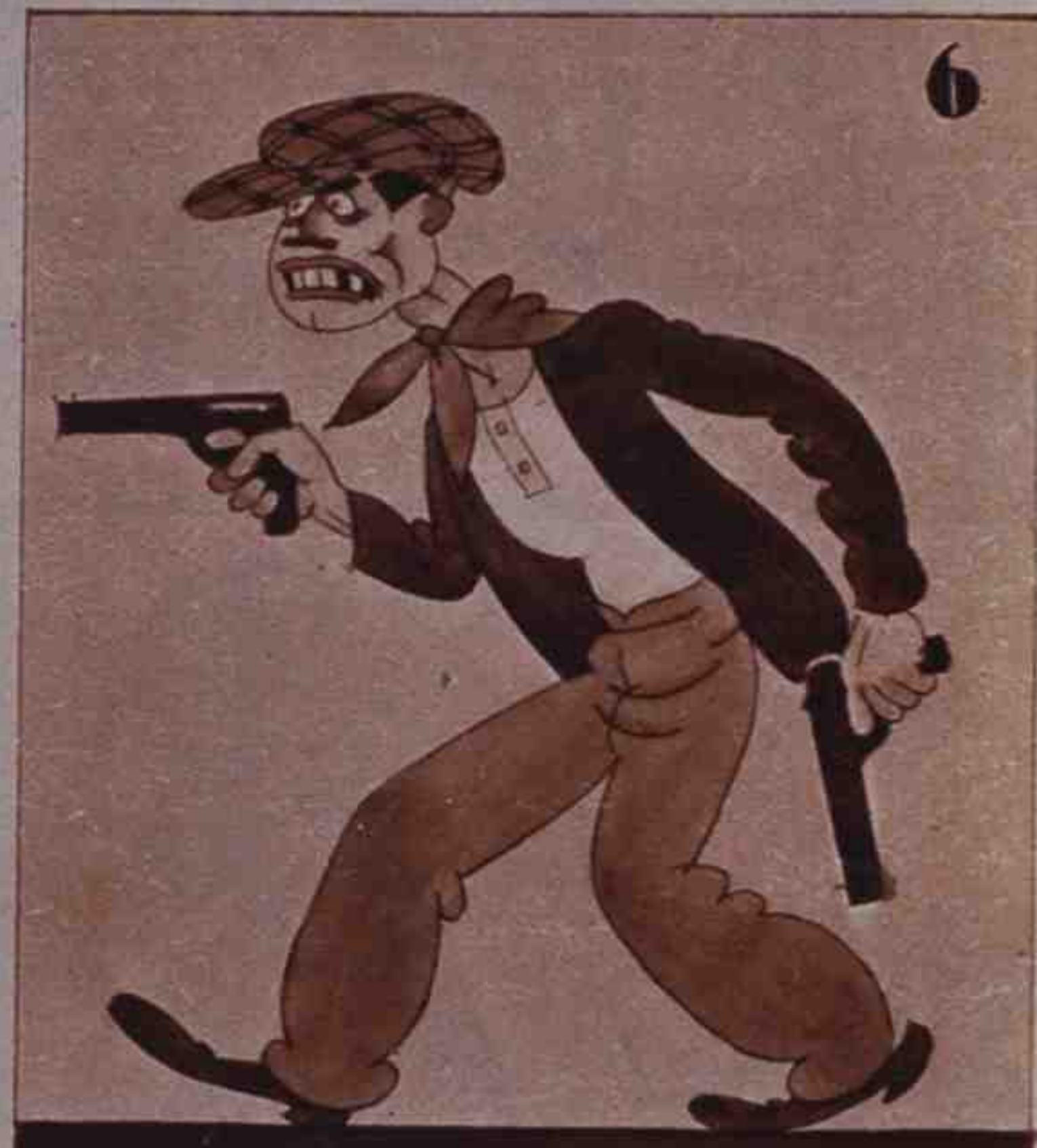
6 En Bilbao, ¡chacolí! hay pistoleros o así.