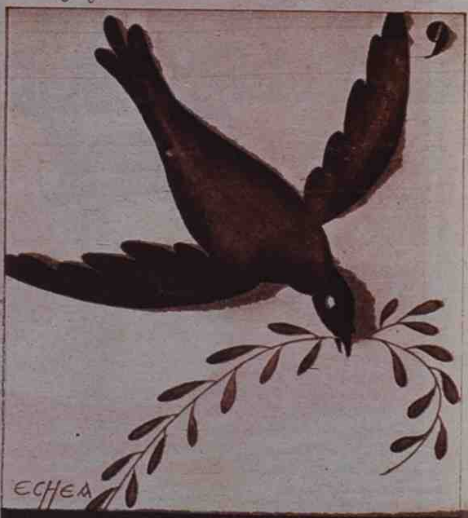
9 Resumen. Cuando esto escribo todo son ramas de olivo.