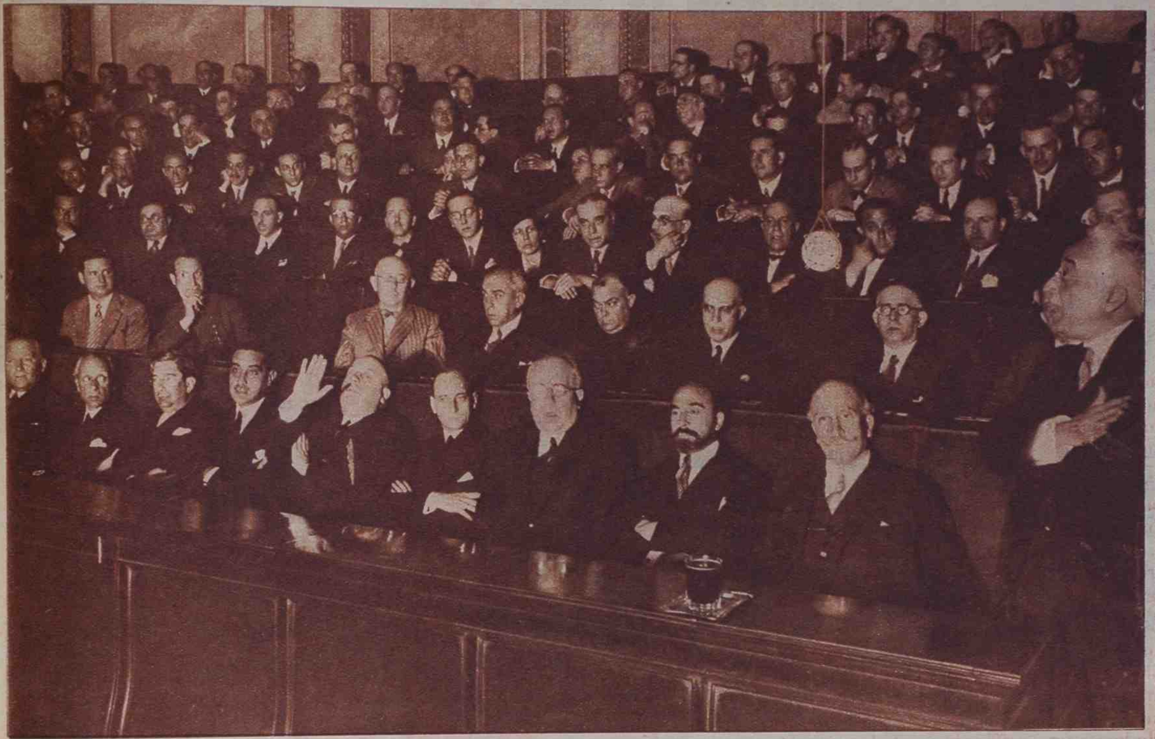
El banco azul, ocupado por el Gobierno provisional, durante el discurso de apertura de las Cortes Constituyentes, del señor Alcalá Zamora. El jefe del Gobierno, entre la emoción de la Cámara, pronuncia las siguientes palabras: "El Gobierno se presenta ante vosotros con las manos limpias de sangre y de codicia, pero no vacías, porque trae en ellas la República intacta y la soberanía plena."