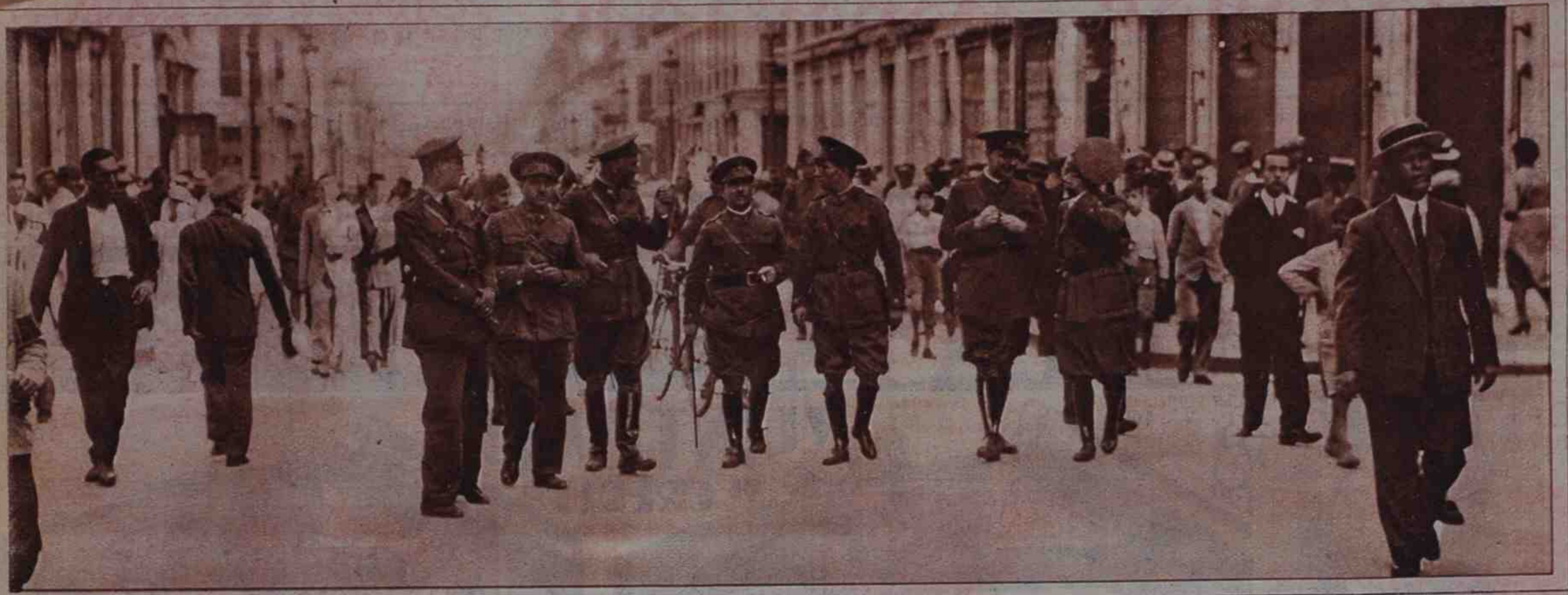
Los elementos extremistas provocaron, durante las elecciones del domingo, en Málaga, sangrientos sucesos. A consecuencia de los mismos se declaró el estado de guerra. En la fotografía, el gobernador militar, con sus ayudantes y otros oficiales, recorriendo la calle del Catorce de Abril después de los sucesos.